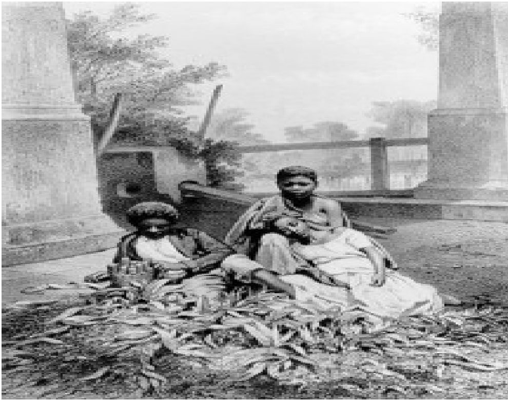
Escravas descansando após o trabalho, Rio de Janeiro. (Jean-Victor Frond)

'Branca para casar, mulata para f***, negra para trabalhar'. 14