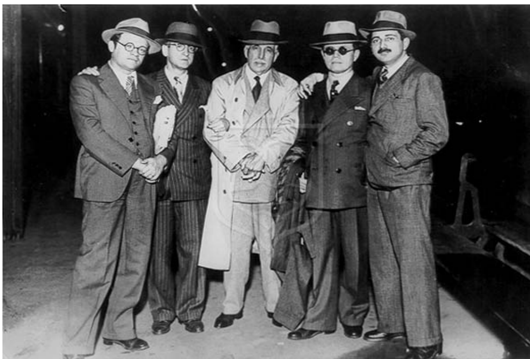
José Lins do Rêgo, Otávio Tarquínio de Souza, Paulo Prado, José Américo e Gilberto Freyre.

O que a tradição tem de distintivo é que ela define um tipo de verdade. Uma pessoa que segue uma prática tradicional não cogita alternativas [...] A tradição é talvez o conceito mais básico do conservantismo, uma vez que os conservadores acreditam que ela encerra uma sabedoria acumulada. 2