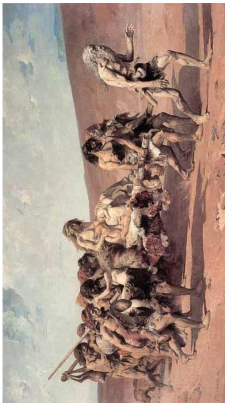
Anexo A - Cain , Fernand Cormon (1880, óleo sobre tela)