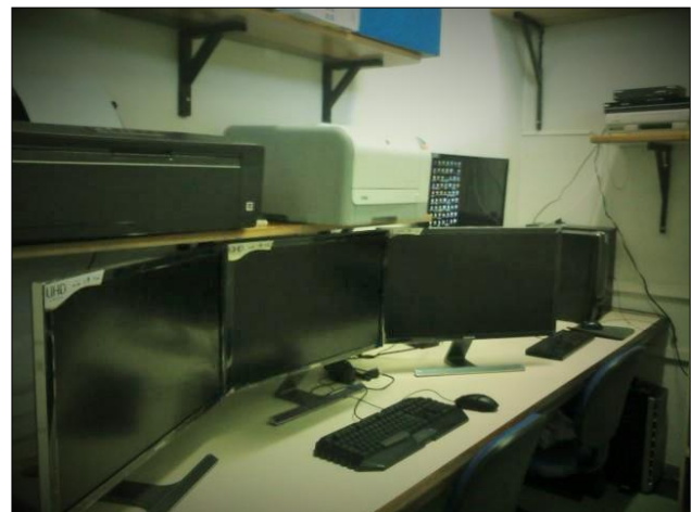
Figura 5. Sala de guarda do acervo audiovisual de edição e produção e de mudança de suporte e mídia – digitalização.

A mudança de sala possibilitou a otimização do espaço, principalmente com a compra da estante deslizante, e melhoras no desempenho das atividades.