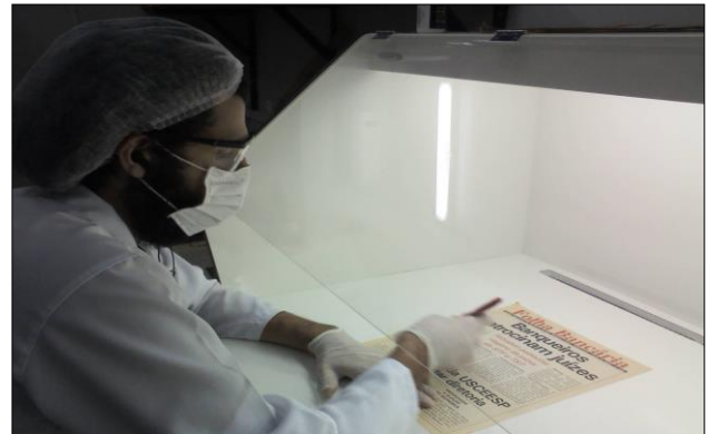
Figura 4. Bolsista higienizando um jornal e utilizando a mesa de higienização.