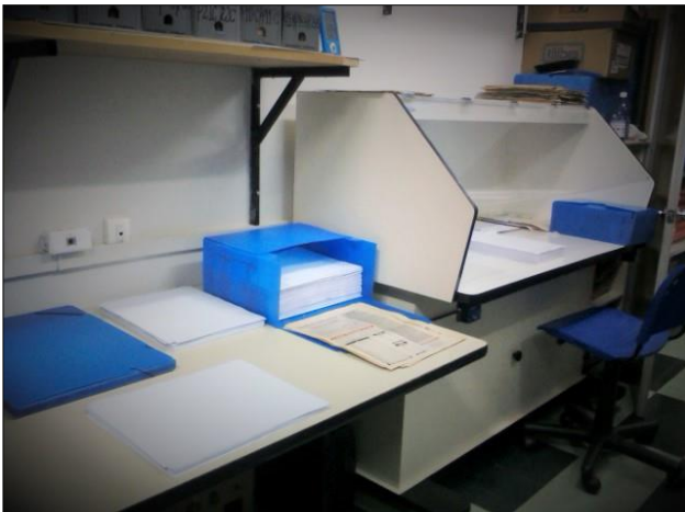
Figura 8. Organização e acondicionamentos dos documentos.

Assim como o CEMOSi, vimos outras iniciativas de construção de centros de memória e documentação universitária e também outros já consolidados que servem de exemplo e inspiração para nossas atividades.