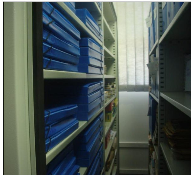
Figura 6. Acervo do CEMOSi localizado na sala nova.

Para ter acesso ao conteúdo das coleções, disponibilizamos os instrumentos de pesquisa no site do CEMOSi, inventário e catálogo, em formato e-book. Além disso, como produtos do Prêmio Memórias Brasileiras, iremos fazer a impressão e distribuir gratuitamente para bibliotecas, centros de memória e documentação, arquivos e grupos de pesquisa que atuam nas temáticas da memória operária, sindical e dos movimentos sociais.