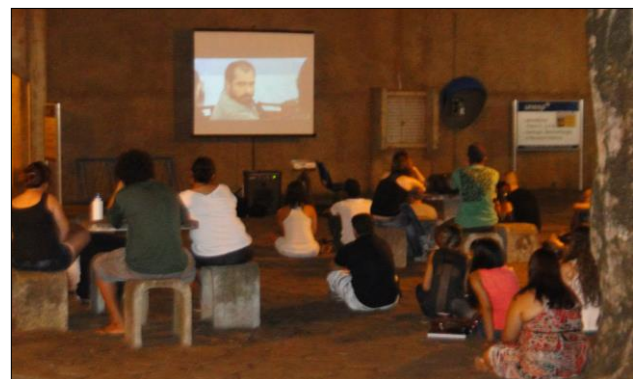
Figura 12. Exposição do filme “O Corte” (Costa Gravas, 2002) durante o Cine-CEMOSi em 2014 na praça dos Tamarindos na FCT/Unesp.

Figuras 10. Exposição realizada em 2011: “As condições de vida dentro e fora do trabalho, dos cortadores de cana-de-açúcar, no Pontal do Paranapanema no espaço da Biblioteca da FCT. (Autor: CEMOSi, 2011)