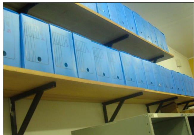
Figura 7. Acervo: documentos organizados e em fase de identificação e separação.