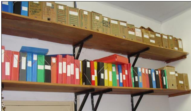
Figura 1. Acervo acondicionado na antiga sala do CEMOSi. (Autor: CEMOSi, 2011).

adequada. Atualmente estamos em uma sala com 32 m 2 , quase o dobro, onde dividimos o espaço em três salas: uma com os equipamentos e materiais ligados à produção de audiovisual, uma com a estante deslizante e o acervo, e outra para o tratamento técnico, com a mesa de higienização. Seguem as imagens da antiga e atual sala do CEMOSi.