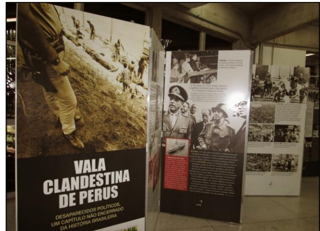
Figura 11. Exposição “Vala Clandestina de Perus” que ocorreu durante a Jornada de Atividades “50 anos do Golpe Militar - Memória, História e Direitos Humanos” em 2014.