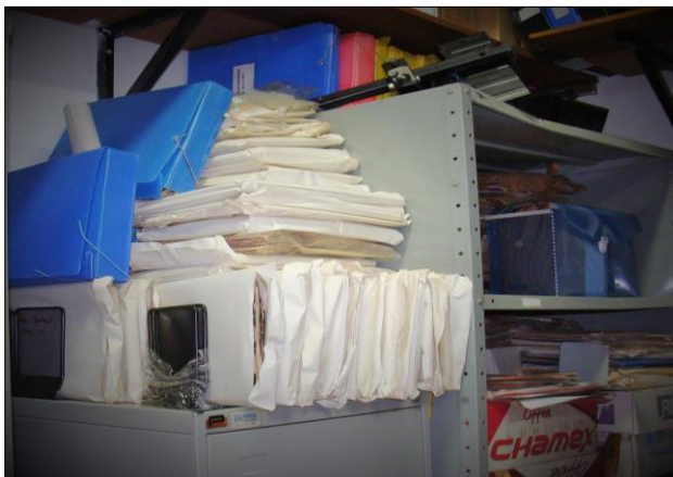
Figura 2. Documentos acumulados desordenadamente e sem intervenção, localizados na antiga sala.