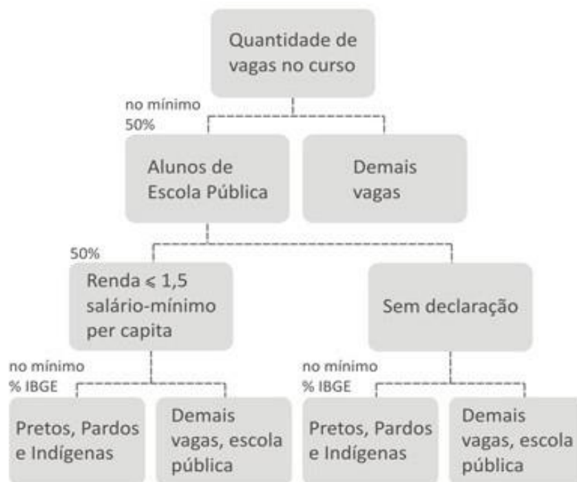
Figura 1. Distribuição das vagas em IPES a partir da lei 12.711/2012.

A partir de 2012, as preocupações passaram a dirigir-se aos diferentes formatos de AAs, aos processos de seleção, aos procedimentos adotados para efetivar a política e a como seria a implementação da Lei 12.711/2012. De acordo com a Lei, nas universidades e institutos federais, 50% das matrículas, por turno, seriam destinadas a alunos oriundos de escola pública e, dentre estes 50%, as vagas deveriam ser distribuídas entre: pretos, pardos e indígenas 45 , em proporção, no mínimo igual, à do último censo realizado pelo IBGE para o estado onde se localiza a instituição.