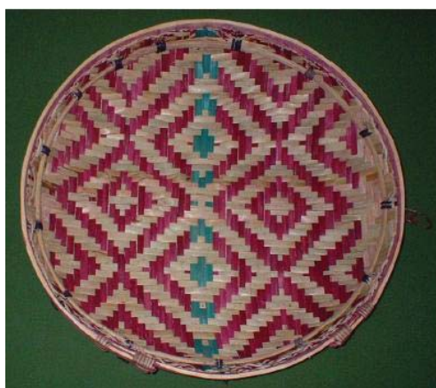
Figura 2 – geometria dos nativos (Gerdes)

Gerdes (13 jul 2012) destaca em seu trabalho em Moçambique o pensamento geométrico desse povo contradizendo o pressuposto que esse conhecimento é uma herança (hegemonia) grega. Mostra que esse pensamento está presente nas atividades rotineiras do dia a dia como confecção ferramentas – cestos (Fig.2), vasos - a serem empregados na colheita e na caça, transcendendo aos cultos e rituais da cultura local. O autor propõe voltarmos às tradições e à história do desenvolvimento da matemática dos povos que foram sufocadas em seu contexto social, cultural e intelectual devido à prática da colonização e escravidão fazendo com que suas ideias e seu pensamento fossem “abafados” ou esquecidos. O que Gerdes (1996, p.5) chama de “Matemática Oprimida”.