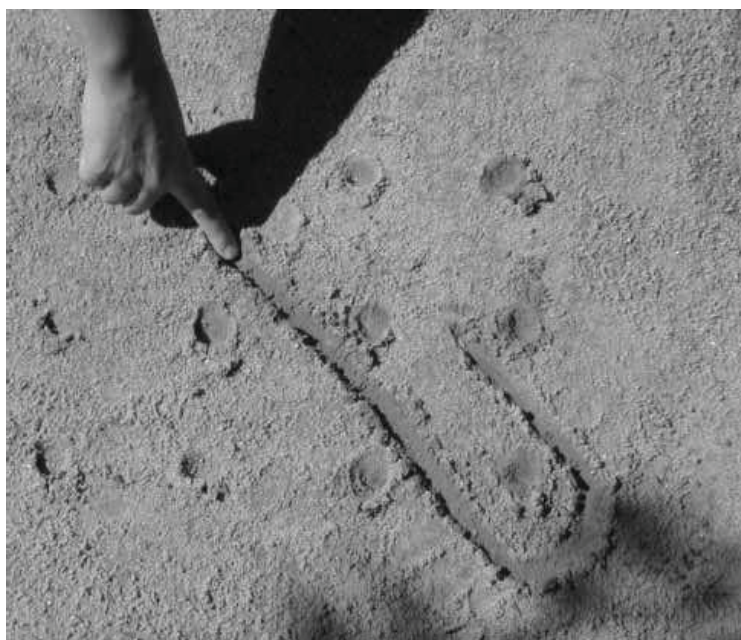
Figura 3 – confecção do sona (Eguimara, 2011)

forma de transmitir os conhecimentos e tradições da tribo às novas gerações. Para simplificar, reduzir a memorização e guardar os detalhes do conhecimento, os contadores – chamados de especialistas ou Akwa Kuta Sona – desenvolveram um tipo de sistema de coordenadas com linhas e colunas formando gráficos na areia angolana para que nada se perca, mas que mantenha a tradição e o sona vivos (Fig.3 e 4). Vemos nesse caso que uma tradição – os sona – rompeu o campo etnológico e permitiu a abertura de uma nova matemática.