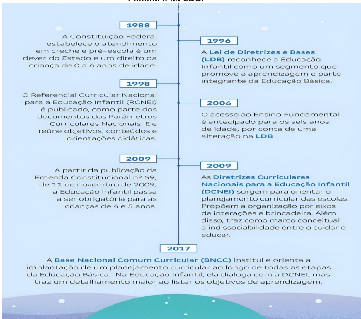
Figura 2 - Políticas públicas educacionais decorrentes da Constituição Federal e da LDB.