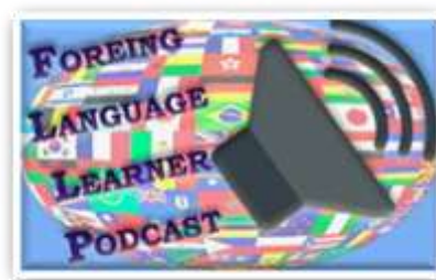
FIGURA 1: PROPOSTA DE LOGO PARA O PROJETO