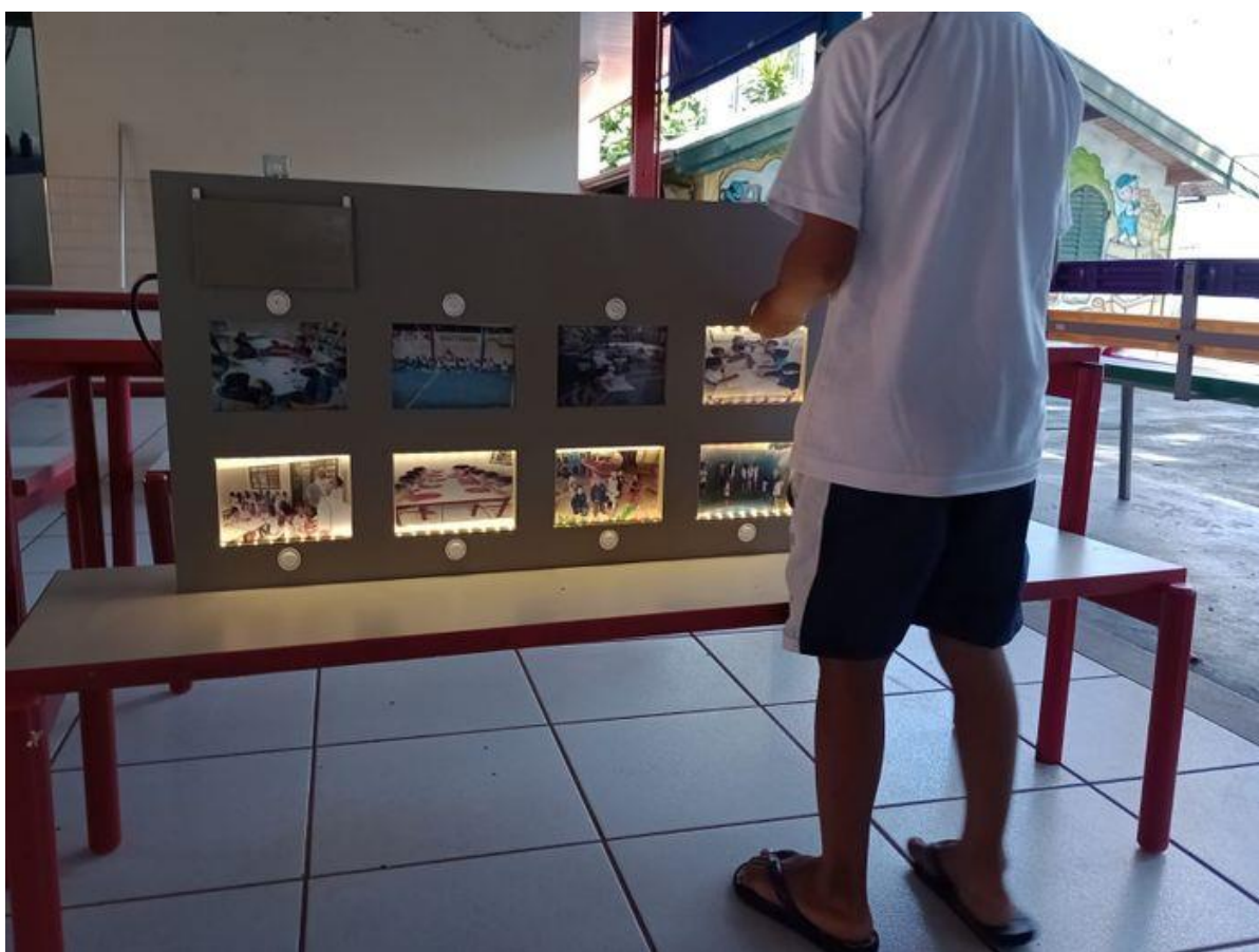
Figura 6 - Utilização do Hello Educ no espaço pátio