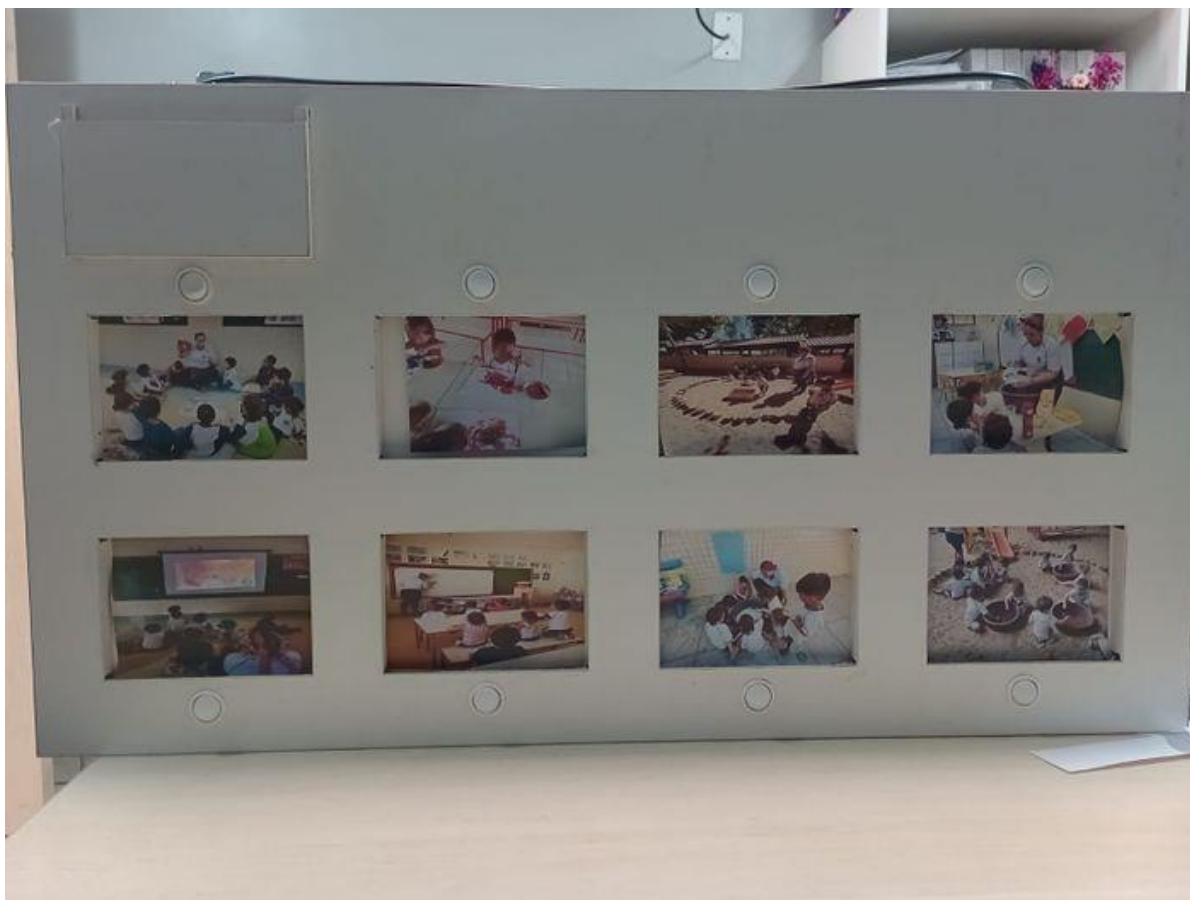
Figura 3- Hello Educ com as imagens da rotina escolar luzes apagadas