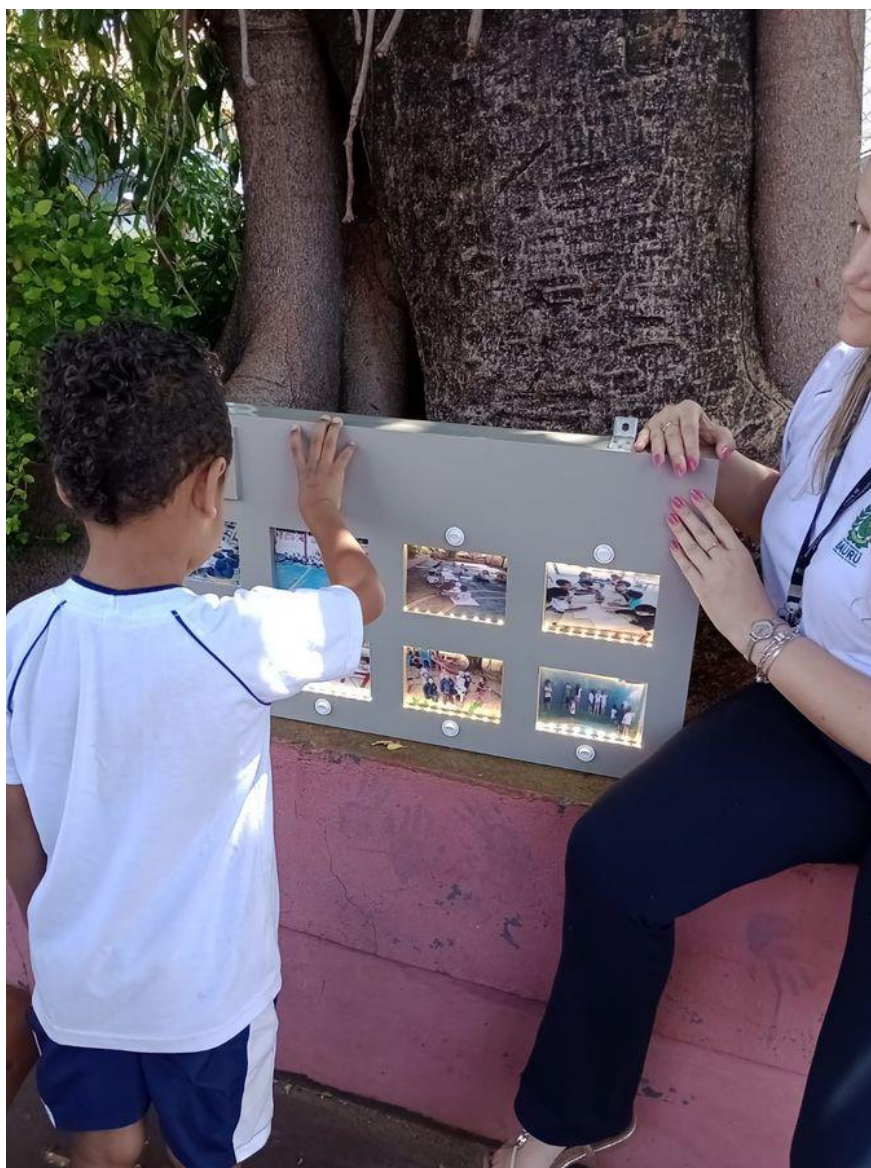
Figura 8 - Utilização do Hello Educ no espaço quadra

Fonte: elaborado pela pesquisadora (2024).