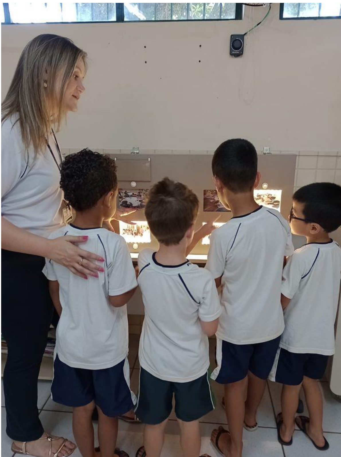
Figura 7 - Utilização do Hello Educ no espaço sala de referência da turma

Fonte: elaborado pela pesquisadora (2024).