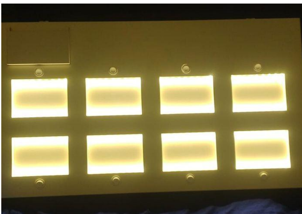
Figura 1- Hello Educ luzes de LED acesas