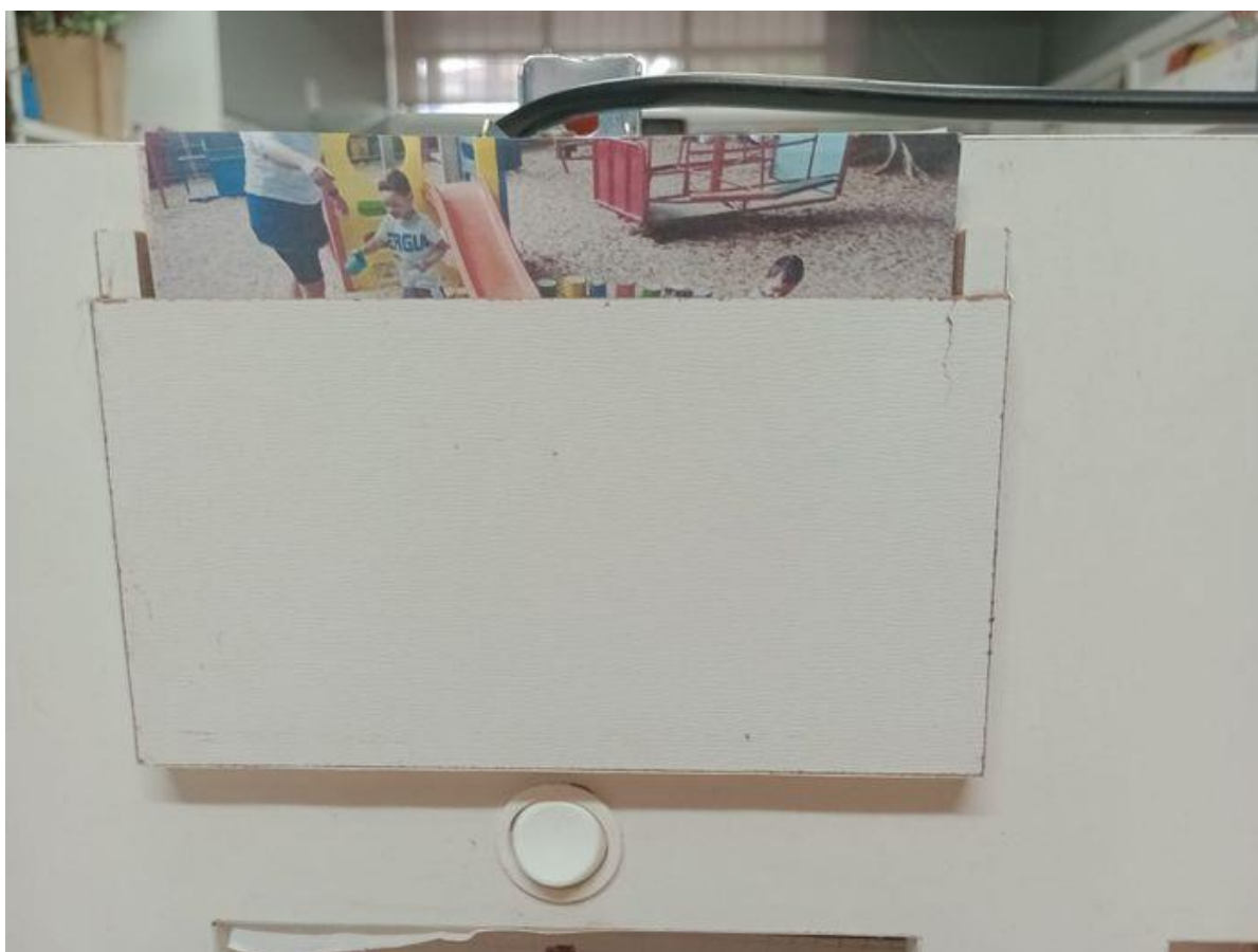
Figura 5 - Compartimento para fotos, painel Hello Educ