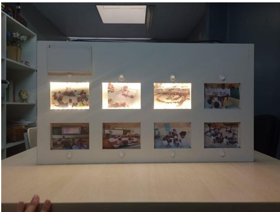
Figura 4 - Hello Educ com imagens reais da rotina luzes acesas