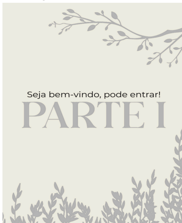
Figura 2 – As partes divisoras