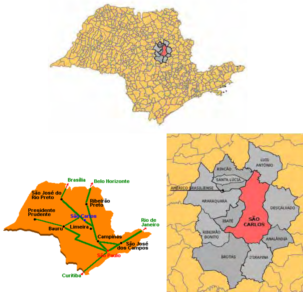
MAPA 1 – LOCALIZAÇÃO DO MUNICÍPIO DE SÃO CARLOS

problema são: falta de recursos financeiros, falta de voluntários para o desenvolvimento de atividades, insuficiência de recursos materiais, necessidade de pessoal qualificado para atender as especificidades, entre outras (MARTINS, on-line).