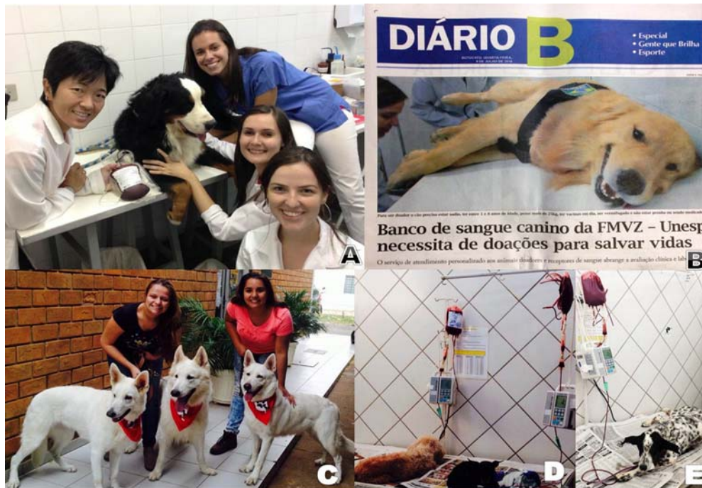
Figura 1. A – Cão doador ao lado da bolsa coletada. B – Capa da matéria sobre o Banco de Sangue Canino. C – Doadores com a bandana do Banco de Sangue. D e E – Cães recebendo transfusão sanguínea.