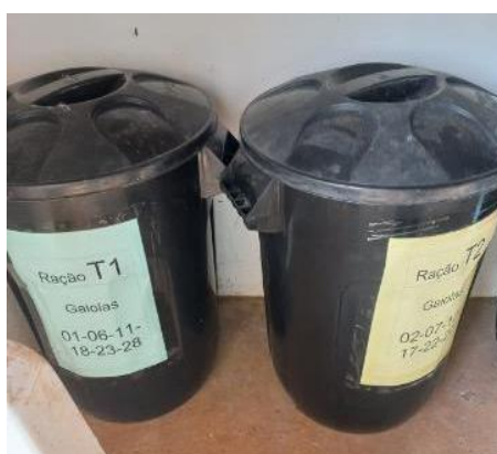
Figura 4 - Recipientes para armazenamento de rações com identificação dos tratamentos.

dieta com inclusão de antibiótico possuía 0,0050% de avilamicina + 0,0525% de inerte; dieta com inclusão de OE (óleos essenciais) continha 0,0075% de OE + 0,0500% de inerte; dieta com inclusão de AB (ácido butírico) era constituída por 0,0500% de AB + 0,0075% de inerte; e por fim, dieta com inclusão de OE + AB possuía 0,0075% de OE + 0,0500% de AB.