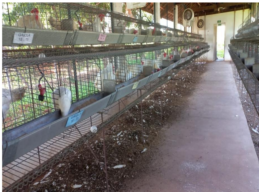
Figura 2 - Vista interna do galpão de avicultura com galinhas poedeiras em sistema de gaiolas.