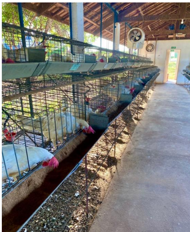
Figura 3 - Disposição das fileiras de gaiolas e sistema de ventilação do galpão experimental.