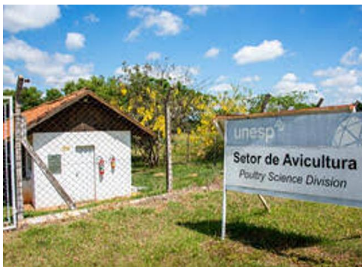
Figura 1 - Setor de Avicultura da FCAT - UNESP, câmpus de Dracena.

O estudo foi conduzido no galpão para galinhas poedeiras do Setor de Avicultura (Figura 1) da FCAT - UNESP, câmpus de Dracena. Foram alojadas 60 galinhas poedeiras da linhagem Hisex White , com 100 semanas de idade (final de produção) em um ciclo de 28 dias.