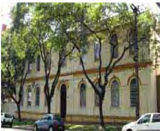
Figura 5 – Centro Universitário Claretiano – Curitiba/PR

Em Curitiba, a Ação Educacional Claretiana mantém o curso de Teologia, destinado à formação humana. Além disso, é polo dos cursos a distância do Centro Universitário Claretiano, além de desenvolver atividades sociais para a população carente.