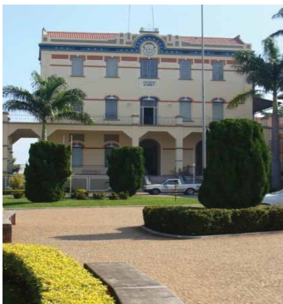
Figura 3 - Centro Universitário Claretiano – Rio Claro/SP

projetos sociais. Está localizada na Avenida Santo Antonio Maria Claret, nº. 1724 no bairro Cidade Claret. Também em Rio Claro, uma nova unidade no bairro Terra Nova está sendo construída, onde funcionará um complexo para atividades sociais, esportivas e de atendimento à população carente desse bairro, que é o mais necessitado da cidade.