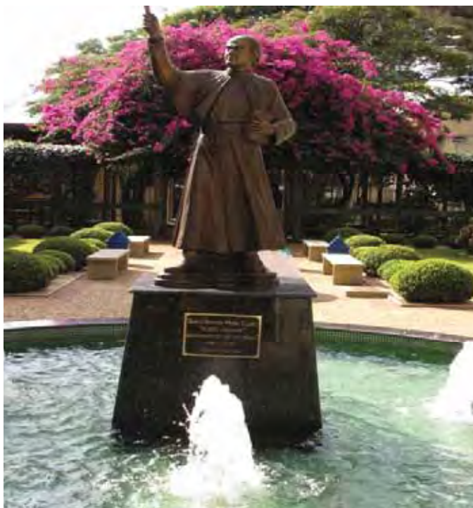
Figura 9 – Centro Universitário Claretiano Batatais - CEUCLAR - Estrutura física - Batatais/SP

distinguindo-se especialmente pelo cultivo da cana de açúcar e pelas indústrias do calçado, açúcar e álcool.