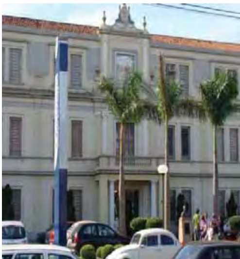
Figura 1 – Centro Universitário Claretiano – fachada - Batatais/SP