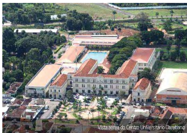
Figura 8 - Centro Universitário Claretiano – Batatais – SP. – Brasil

O Centro Universitário Claretiano (CEUCLAR), é uma instituição educacional mantida pela Ação Educacional Claretiana (EDUCLAR). Dirigida pelos Padres Missionários Claretianos desde 1925, com sede à Rua Dom Bosco, 466, Bairro Castelo, na Cidade de Batatais, cidade que conta com 56.035 habitantes e está situada no nordeste do estado de São Paulo, na região da Alta Mogiana, entre os municípios de Ribeirão Preto e Franca, aproximadamente a 350 km da capital. Na região, a economia está baseada na agricultura,