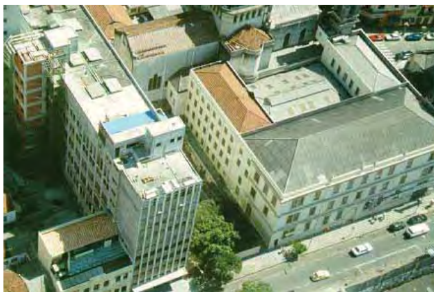
Figura 4 – Centro Universitário Claretiano São Paulo/SP