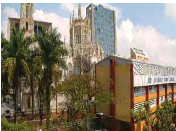
Figura 6 – Centro Universitário Claretiano – Belo Horizonte/MG

Em Belo Horizonte, a Ação Educacional Claretiana mantém o Colégio Claretiano Dom Cabral, que oferece Educação Infantil, Ensino Fundamental e Ensino Médio, e que também é polo dos cursos a distância do Centro Universitário Claretiano, além de desenvolver importantes atividades sociais para a população carente.