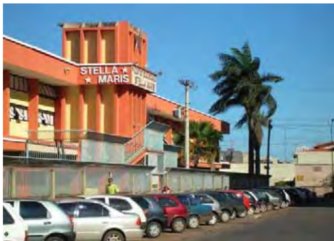
Figura 7 – Centro Universitário Claretiano – Taguatinga - DF