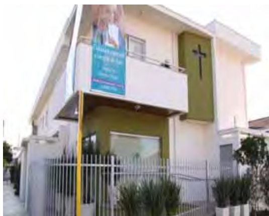
Figura 2 – Centro Universitário Claretiano – Domus Claret - Batatais/SP