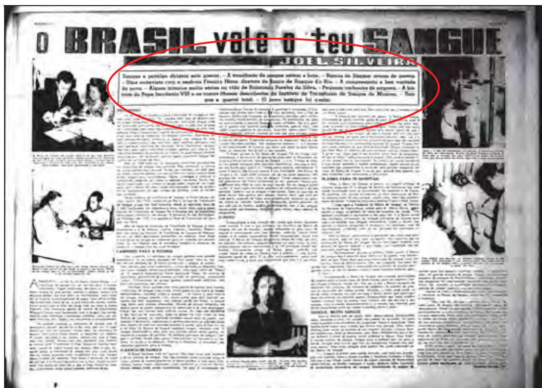
Figura 15: Reportagem de Joel Silveira “O Brasil vale o teu sangue”. Diretrizes , RJ, nº 134, p. 12-13, 04 fev. 1943. O texto ocupa mais de duas páginas e é fartamente ilustrado por fotografias, além disso o nome de Joel Silveira aparece em destaque. Dentro do balão, o “olho da matéria”.