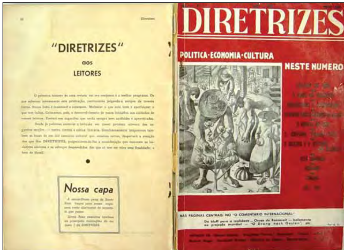
Figura 12: Capa do nº 02 da revista Diretrizes , RJ, maio de 1938. Sob a égide de Azevedo Amaral e Samuel Wainer, a publicação apresentava-se em cor vermelha e a ilustração representa uma plantação de algodão.