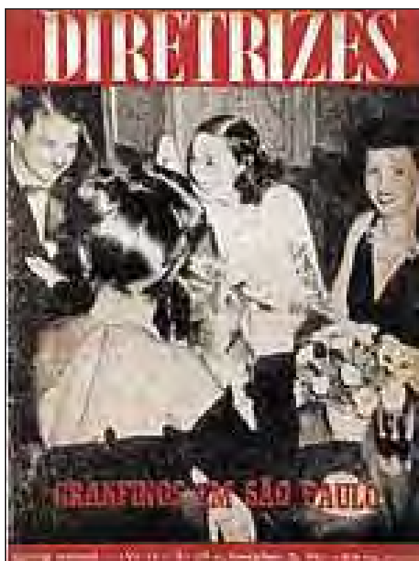
Figura 17: “Grã-finos em São Paulo”, uma das mais famosas reportagens de Joel. Matéria de capa em Diretrizes , RJ, nº 178, 25 nov. 1943.