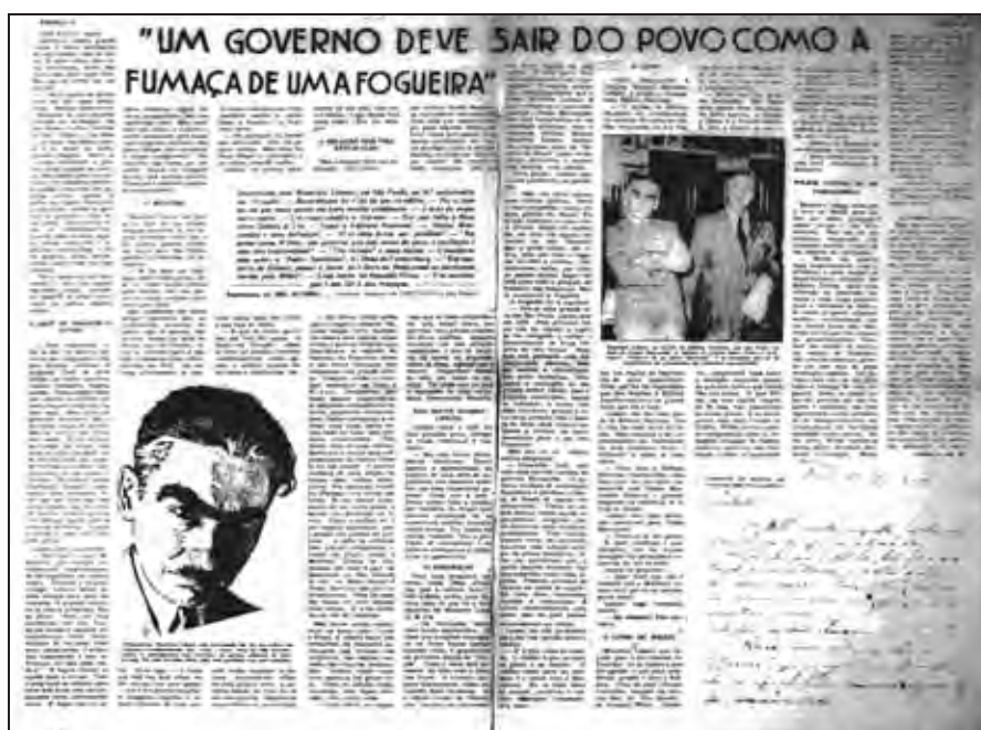
Figura 20: A polêmica reportagem sobre Monteiro Lobato com a manchete “Um governo deve sair do povo como a fumaça de uma fogueira”. Diretrizes , RJ, nº 167, p. 14-15, 09 set. 1943.