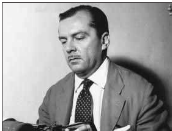
Figura 01: Joel Silveira quando já era um jornalista reconhecido. A foto não possui data e está disponível em http://ultimosegundo.ig.com.br/brasil/2007/08/15/jornalista_joel_silveira_morre_aos_88_anos_no_rio_de_janeiro_964345.html Acesso: 29/09/10.