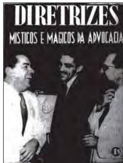
Figura 13: Capa da revista Diretrizes em sua fase semanal. Nº 50, 05 jun. 1941.