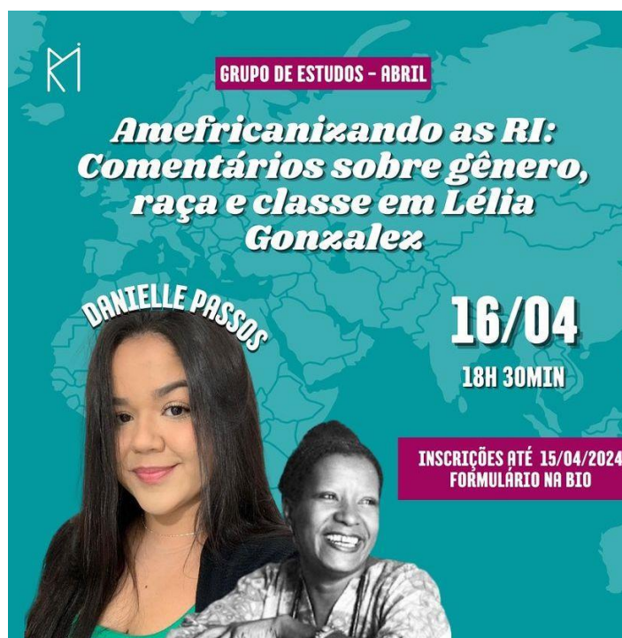
Figura 5: Arte/Pôster de divulgação do grupo de estudos 60 .