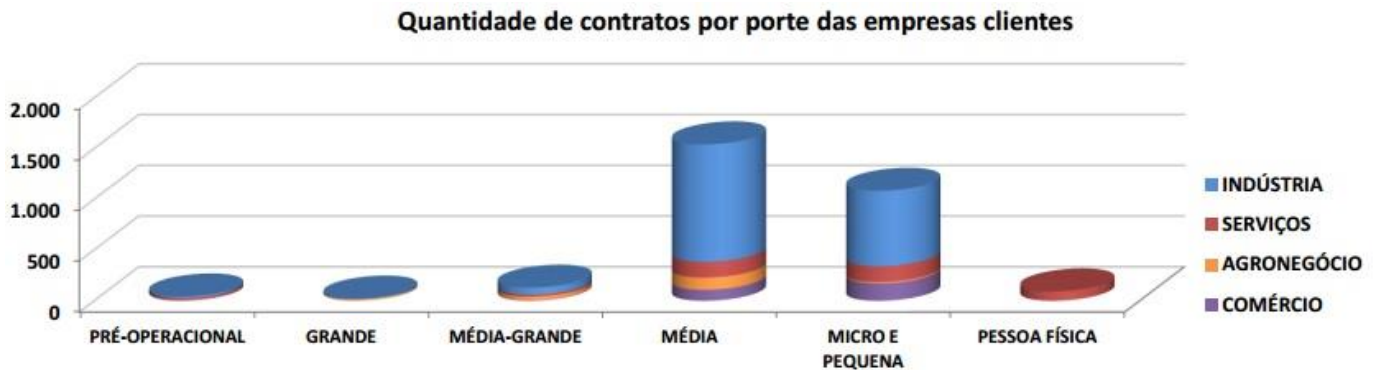
(GRÁFICO 1) - Contratos por porte das empresas clientes em Junho de 2015