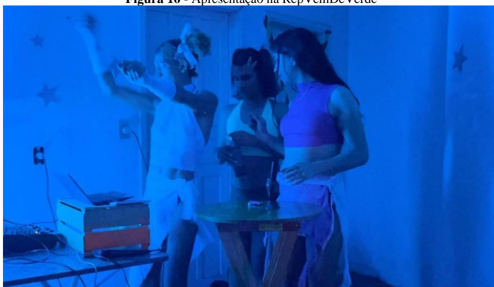
Figura 16 - Apresentação na RepVemDeVerde

Durante o papo, as meninas mencionaram que estavam em processo de lançamento do primeiro single , “Piroca de Noia”, e já ansiosas para a apresentação daquela noite. Apesar do cansaço, pois haviam acordado cedo, o momento da performance estava prestes a acontecer. O público, já um pouco mais disperso com a chegada da madrugada, ainda aguardava pelas Travecas . Quando chegou a hora de se apresentarem, elas abriram o show com o single do grupo. A música, já narrada aqui, era repleta de tensão e humor, refletindo as vivências e as críticas sociais que permeiam suas trajetórias, conforme já narrado. Depois da apresentação, a festa seguiu com Analua no comando, discotecando enquanto as meninas dançavam e se divertiam. O evento foi marcante pra elas, não só pelo lançamento do single , mas também pela energia contagiante e pela visibilidade que as Travecas Travessas trouxeram para a cena cultural de Bauru, consolidando ainda mais o protagonismo do grupo dentro da cultura periférica e trans. Aquela noite marcou nossa aproximação oficial com o grupo, criando um elo mais próximo.