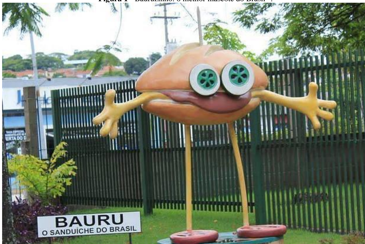
Figura 1 - Bauruzinho: o melhor mascote do Brasil 30 .