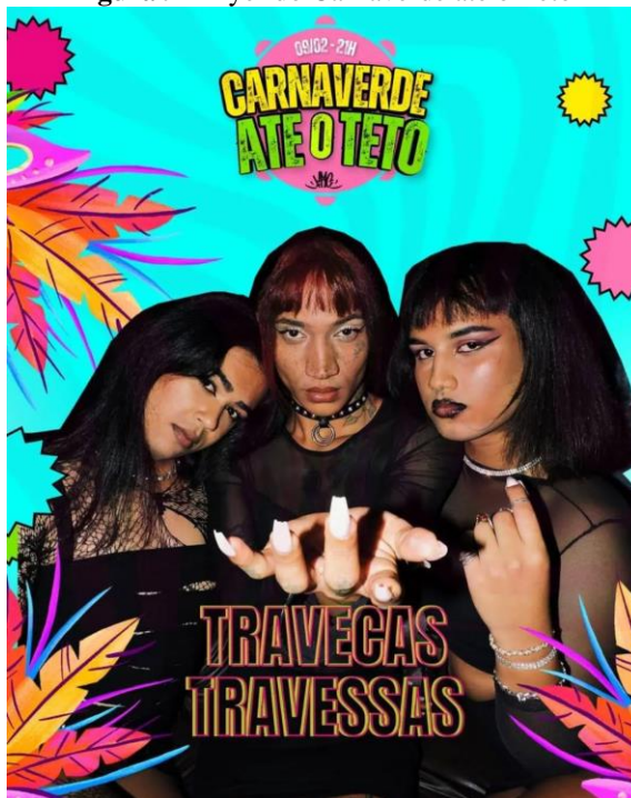
Figura 9 - Flyer do Carnaverde até o Teto