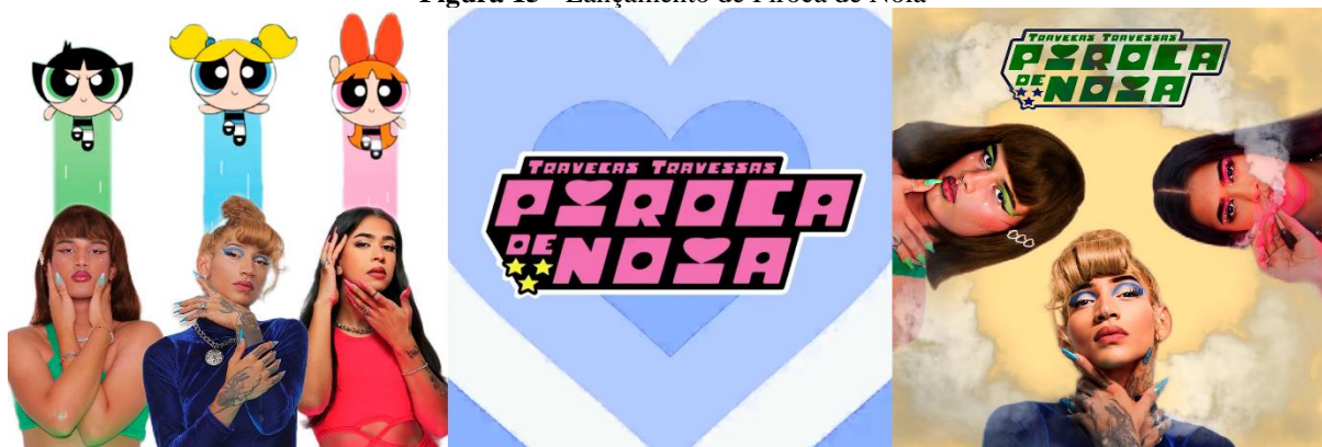
Figura 15 - Lançamento de Piroca de Noia