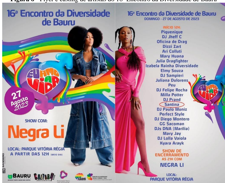
Figura 6 - Flyer e casting de artistas do 16º Encontro da Diversidade de Bauru