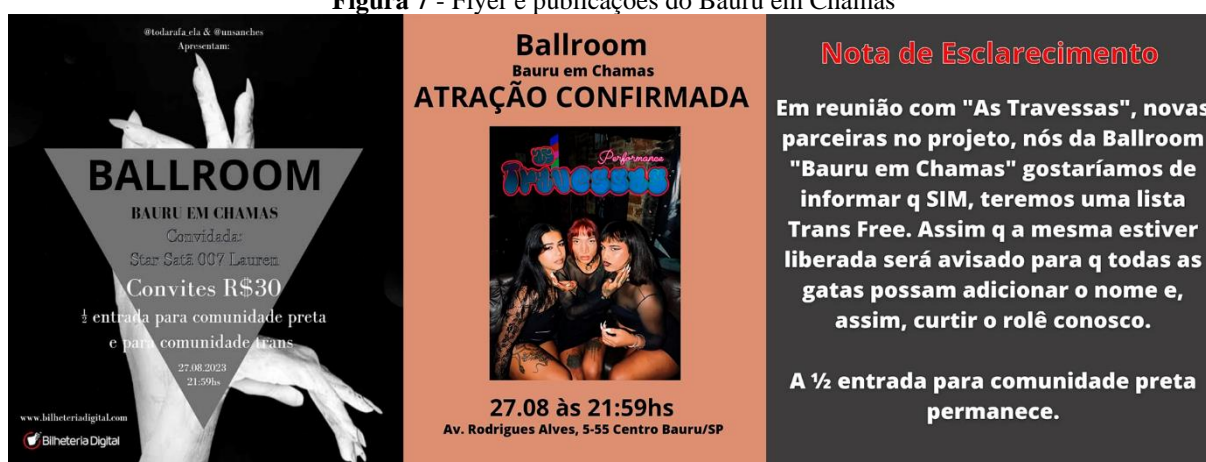
Figura 7 - Flyer e publicações do Bauru em Chamas