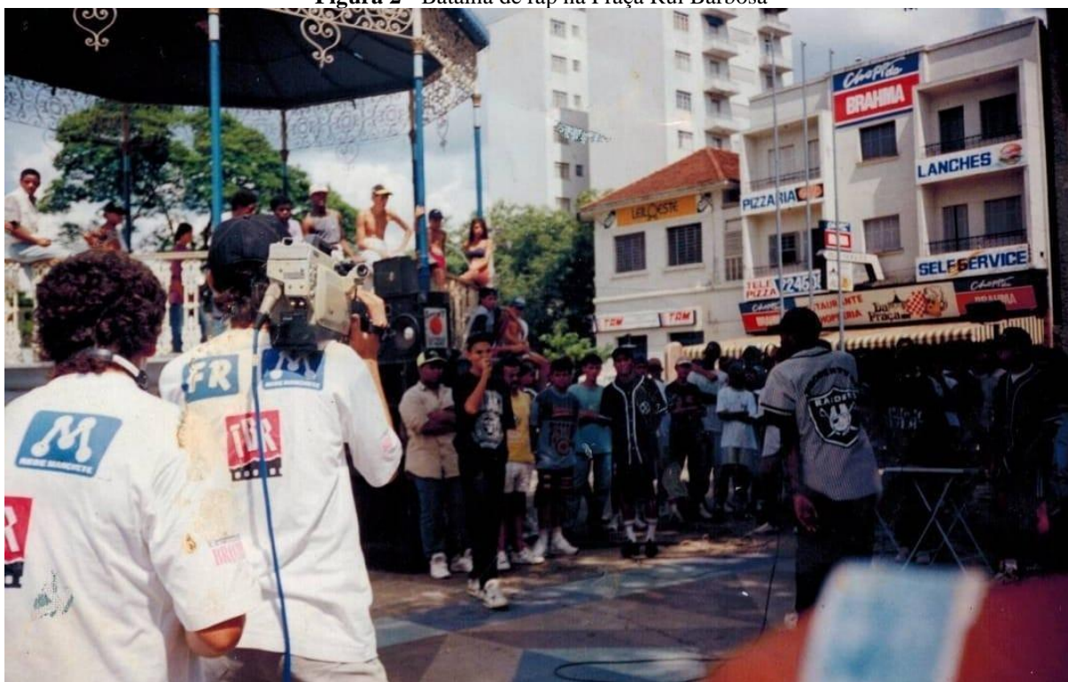
Figura 2 - Batalha de rap na Praça Rui Barbosa