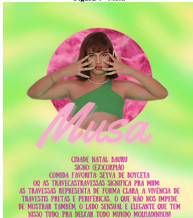
Figura 4 - Musa