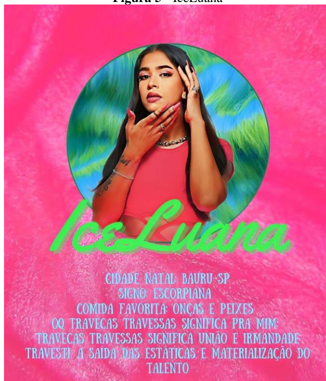
Figura 5 - IceLuana