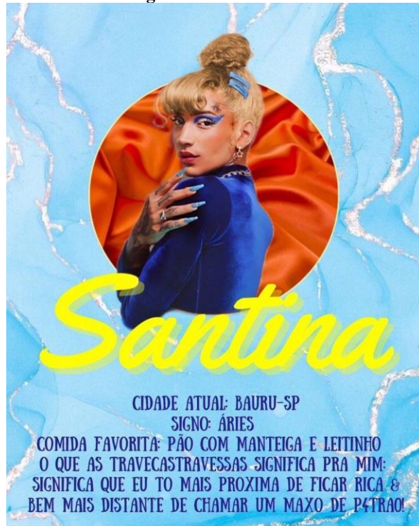
Figura 3 - Analua2000