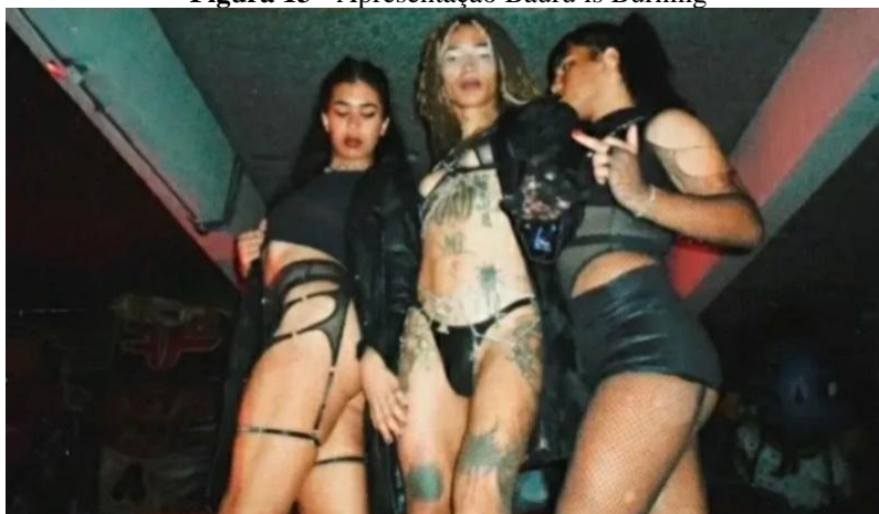
Figura 13 - Apresentação Bauru is Burning