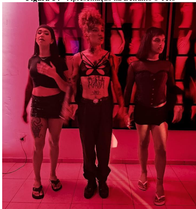
Figura 14 - Apresentação na Beiranto o Teto