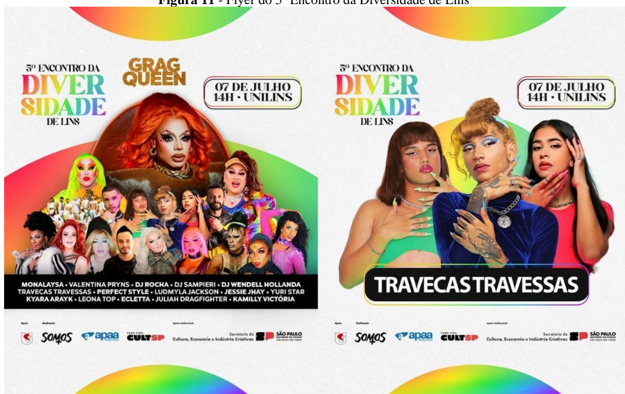
Figura 11 - Flyer do 5º Encontro da Diversidade de Lins