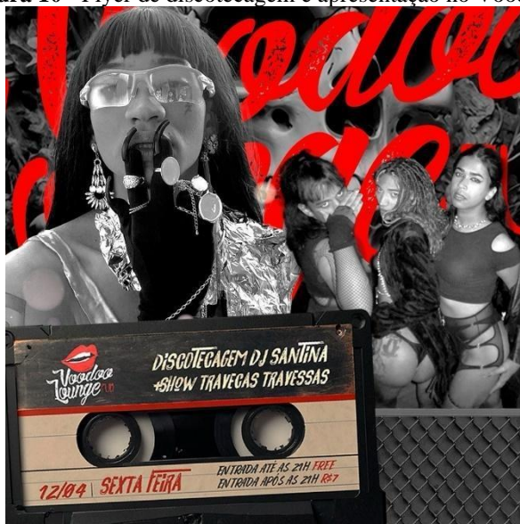
Figura 10 - Flyer de discotecagem e apresentação no Voodoo