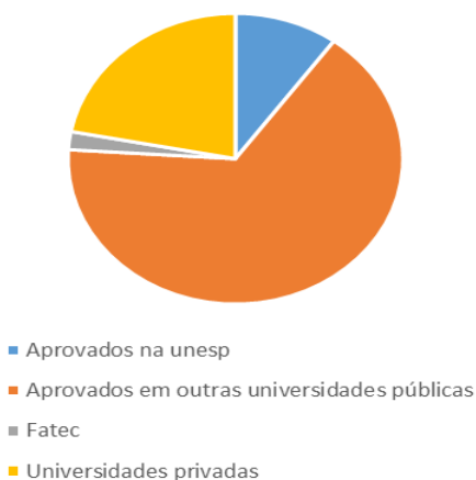
Figura 4. Gráfico de aprovações na UNESP, demais universidades públicas, FATEC e universidades privadas no ano de 2014.

A equipe da coordenação do PreVest – UNESP, gostaria de agradecer a vice-diretoria, a Pró-reitoria de extensão (PROEX) e todos os professores voluntários e colaboradores que juntos nós ajudamos a realizar o sonho de nossos jovens e adolescentes de ter um futuro melhor, através do ensino superior em uma boa universidade.