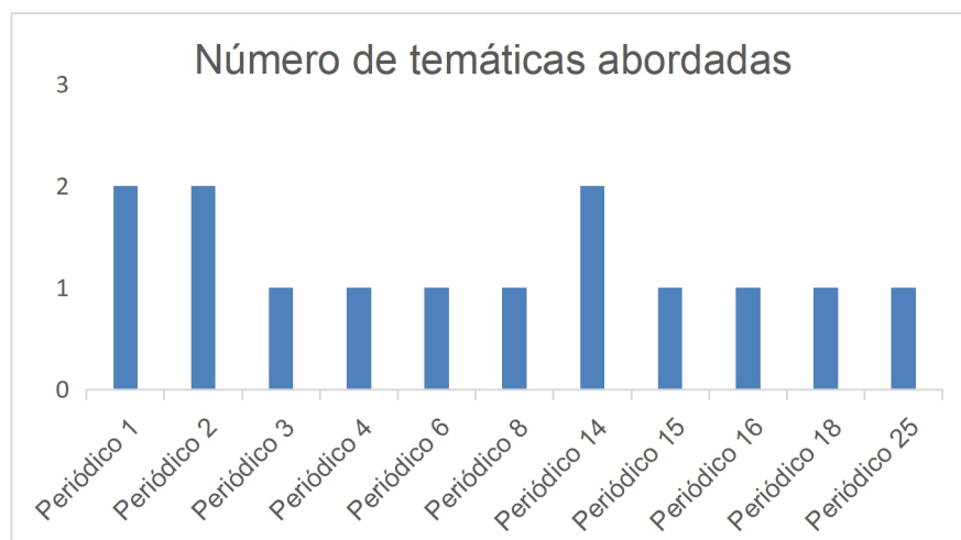
Ilustração 1. Número de temáticas abordadas em cada periódico analisado.

Analisando a Tabela 3 juntamente com o gráfico da Ilustração 1, foi possível perceber que os artigos de número: 1, 2 e 14 estão presentes em mais de uma temática. O artigo de número 1 pertence a temática calculadora em sala de aula e dificuldades para inserção da calculadora. O número 2 se enquadra nos temas calculadora em sala de aula e dificuldades para inserção da calculadora. O periódico 14 aborda sobre materiais curriculares e papel do professor.