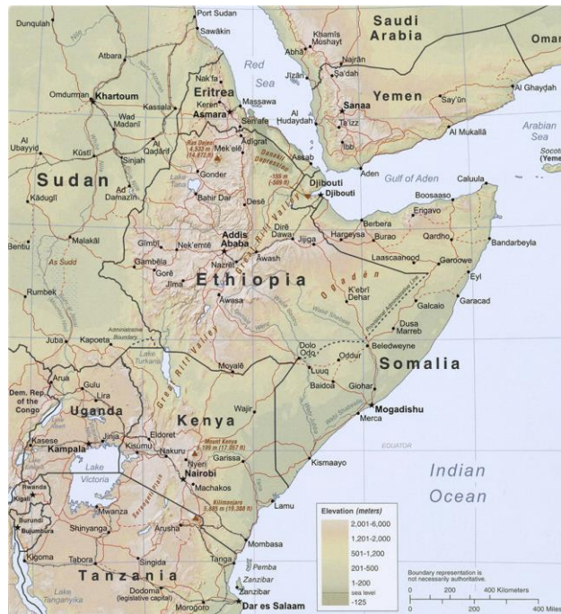
Figura 1 - Mapa da Somália