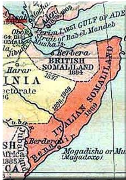
Figura 3 - Somalilândia britânica e Somalilândia italiana

De tal maneira, logo no início do século XX, Itália e Grã-Bretanha invadiram a região da Somalilândia, por meio de um discurso de proteção à mesma. No entanto, essa “proteção compartilhada” é estremecida quando os italianos invadem o território da Somalilândia britânica em 1940, os quais refutam e atacam a Somalilândia italiana um ano depois do ocorrido (MORAIS, 2018).