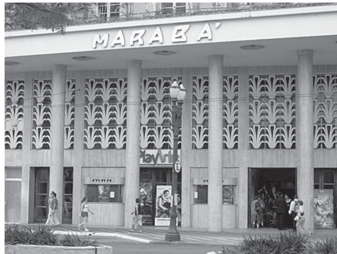
O Cine Marabá é a única sala da antiga Cinelândia que sobreviveu imune à programação pornô.

Cine Majestic, um dos três cinemas da cidade que exibia filmes com a tecnologia do cinerama, agora com cinco salas. Em galerias ou funcionando como anexos, ainda resistem o Cine Livraria Cultura, da própria livraria, o mais recente Reserva Cultural, aberto em 2005, e o Olido, comandado pela Secretaria Municipal de Cultura. Nenhum deles se arrisca na exibição de filmes hollywoodianos.