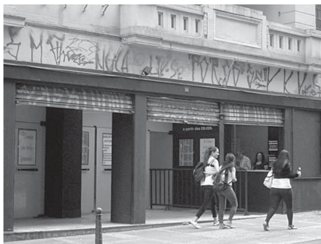
O proprietário do Cine Dom José tenta encontrar formas de se desvencilhar da exibição de filmes pornôs.

o Dom José aqui e o Windsor, que não servem para nada”. A ideia do proprietário é revitalizar ambas as salas e ele busca parcerias com a prefeitura para levantar a imagem dos seus cinemas. Por exemplo, quando há a Virada Cultural, o Dom José e o Windsor cedem suas telas para a programação do evento. É uma forma de eliminar a referência do público com a imagem de cinema pornô dessas salas.