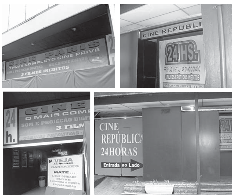
Na mesma calçada da avenida Ipiranga, estão em atividade o Cine Paris e o Cine República. Ambos recorreram à exibição de filmes eróticos para continuarem funcionando.

possível encontrar travestis e garotas de programa na entrada, esperando por clientes. Existem páginas na internet destinadas a marcar “encontros remunerados” nesses cinemas. Em redes sociais, alguns frequentadores assíduos desses cinemas fornecem dicas do que é possível encontrar em cada um deles.