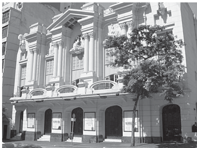
O antigo Cine Paramount, atual Teatro Abril na avenida Brigadeiro Luiz Antônio, é um exemplo de cinema antigo que sobreviveu à ação do tempo e da transformação urbana.

O centro de São Paulo era tudo o que havia de melhor no universo, a partir dos anos 40. A Cinelândia, área da região central que oferecia um conjunto incontável dos melhores e mais badalados cinemas, abrigava também restaurantes, bares, museus, teatros. Nas suas avenidas mais populares, a Ipiranga e a São João, vários cinemas se enfileiravam na mesma quadra, até mesmo um ao lado do outro, especificando ao máximo as atrações disponíveis para conquistar os gostos dos espectadores. Havia cinemas para todas as preferências. Sessões à tarde, à noite, de madrugada, filmes de ação, filmes de banguê-banguê, românticos, americanos, cults, seriados, novelas. A programação atendia a todos, sem distinção de gênero, raça ou classe social. Tudo era novidade. A cada dia, abriam mais e mais salas e o público parecia infinito. Gente era o que não faltava na Cinelândia. “Ali, naquele predinho amarelo, tá vendo? Do lado, era a PAM Filmes [Produções Amácio Mazzaropi]. Lá eu montei o Jeca Macumbeiro . Todo dia 25 de