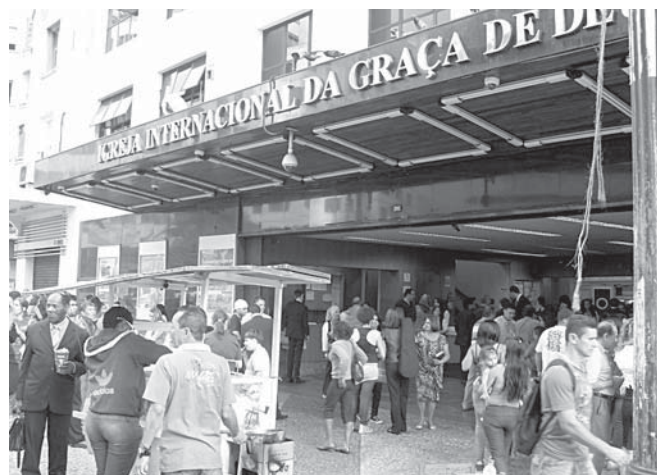
O Cine Metro, famoso por exibir grandes musicais, tornou-se uma igreja evangélica.

Com o declínio cada vez mais contundente das salas de cinema de rua de São Paulo, esses pontos de comércio, e também de sociabilidade, ficaram ameaçados. Muitos deles não existem há muito tempo ou tiveram que alterar seus horários de funcionamento, pois não há mais ninguém saindo das sessões da meia-noite. Um passeio pelo centro da cidade depois das dez da noite comprova esse fato facilmente: são poucos os proprietários de bares e restaurantes que arriscam abrir as portas de seus estabelecimentos depois desse horário. Isso também acontece em outros pontos da cidade, como no caso da avenida Consolação, que abrigava o recém-extinto Cine Belas Artes. Com o fechamento do cinema em março de 2011, houve uma alteração significativa no funcionamento dos estabelecimentos vizinhos. Grande parte dos frequentadores noturnos do Belas Artes costumavam ir até a pizzaria Micheluccio, em frente ao cinema, depois da sessão. Agora, com a queda do faturamento por conta da baixa no público, o dono da pizzaria se viu obrigado a vender pasteis durante o dia para recuperar o prejuízo. Outros bares conhecidos da área fecharam suas portas logo depois do encerramento das atividades do Belas Artes, como o Bar do Guedes. Estacionamentos que funcionavam