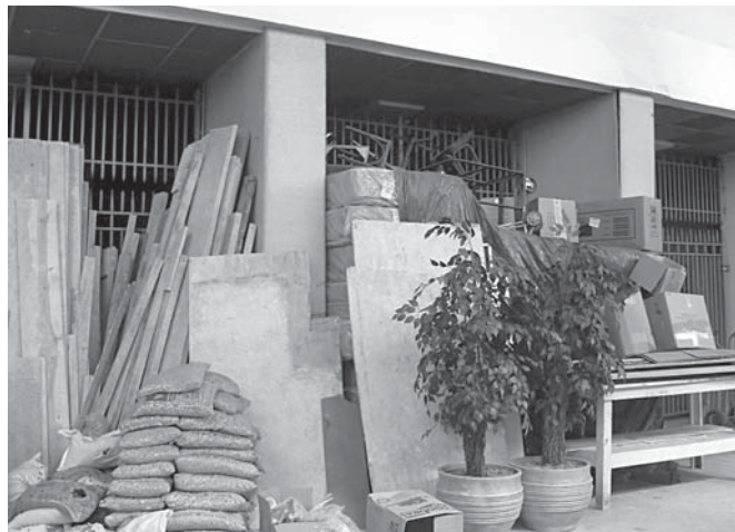
Em frente ao Cine Ipiranga, vendedores ambulantes montam suas barracas nos fins de semana. Do lado de dentro do cinema, entulhos e cadeiras velhas escondem o antigo salão de entrada.

O antropólogo e professor da Universidade Estadual Paulista (Unesp), câmpus de Bauru, explica quais foram os fatores que resultaram no fechamento dos cinemas de rua em São Paulo: “eles desapare-