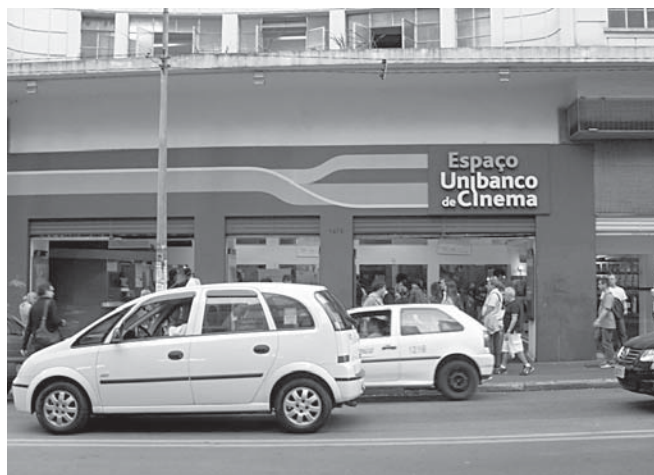
Na agitada rua Augusta, o Espaço Unibanco, antigo Cine Majestic, funciona com cinco salas e uma programação que varia entre filmes “comerciais” e “de arte”.

Vale ressaltar que os “filmes de qualidade” citados, nesse caso, não são uma questão de preferência pessoal. Há uma série de parâmetros que atestam o valor estético de uma produção cinematográfica, não importa de qual país ela venha. Detalhes como roteiro, montagem, direção, fotografia, trilha sonora, entre outros, compõem uma unidade, o filme. E essa unidade deve estar em harmonia.