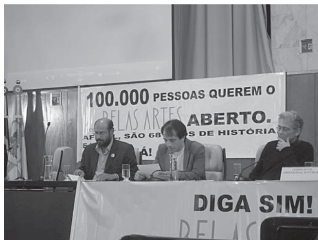
Integrantes da audiência pública que debateu o tombamento do Belas Artes.