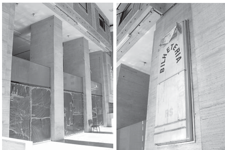
Situação atual da fachada e do saguão do cinema homônimo ao seu endereço, no Largo do Paissandú.

Não havia nada mais seguro do que as ruas do centro de São Paulo, tanto durante o dia quanto à noite. As pessoas caminhavam livremente em busca de diversão, sem se preocuparem em esconder a bolsa ou verificar se alguém as estava seguindo. E os bairros da cidade costumavam seguir a mesma regra: muitas atrações cinematográficas para todos os gostos e uma vida noturna bastante agitada. Ao contrário do que se encontra na região central atualmente, o local era reduto também da alta sociedade, e frequentar alguns dos cinemas da Cinelândia era motivo para ostentação. “O cinema era uma apoteose! Quando as madames do Jardim Europa queriam ir ao cinema, vinham para o centro. Quando inaugurava um cinema, era uma festa. Vinha prefeito, vinha governador, banda da Guarda Civil, bandeira de todos os países. Eu comecei trabalhando no Cine República, na praça da República, embaixo era o cinema e em cima era o departamento de publicidade, onde se faziam cartazes, painéis. O República tinha a