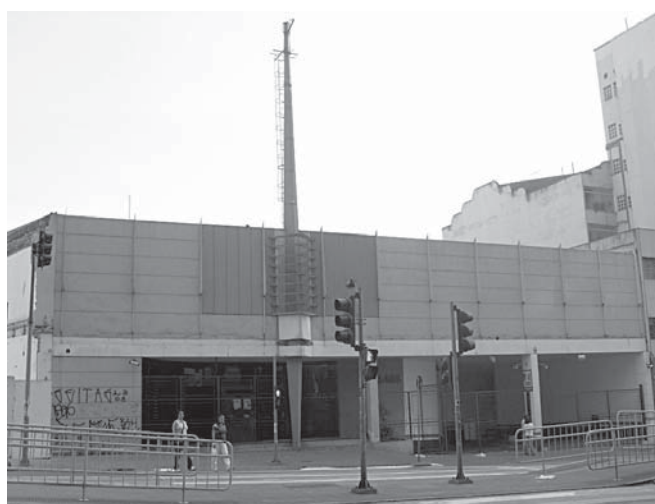
Inovador ao extremo para a época, o Cinespacial oferecia uma sala circular com três telas e três projetores.