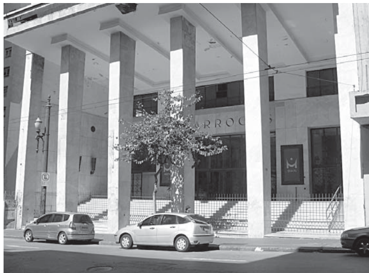
Considerado um dos mais luxuosos de sua época, o Cine Marrocos aguarda hoje pela intervenção da prefeitura, que deseja transformá-lo em um teatro.