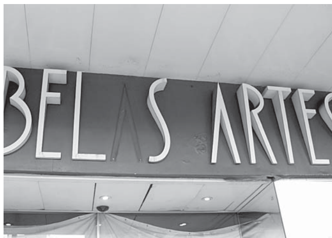
Em oito meses, a fachada do Cine Belas Artes já está completamente degradada. Atualmente, o cinema virou abrigo para mendigos.

poder público simplesmente se omite e o órgão municipal responsável pela aprovação do tombamento, o Conselho Municipal de Preservação do Patrimônio Histórico, Cultural e Ambiental da Cidade de São Paulo (Conpresp), não reconhece a relevância cultural do cinema e alega a inconstitucionalidade do tombamento, por estar interferindo no direito de propriedade privada do proprietário do prédio. Porém, a função do tombamento é determinar que naquele local apenas poderia funcionar um cinema. O proprietário continuaria recebendo o aluguel como sempre. Mas como a legislação permite uma série de brechas, uma questão simples se torna um emaranhado de argumentos e discussões sem fim. O Conpresp reconhece apenas o tombamento do cinema por motivos arquitetônicos, o que jamais aconteceria, pois o prédio já sofreu diversas modificações desde que foi construído, em 1946, quando o letreiro ainda indicava no local o Cine Trianon. Portanto, os motivos históricos da edificação já não existem mais. Além disso, o tombamento arquitetônico não prevê que naquele local continue existindo um cinema, apenas que o prédio não seja modificado, seja qual for a atividade que se exerça ali.