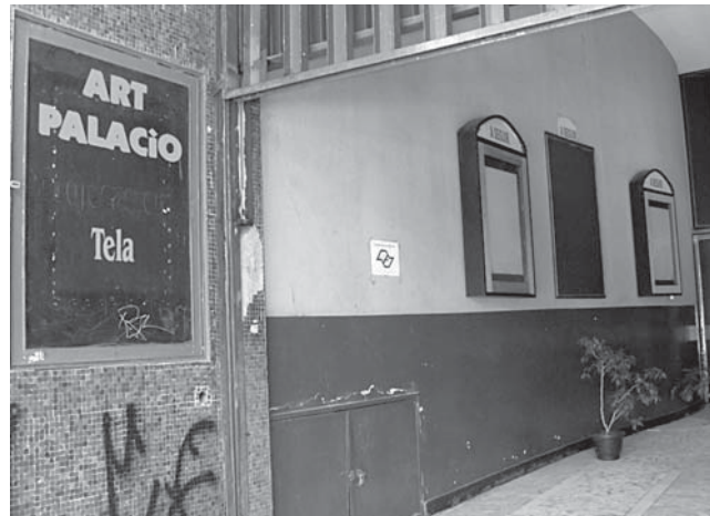
Entrada do Art-Palácio, que por muito tempo abrigou o maior público da Cinelândia paulistana.