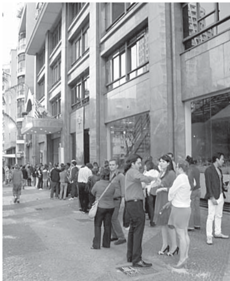
Fila em frente à Galeria Olido para uma mostra de cinema barroco.

Isso não significa que a solução para os cinemas históricos abandonados em São Paulo seja uma intervenção da prefeitura, porém, mostra que é possível cuidar desse pedaço do patrimônio cultural da cidade com iniciativas relativamente simples, ao alcance do poder público.