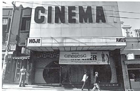
Antigo Cinema 1, que deu origem ao CineSesc, na rua Augusta.