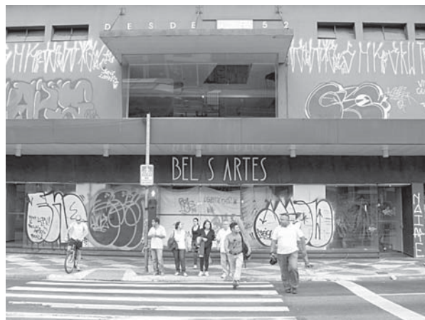
Há oito meses fechado, o Cine Belas Artes está com a fachada completamente degradada e virou abrigo para mendigos.

um vilão no estado de São Paulo e ter que mudar o número de telefone porque as pessoas ligavam na casa dele pra xingar. Ele não podia sair de casa que as pessoas o ofendiam. Tudo para ganhar um pouquinho mais. Tudo bem, o cara precisa ganhar dinheiro. Mas a gente ofereceu para ele 1 milhão de reais por ano. Depois de 5 anos, ele teria ganho 5 milhões e continuaria dono do imóvel. O outro ofereceu 1,02 milhão. Chega uma hora que a pessoa tem que ter o mínimo de civilidade, de decência, de pensar o mínimo na sua cidade. O que aconteceu: com a mobilização que teve, o Conpresp abriu o processo de tombamento e quando o processo é aberto o imóvel fica congelado, não pode haver outro uso. Nós saímos de lá em março, o cinema está fechado há 5 meses. O proprietário está pagando o IPTU do bolso dele e deixou de receber o nosso aluguel, ou seja, ele está perdendo 100 mil reais por mês. Ele já perdeu 500 mil reais por causa de 20 mil reais de aluguel. 20 mil reais em 1 ano equivale a 240 mil, ou seja, ele vai demorar 2 anos pra recuperar o que ele perdeu nesse período. Fora os outros prejuízos e fora que esse tombamento pode demorar mais tempo para ser resolvido. É uma coisa tão burra”, continua Sturm.