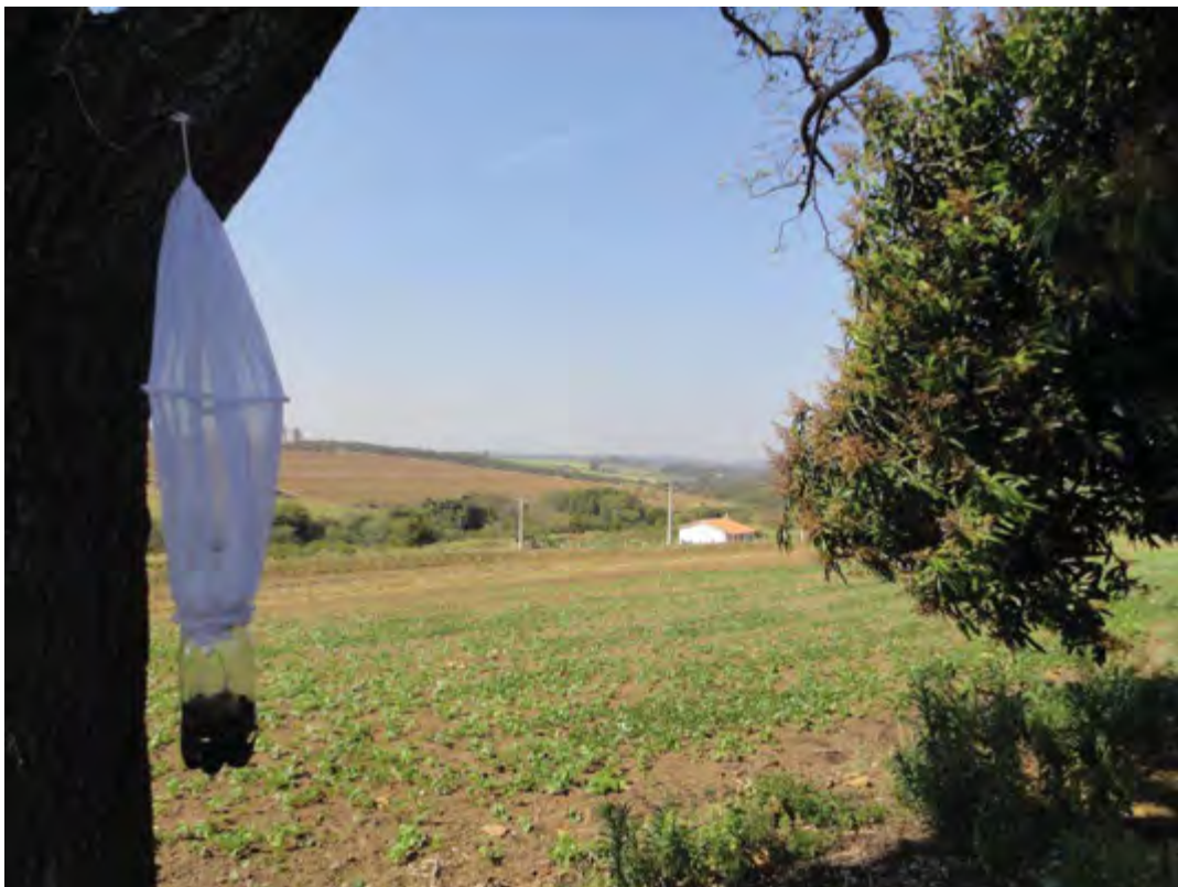
Figura 4 – Armadilha exposta na área rural, na região de Rio Claro –SP.