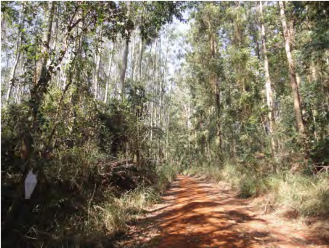
Figura 5 – Armadilha exposta na área de floresta, na região de Rio Claro –SP.