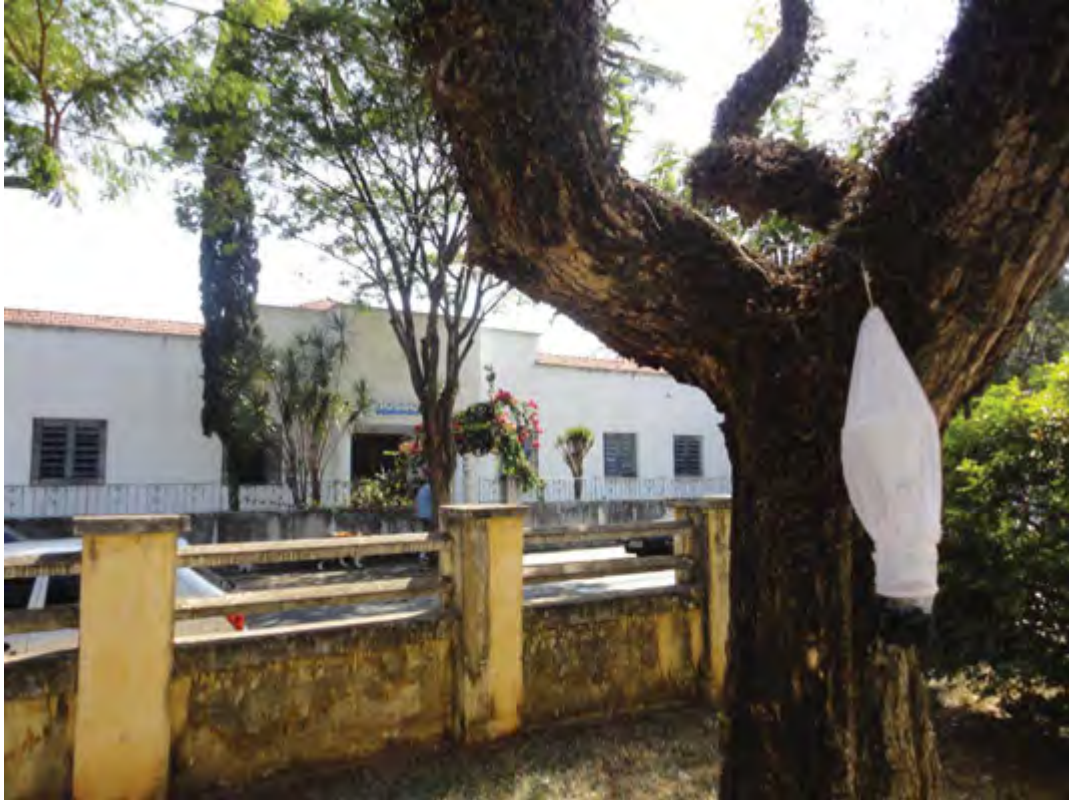
Figura 3 - Armadilha exposta na área urbana, na região de Rio Claro-SP.