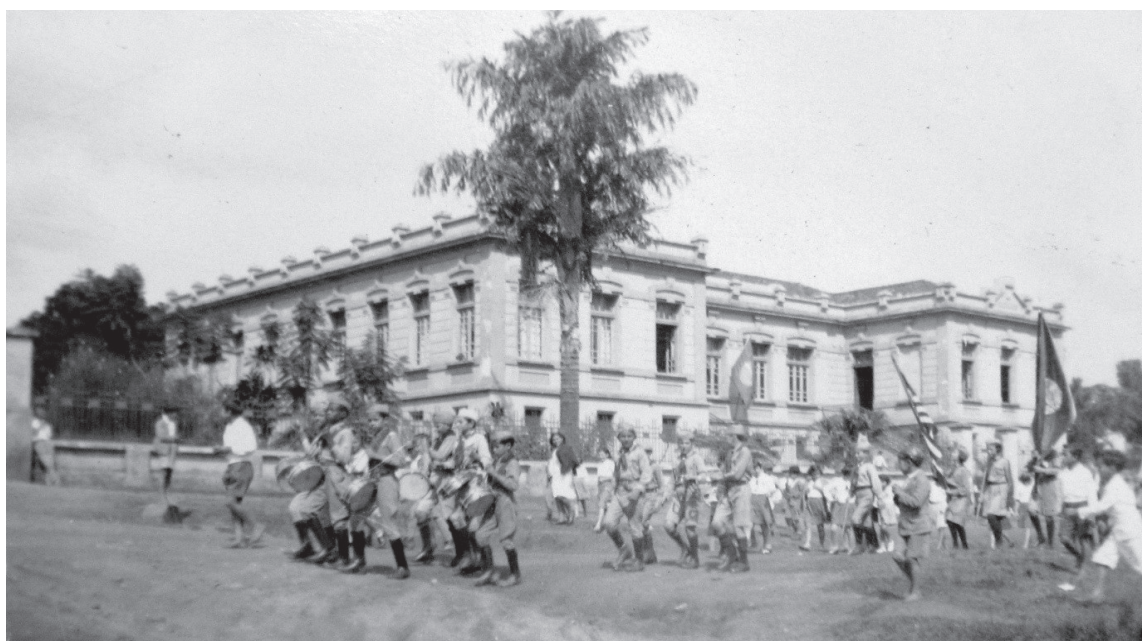
Grupo Escolar de Faxina – 1936

Ou também nas fotos das festas cívicas, com uma juventude militarizada nas manifestações das associações de escoteiros: