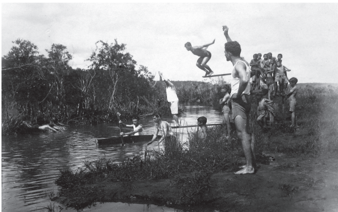
Clube Esportivo Infantil – Piratininga

Nem sempre é assim. Fotógrafos, mesmo em missão oficial de documentação para órgãos estatais, também são seres humanos. Comportam, portanto, as nuances que caracterizam a condição humana. Às vezes, quem sabe involuntariamente, também registram o espontâneo, como nas duas fotografias abaixo de atividades escolares envolvendo professores e alunos fora dos muros da escola em 1933: