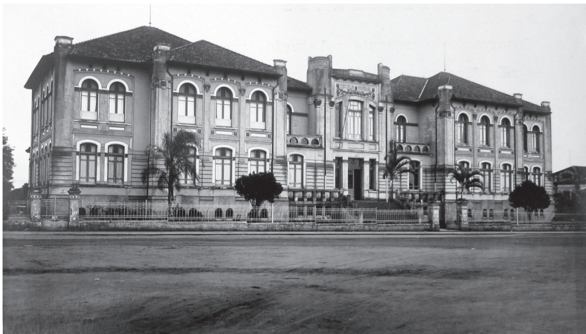
Escola Normal Oficial de Botucatu – Arquivo Público do Estado de São Paulo

As fotografias dos relatórios aqui tratados hierarquizam estabelecimentos educacionais. Com o auxílio de suas legendas, pode-se diferenciar se são escolas estatais ou privadas, ressaltando-se a imponência dos edifícios e, portanto, a primazia das primeiras. É o caso comparativo de duas escolas normais em 1933 na região de Botucatu: