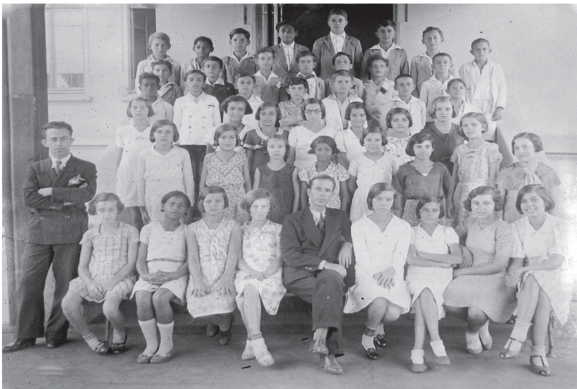
Grupo Escolar de Pederneiras – 1933

O papel da escola na construção do espaço público correto pode ser visto também na forma hierarquizada das diversas fotos das turmas de alunos, com a presença do diretor da escola e do professor da classe: