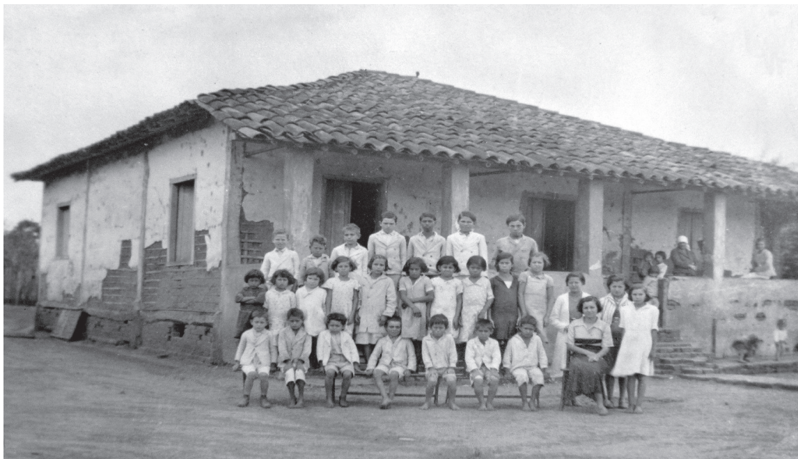
Escola do Moquéim – Itapetininga

O risco de atribuir ao passado uma beleza que decorre do meio fotográfico como fonte documental é concreto. Nas duas fotos abaixo, de escolas rurais de 1936, a miséria das instalações escolares pode ser suplantada pela beleza estética causada pelo registro fotográfico. Este risco deve ser combatido pelo distanciamento crítico desejável à atividade do historiador da educação e pelo uso complementar de fontes escritas constantes nos próprios relatórios, que constantemente condenam a pobreza do sistema escolar rural: