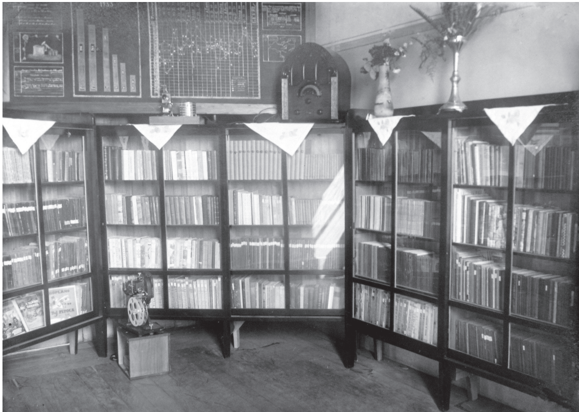
Grupo Escolar “Cardoso de Almeida” – Botucatu

As próximas fotos ilustram esta proposta de complementaridade documental: