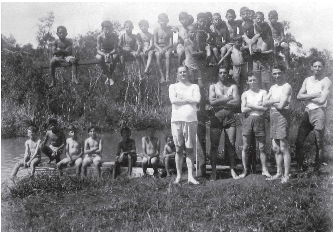
Clube Esportivo Infantil – Piratininga

Por maiores que sejam as críticas à sociedade contemporânea, freqüentemente bombardeada por imagens que embotam e deturpam a percepção da realidade, não se pode ignorar que fotografias preservam documentalmente cenas do passado. Usar criteriosamente e de maneira não isolada esta fonte nas pesquisas em História da Educação possibilita rico material de análise de contextos educacionais do passado. Não se pode descartar o uso da fotografia como fonte documental devido às suas características intrínsecas de embelezamento do passado. Nem de sua constituição consciente pelo fotógrafo, que previamente selecionou e organizou o que deveria ser registrado na foto. Isto ocorre, às vezes de maneira mais sutil, com quaisquer tipos de documentos usados pelos historiadores, quer sejam fontes orais, iconográficas ou escritas. Se as fontes documentais comportam grande carga de subjetividade de quem as registrou, cabe ao historiador buscar alguma objetividade no trato destas fontes. Não deveria ser diferente com o uso da fotografia como instrumento de compreensão do passado em História da Educação. Os arquivos estão repletos deste material. Cabe aos historiadores não o temerem, nem simplesmente se renderem ao canto das sereias da sedução documental. Este risco existe, mas é necessário identificá-lo e equacioná-lo. Isto sempre foi incumbência nata do ofício do historiador.