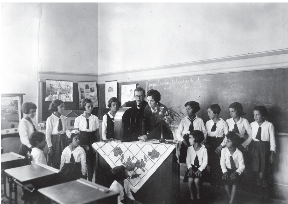
Grupo Escolar "Cardoso de Almeida" – Botucatu