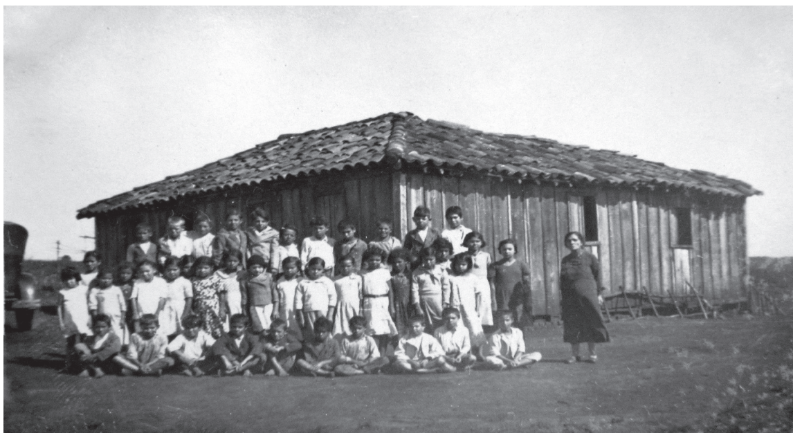
Escola do bairro das Pedras – Faxina