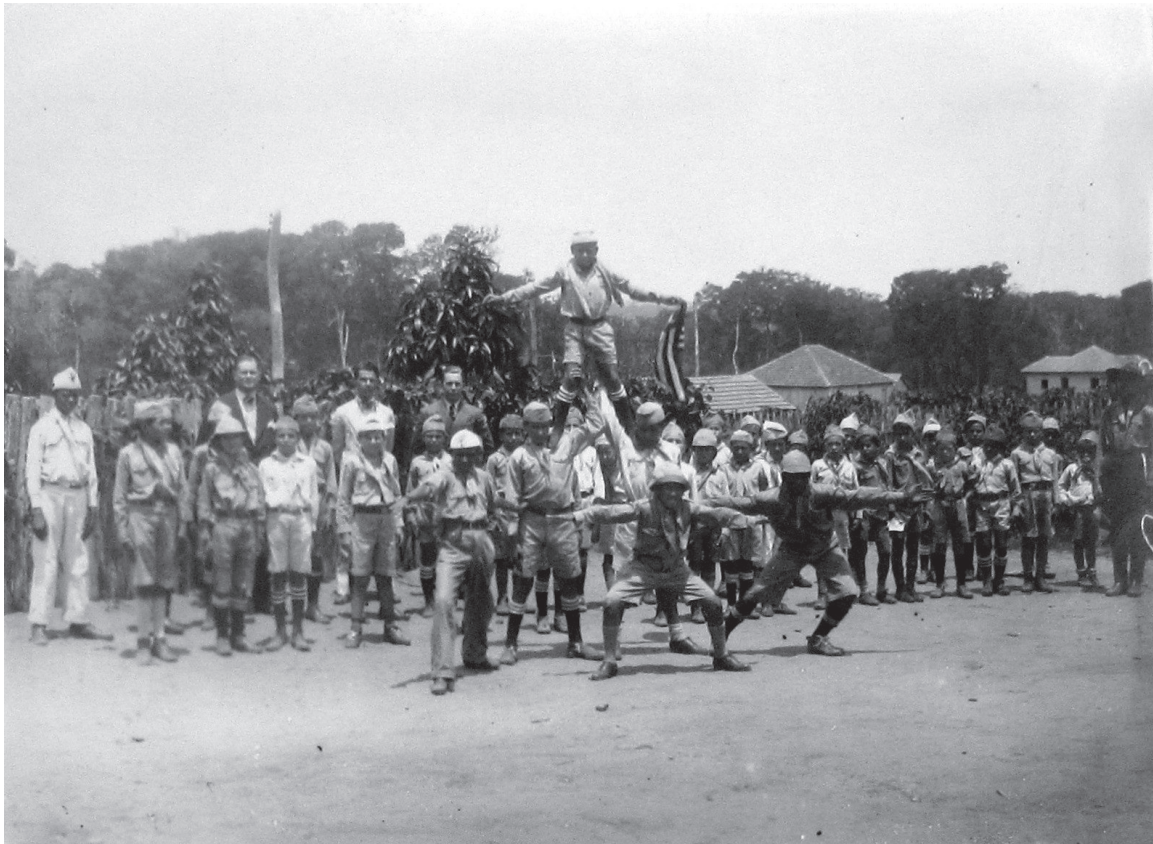
Escoteiros de Garça – 1933

Susan Sontag destaca incisivamente o efeito que o uso da fotografia causa como instrumento da percepção da realidade: o embelezamento inevitável do fato fotográfico. Tal efeito inevitável enfraquece a fotografia como fonte documental para a compreensão do passado: