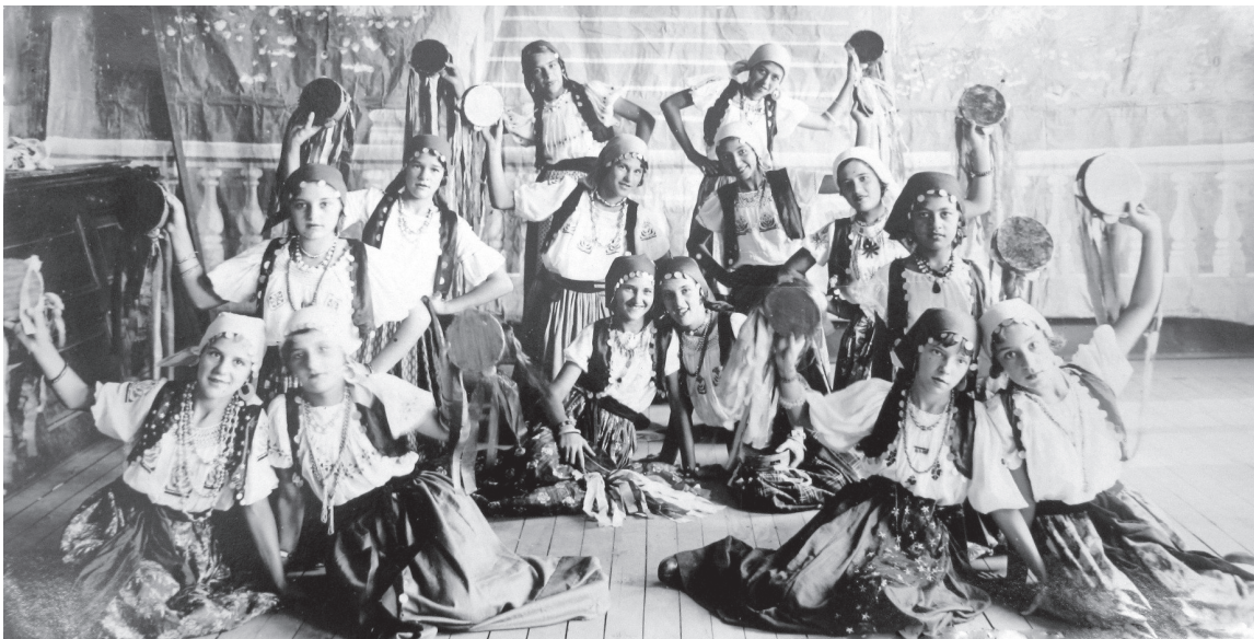
Grupo Escolar de Agudos