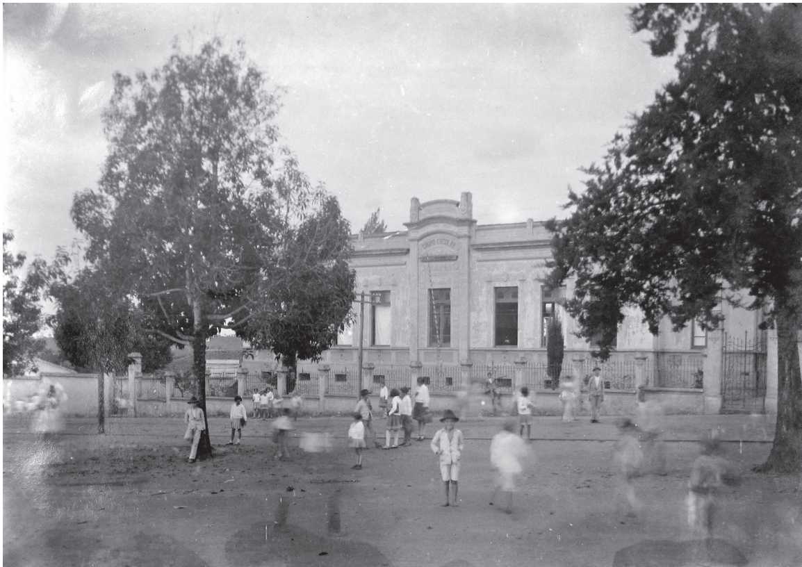
Grupo Escolar de Itatinga – Arquivo Público do Estado de São Paulo

Em seu livro sobre fotografia e história, Boris Kossoy (2001, p. 38) recomenda ao historiador que preste atenção a três dos elementos constitutivos de uma fotografia: ao assunto, ao fotógrafo e à tecnologia nela empregada. Sobre este último aspecto, na década de 1930, ao menos com os fotógrafos empregados para o registro documental das escolas paulistas de então, não existia o uso de tecnologia fotográfica que possibilitasse o registro de imagens em rápido movimento. Assim, com poucas exceções, nestes relatórios são raras as fotos espontâneas; isto é, fotos não posadas: