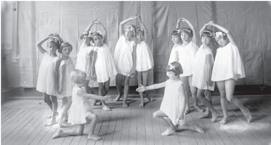
1º Grupo Escolar de Bauru

Para uma reflexão sobre as idéias de Brassã e de Kossoy acima citados, são exemplares as fotos de festas escolares em Bauru e Agudos em 1933: