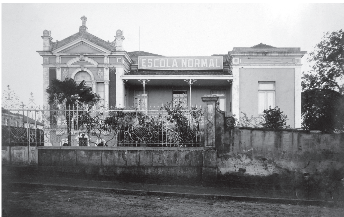
Escola Normal Livre de São Manuel