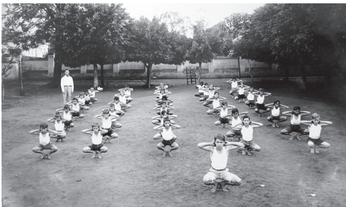
1º Grupo Escolar de Bauru