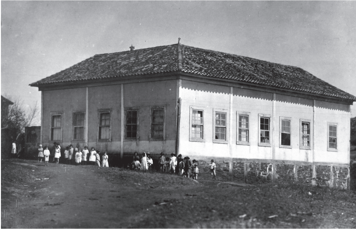
Escolas Reunidas de Santa Bárbara do Rio Claro

Nas fotos acima, o fotógrafo captou as espontaneidade das crianças e dos adultos defronte a duas escolas da região de Botucatu em 1933. Porém, é provável que tais fotografias não tenham sido concebidas de maneira proposital para registrar, no primeiro caso, o movimento das crianças, ou, no segundo caso, a informalidade de prováveis professores e alunos em frente ao edifício escolar. Em ambos os casos, extremamente raros neste conjunto fotográfico, o imprevisto não controlado dos seres humanos fotografados permaneceu nos relatórios provavelmente por registrarem a imponência contrastante entre os edifícios escolares e seus usuários. A norma são fotos concebidas previamente em seus diversos detalhes. Tais fotografias são documentos oficiais e assim são planejadas pelos fotógrafos das décadas de 1930 e 1940.