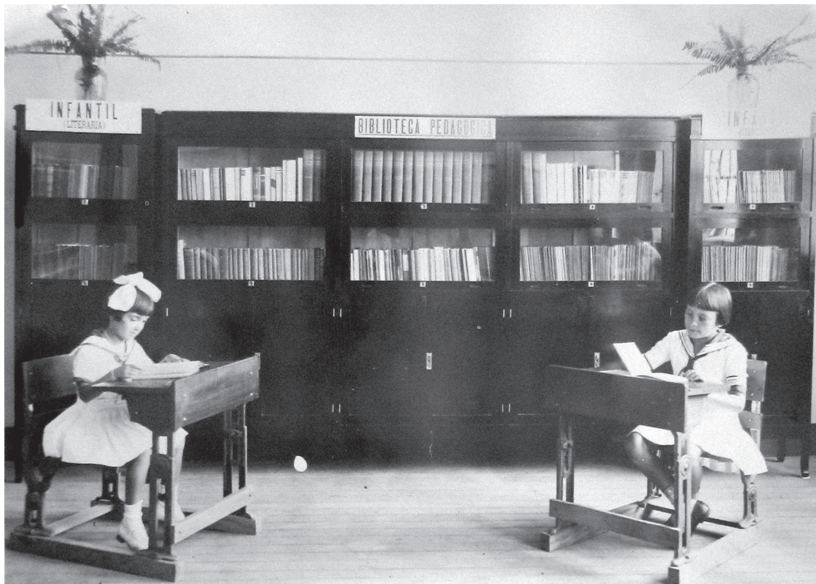
Biblioteca do 3º Grupo Escolar de Bauru