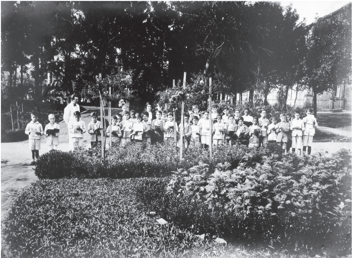
Grupo Escolar “Cardoso de Almeida” – Botucatu