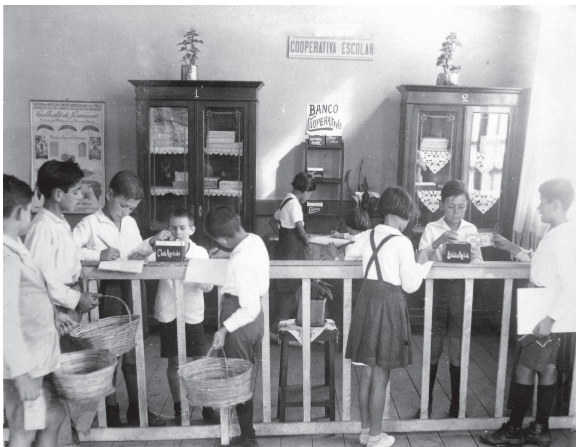
Grupo Escolar de Itararé – 1936

Da mesma maneira, pode-se entender melhor a listagem do patrimônio das cooperativas escolares e suas atribuições nos grupos escolares: