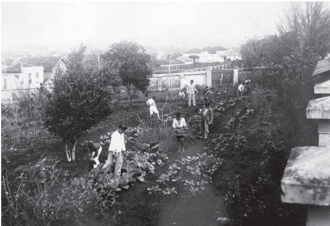
Grupo Escolar de Itararé