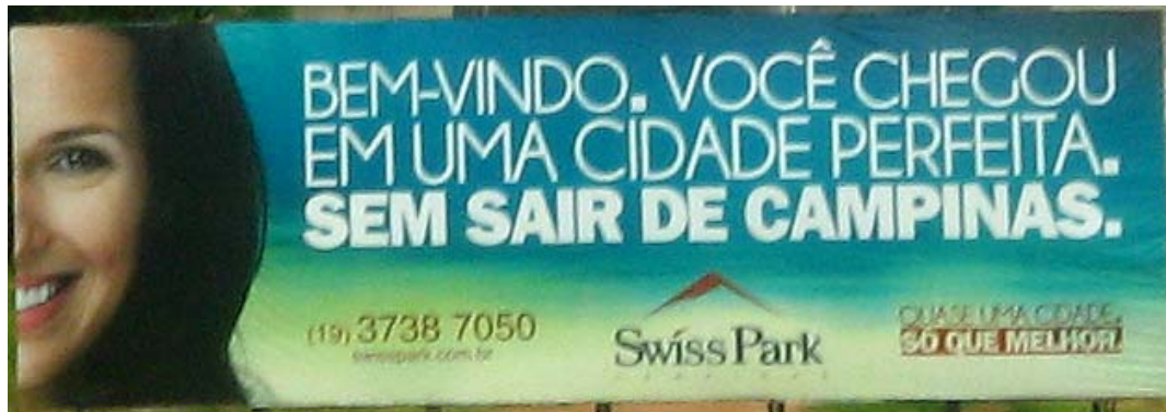
Fig. 4: Anúncio de condomínio fechado ao lado da Rodovia Anhanguera em Campinas, SP: o conceito de perfeição vende uma promessa de paraíso dentro do caos urbano.

Valoriza-se, desta forma, a proximidade à “natureza” ou reservas ecológicas, o fácil acesso a equipamentos urbanos como rodovias e centros comerciais, a fluidez do trânsito de automóveis particulares em detrimento da proximidade dos centros geradores de emprego e da justaposição de indivíduos de diferentes estratos sociais. Com a ajuda da especulação imobiliária, proliferam os condomínios fechados e os bairros planejados de caráter particular, caracterizados pela baixa densidade demográfica, casas de “alto padrão” unifamiliares, pouca ou nenhuma interação entre a própria comunidade, etc. Por outro lado, para essa sociedade pós-moderna cada vez mais o centro da cidade ou suas áreas mais densas se parecem decadentes, sujas, perigosas, caóticas, superpovoadas, em suma, um ambiente doentio que apresenta poucas condições de regeneração. A violência e o individualismo, como já abordados no tópico anterior, acabam por fornecer um prato cheio à publicidade, que se vale de táticas de convencimento para alardear os novos modos de se viver no meio urbano, epitomizados pelo conceito de “qualidade de vida” (Ver Figura 5).