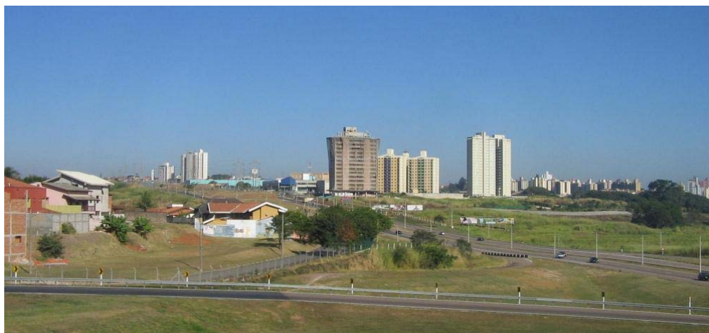
Fig. 3: Edifícios residenciais e comerciais de alto padrão se justapõem a uma paisagem predominantemente rural, nas proximidades de um entroncamento rodoviário na periferia de Campinas-SP. Notar o condomínio fechado à esquerda.

O aumento da facilidade em se mover pela cidade pós-industrial que passa a se configurar é testemunha também da fragmentação de sua estrutura social, o que ecoa na organização urbana. Nesta cidade fragmentada, surgem os enclaves , pontos do tecido urbano cuja função é desconexa da função de áreas vizinhas – como por exemplo um condomínio de apartamentos ou escritórios em meio a uma área rural. (ver Figura 3). “Destas características resulta a ruptura centro e periferia, este primeiro passa a assumir funções típicas do novo sistema ‘globalizado’, enquanto esta última é desafiada pela multiplicação de centralidades.” (SALGUEIRO, 1998).