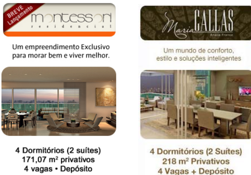
Fig. 5: Publicidade extraída do site de uma construtora. Projetos residenciais na cidade de São Paulo-SP. Retirado de: < http://www.porte.com.br/default.asp > Acesso em: 23/10/2011