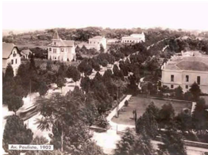
Fig. 1: Foto da pacata Avenida Paulista em São Paulo-SP, em 1902.

tecnologias de transportes e comunicações, aliado à crescente internacionalização do capital e da produção, vão refletir fortemente nos modos de apropriação do território, na estrutura das cidades e nas suas relações mútuas (ver Figuras 1 e 2).