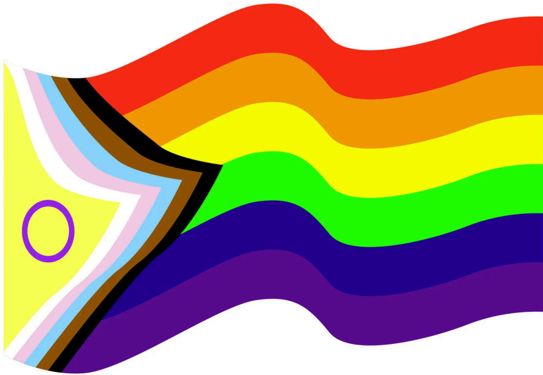
Figura 2 - Símbolo do movimento LGBTQIAP+ 22

Lina Pereira dos Santos (Linn da Quebrada).