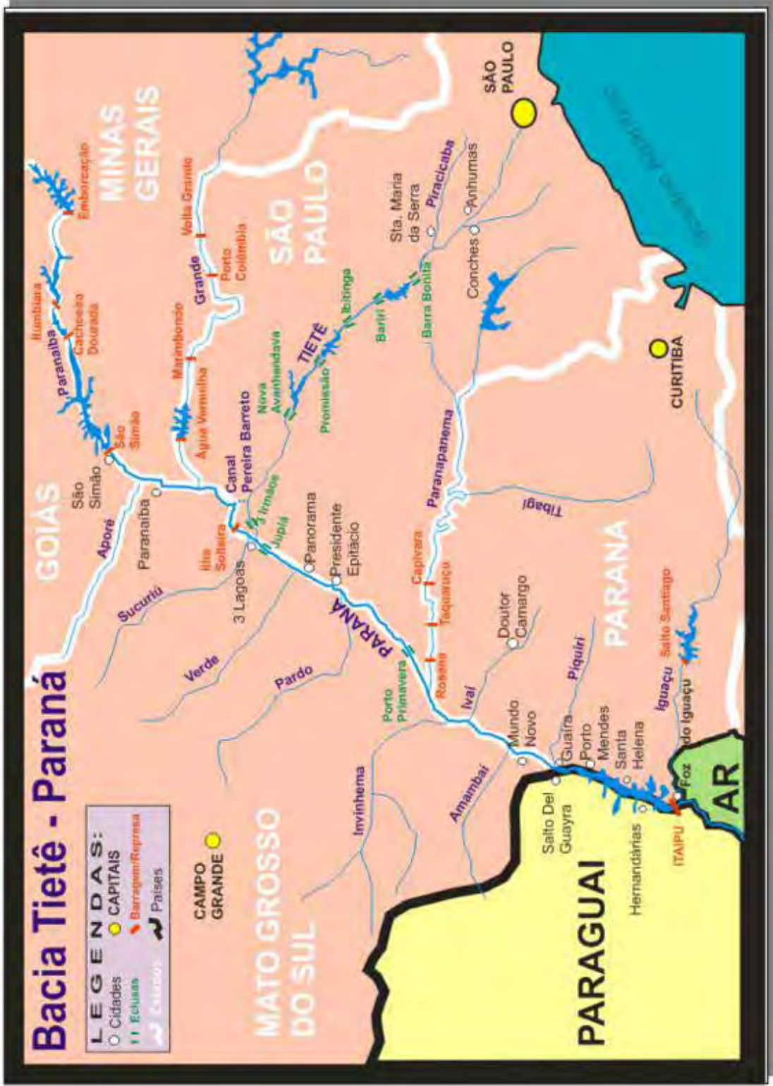
Bacia dos rios Tietê e Paraná