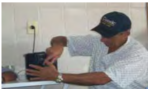
Fotos 7 e 8 - Tradição e modernidade: o rádio é companheiro constante, presente mesmo quando há cururu ao vivo.

José de Souza Martins (1974) identifica as principais transformações ocorridas no modo de realização do cururu quando passou a se adaptar ao rádio e ao disco: