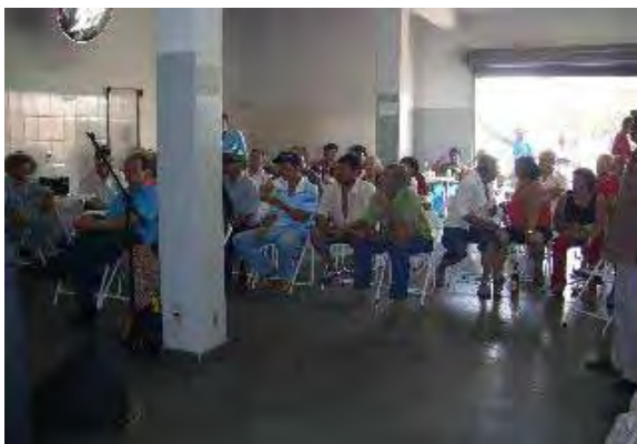
Fotos 11 e 12 - A assistência do cururu: público masculino majoritário.