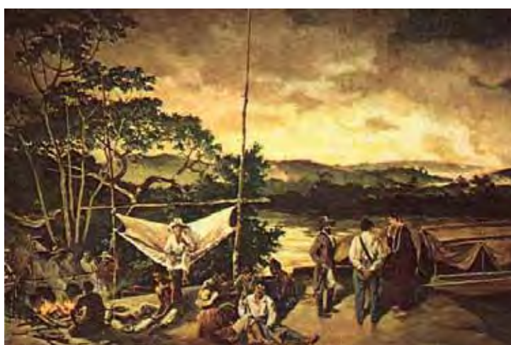
Gravura do século XVIII, ilustrando os tropeiros e os bandeirantes às margens do rio Tietê

Mas a peculiaridade dos tropeirismo está na efetiva manutenção e ocupação das fronteiras da porção meridional do Brasil através da circulação de mercadorias que proviam o abastecimento interno e possibilitavam, ainda que de forma rudimentar, a comunicação e as trocas comerciais entre povoados, vilas, e cidades distantes e/ou isolados através de um “complexo de rotas e trilhas que passou a cortar todo o território” (STRAFORINI, 2001, p. 16).