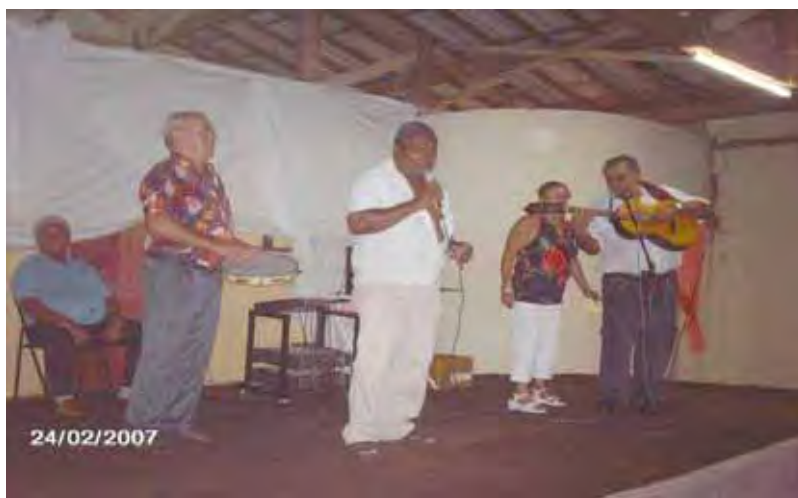
Foto 1 : Cururu em Salto de Pirapora/SP: o pandeiro marca o compasso acompanhando o som da viola.

As características de ruralidade do cururu nos ranchos marcariam seu modo de realização. Não há pagamento em dinheiro aos cantadores e violeiros, o canturião (como era chamado o cantador de cururu , também conhecido por cururueiro) canta por cumprimento de sua religiosidade, sendo convidado por um festeiro que, em nome de determinado santo de sua devoção, e muitas vezes em cumprimento de promessa por uma graça alcançada, oferece alimentação aos cantadores, violeiros e pessoas convidadas. A viola é o instrumento por excelência do cururu e outros instrumentos, como reco-reco e pandeiro podem também acompanhá-la. O único divertimento que pode haver durante os festejos do Divino Espírito Santo é a realização de cururu .