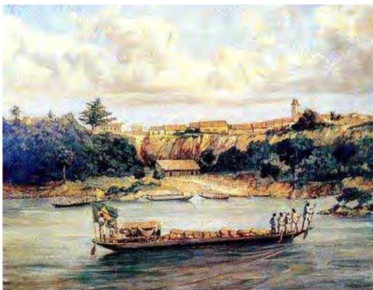
Partida de Porto Feliz, óleo de Oscar Pereira da Silva, a partir de Adrien-Aimée Taunay (1826)

[...] os viajantes navegavam somente durante o dia, depois de dissipados os nevoeiros, e até pouco antes do por do sol, quando se acomodavam às margens dos rios para passar a noite em terra firme. Nesses acampamentos improvisados limpavam o mato, armavam as redes para dormir, dançavam o cururu , uma dança de roda, aprontavam a ceia e preparavam a refeição do dia seguinte, que consistia no virado à paulista (feijão, toicinho e farinha de milho), que era comido frio, à bordo da canoa (CESP/GOVERNO DO ESTADO DE SP, 1991, p. 69) .