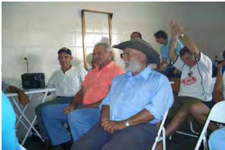
Foto 9 - A louvação religiosa no cururu é motivo de aplauso, reverência e respeito à narrativa, sobretudo, por parte dos mais velhos.

Outra indicação de forte aspecto religioso e sagrado presente nas 'carreiras' constitui, sem dúvida, numa forma de reverenciar aos santos católicos como São Bento, São João Batista, São Vicente, São Judas Tadeu, entre tantos outros. O sentimento religioso também é expresso por meio da crítica que o cantador pode vir a fazer com relação às outras religiões, já que o cururu sempre está vinculado ao catolicismo. Em algumas gravações fica explícita a antipatia histórica por religiões (neo) pentecostais, ao Espiritismo ou a outras modalidades religiosas tidas pejorativamente como mágicas ou como “macumba”, no caso específico das religiões afro-brasileiras reforçando novamente o elemento de procedência do cururu em sua associação com a catequese no Brasil colonial.