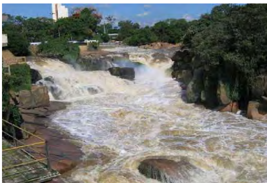
Trecho do rio Tietê na cidade de Salto/SP

Como vimos, a geografia foi fator preponderante na ocupação do continente a partir do sertão paulista. A marcha a pé teve que ser interrompida em vários momentos, principalmente em decorrência de imposições geográficas. Os rios eram uma das imposições. Embora não constituísse a principal via de penetração no continente, os grandes rios como o Tietê, desempenharam um papel que não foi simplesmente acessório no sentido da colonização, exploração e povoamento do planalto (HOLANDA, 1990, p. 18).