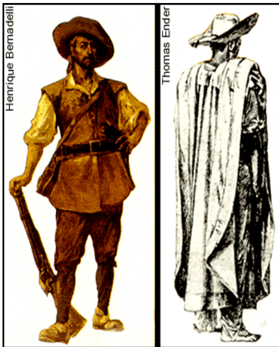
A iconografia busca representar um paulista "heroicizado", bem vestido, com botas de couro e munido de armas de fogo, muito diferente do homem que habitava o planalto de Piratininga, afeito à influência indígena

É o encontro de civilizações diferentes (ameríndios e europeus num primeiro momento e africanos posteriormente) que impõe as primeiras transformações na estrutura da narrativa. O conflito como marca preponderante que dimensiona a amplitude deste encontro de diferentes alteridades e cosmologias, determinou a transformação da narrativa: a voz indígena antes ativa passa, com a colonização, para a voz passiva no que se refere ao protagonismo, mas nem por isso deixa de transmitir sua herança. Estes elementos reforçam a idéia de que mesmo num contexto