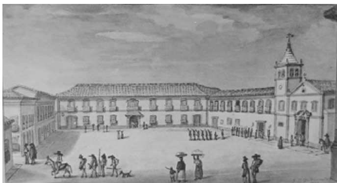
O Pátio do Colégio, em ilustração de 1824.

[...] os missionários fizeram uma partilha tática no conjunto das expressões simbólicas dos nativos. Colheram e retiveram das narrativas correntes só aquelas passagens míticas nas quais apareciam entidades cósmicas ( Tupã ), ou então heróis civilizadores ( Sumé ), capazes de se identificarem, sob algum aspecto, com as figuras pessoais e bíblicas de um Deus Criador ou de seu Filho Salvador" (BOSI, 1992, p. 68).