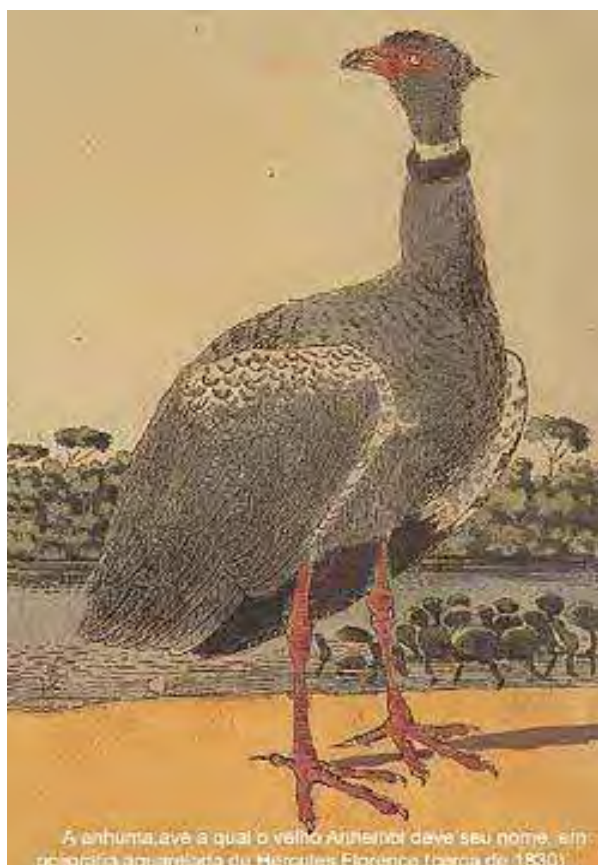
A anhuma, ave a qual o velho Anhembi deve seu nome, em policromia aquarelada de Hércules Florence (cerca de 1830)

Anhuma, ave que emprestou seu nome ao rio Tietê, em aquarela de Hércules Florence (cerca de 1830)