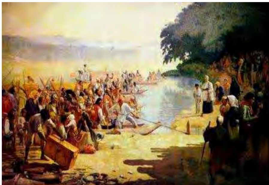
Partida de uma monção – Óleo de J. F. Almeida Júnior (1897)

O caminho fluvial do Tietê que levava ao interior do Mato Grosso também contribuiu para adentrar o interior do sertão abrindo caminhos, superando os obstáculos que propiciaram a descoberta de ouro no século 18 em Minas Gerais, Goiás e Mato Grosso, expandindo os territórios de além Tordesilhas para o domínio português.