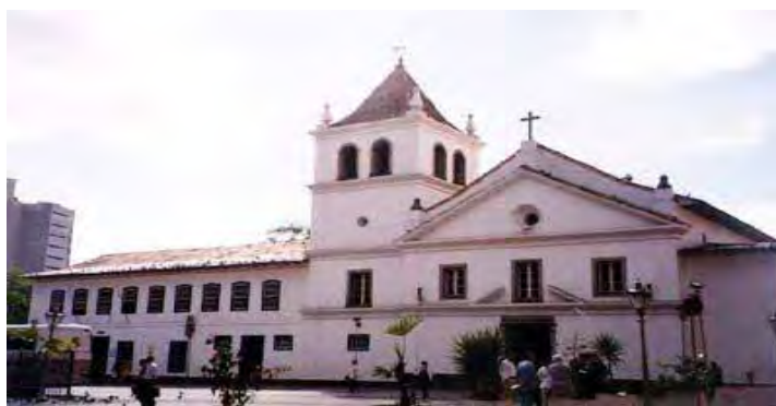
O pátio do Colégio em fotografia recente, sem data.