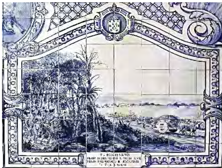
Itu, boca do sertão visualizada em azulejo de Afonso de Escragnolle Taunay - 1942