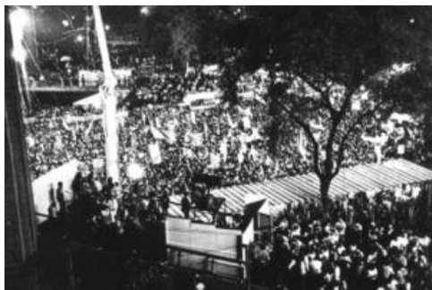
Vista parcial do comício do Vale do Anhangabaú, em 16 de abril de 1984.

Mais de um milhão de pessoas em silêncio, mãos entrelaçadas, braços para cima. Ao sinal do maestro Benito Juarez, da Orquestra Sinfônica de Campinas, a multidão cantou o Hino Nacional. Do céu caía papel picado, papel amarelo, a cor das diretas, brilhando à luz dos holofotes. No Vale do Anhangabaú, muita gente chorou. Houve outros momentos de emoções na