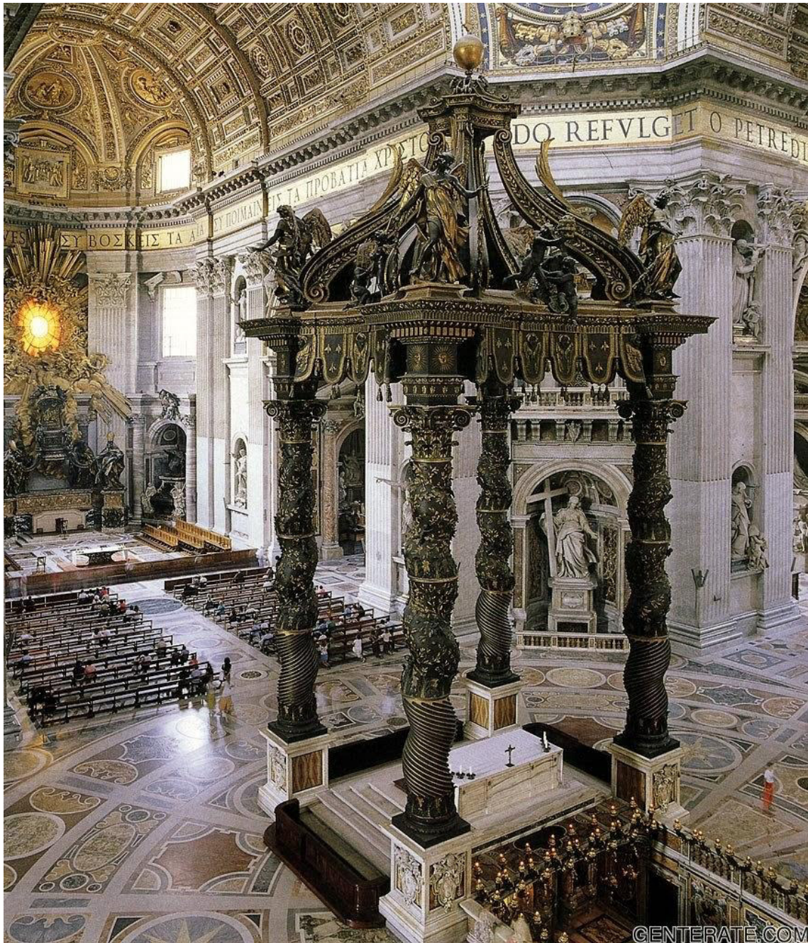
Imagem 3 – BERNINI, G. L. Baldachino . Basílica de São Pedro, Roma.