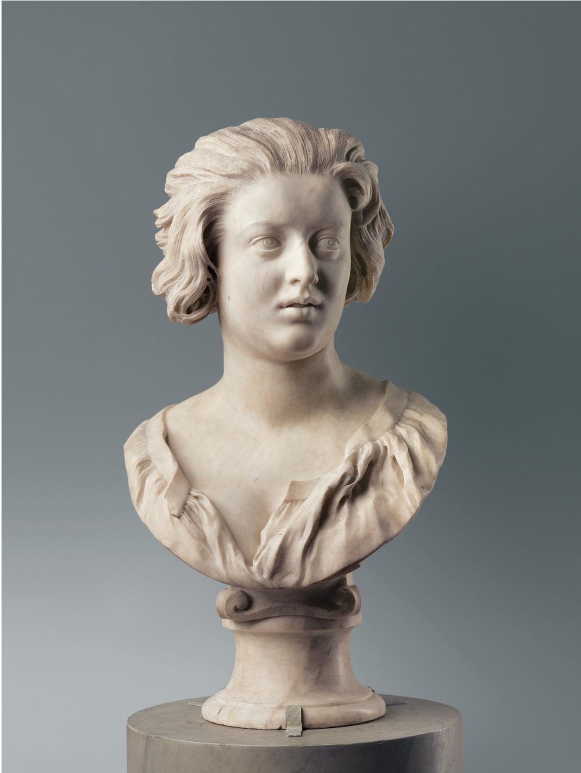
Imagem 2 – BERNINI, G. L. Constanza Bonarelli . Museu do Bargello, Florença.