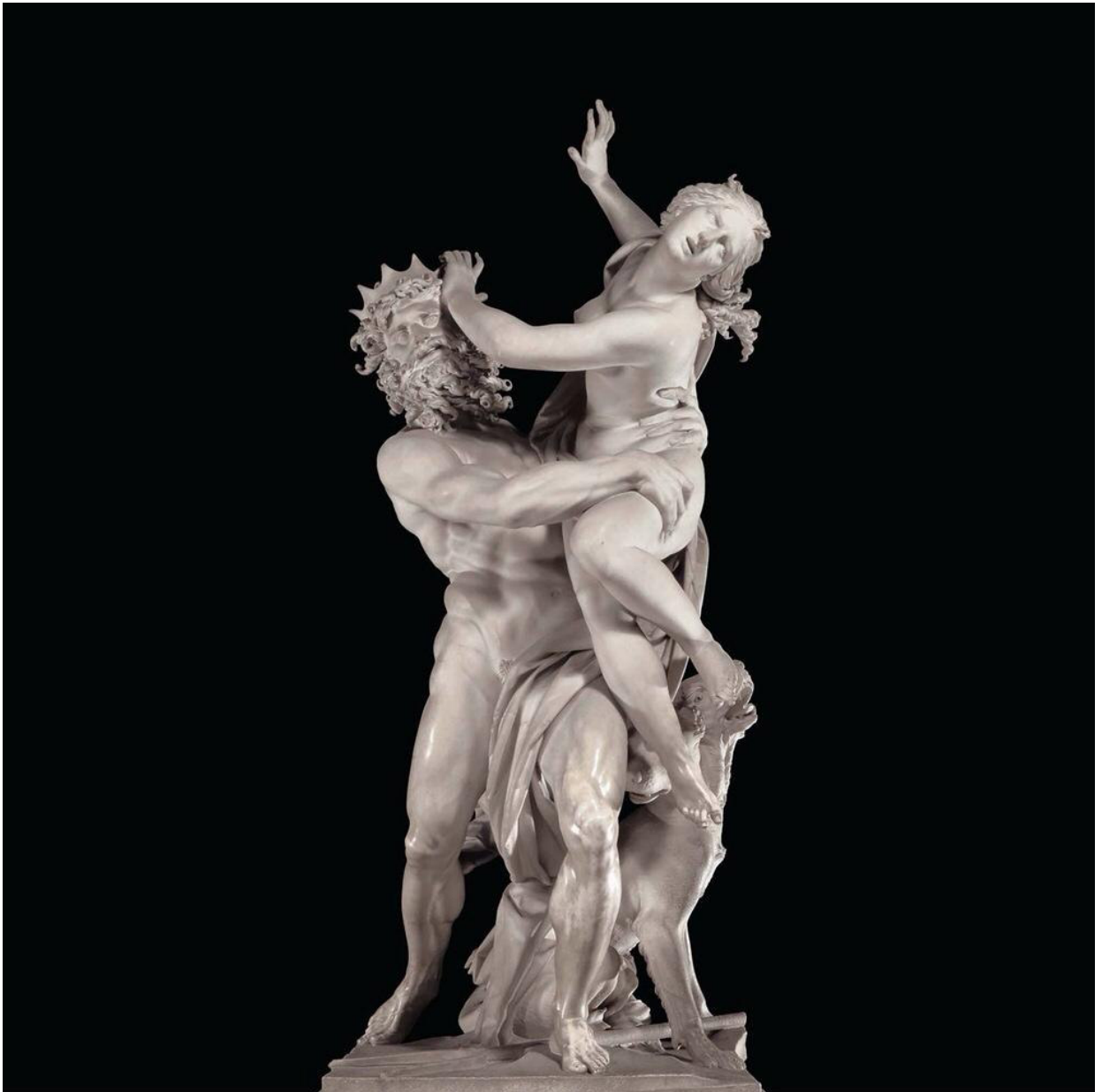
Imagem 5 – BERNINI, G.L. O rapto de Prosérpina . Galeria Borguese, Roma.