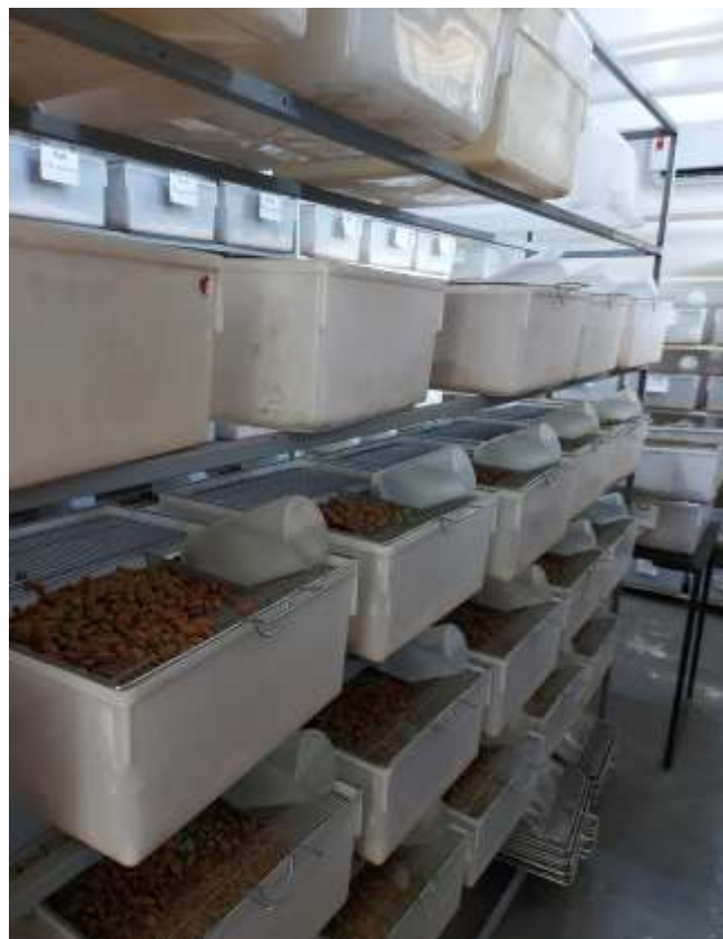
Figura 7 - Biotério de ratos e camundongos usados para a dieta das serpentes no Jiboias Brasil.

Existe também um local denominado área suja, onde são feitas as higienizações de caixas e outros materiais usados no manejo. Na sala de estoque são guardados os materiais usados no dia a dia do criatório e um biotério de ratos e camundongos equipados com ar-condicionado estantes e caixas forradas de maravalhas, com ração e bebedouros de água para os roedores, que são utilizados na alimentação das serpentes. Cada sala é equipada com borrifadores de álcool e CB-30 além de comedouros limpos para realizar trocas.