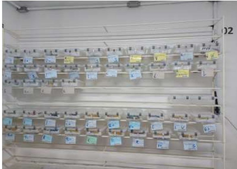
Figura 5 - Estante na maternidade do Jiboias Brasil, com caixas contendo diferentes espécies e devidamente identificadas com uso de crachás.