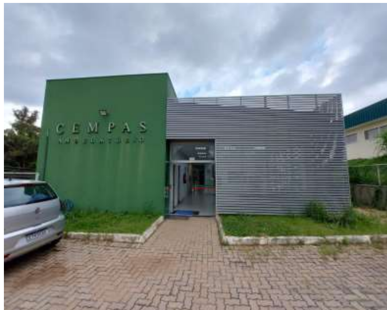
Figura 8 - Entrada para o ambulatório do CEMPAS, UNESP - Botucatu.

O CEMPAS é um hospital veterinário especializado em animais selvagens que atende pets não convencionais de tutores no particular e também animais selvagens que sofreram algum acidente ou resgatados e trazidos pela polícia ambiental, bombeiros, outros órgãos públicos e até mesmo civis que ocasionalmente encontram fauna silvestre debilitada. Diversos grupos de animais são recebidos no CEMPAS como mamíferos, aves, répteis de várias famílias diferentes, com uma maior incidência de animais sinantrópicos como gambás e maritacas.