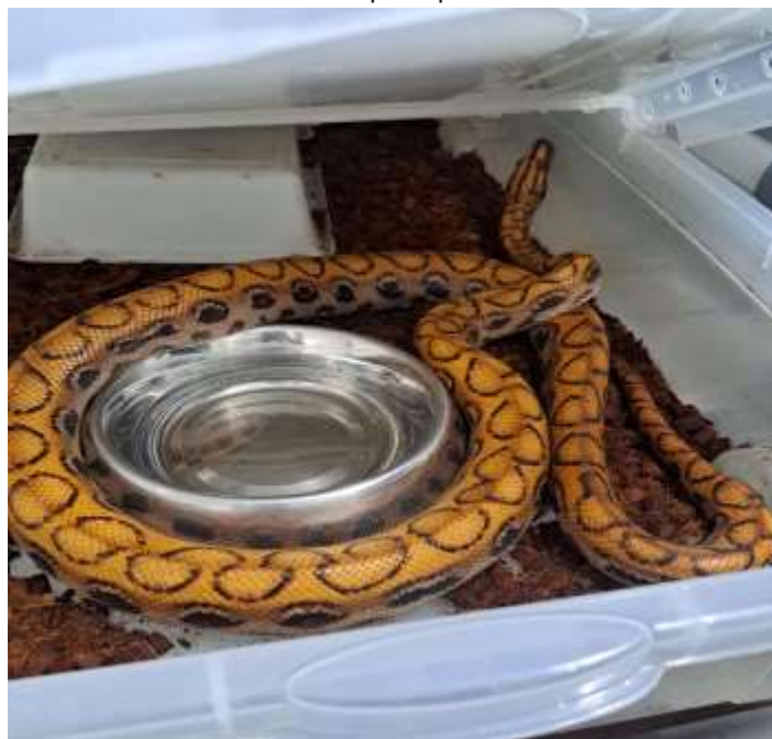
Figura 6 - Interior de uma caixa de Epicrates cenchria hygrophilus , localizada no Jiboias Brasil.