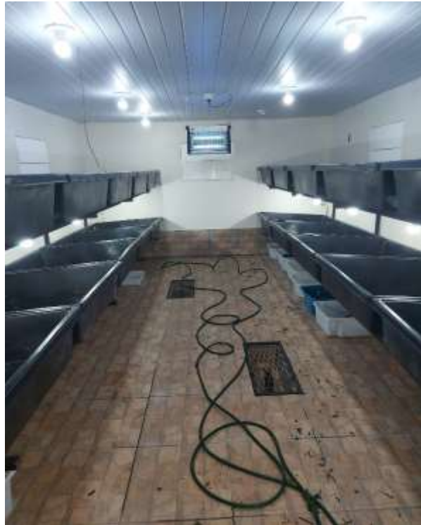
Figura 2 - Berçário da Reserva Romanetto, destinado aos jabutis. (Arquivo pessoal).

aquecedores e bacias com torneiras, saídas de água e uma tela para que consigam sair da água, sendo cerca de 50 bacias com em média 15 filhotes por recipiente.