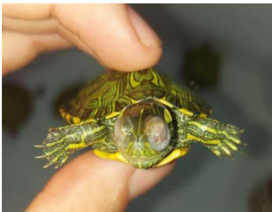
Figura 10 - Sinais de blefaroedema e blefaroespasmos em um filhote da espécie Trachemys dorbigni . (Arquivo pessoal).

Com o esgotamento das reservas de vitamina A o metabolismo das células epiteliais fica comprometido, o que leva a substituição dessas células epiteliais cuboides ou colunares, por epitélio estratificado queratinizado. A desordem nutricional leva a um quadro de metaplasia escamosa, causando necrose e morte das células, a descamação do epitélio faz com que ocorra o acúmulo desses restos celulares em todos sistemas do organismo, alguns dos principais sinais clínicos observados nos animais acometidos são o blefaroedema e blefaroespasmos por conta dos debrís celulares acumulados nos sacos conjuntivais (MANS; BRAUN 2020. PEREIRA et. al, 2017).