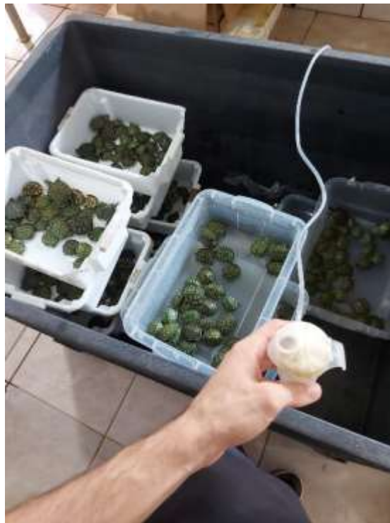
Figura 9 - Caixa utilizada para nebulização com gentamicina e soro fisiológico, na Reserva Romanetto. (Arquivo pessoal).

A partir da segunda semana de estágio foi estabelecido um protocolo de tratamento para os filhotes de tigre d'água que se encontravam acometidos com sinais respiratórios, blefaroedema, apatia e altos índices de óbito no plantel, então antes mesmo da alimentação e manejo da parte da manhã, os animais enfermos eram submetidos a nebulização utilizando soro fisiológico e gentamicina, no nebulizador eram adicionados 1mL de Gentamicina e nove 9mL de soro, para o procedimento, os animais eram postos em uma grande caixa onde permaneciam pela duração de uma hora todos os dias, no período de 20 dias.