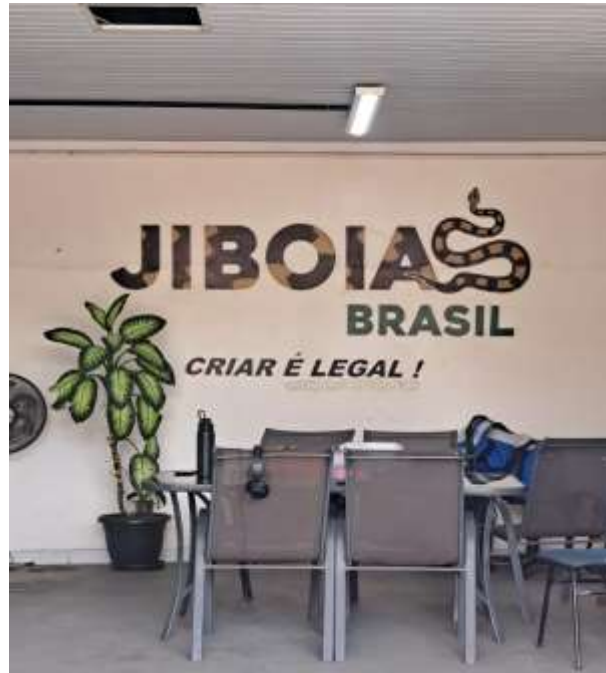
Figura 4 - Entrada do criatório Jiboias Brasil, Betim-MG. (Arquivo pessoal).

Outro criatório comercial legalizado, que trabalha com serpentes da família dos boídeos realizando a venda de filhotes e adultos das espécies: Jiboia ( Boa constrictor constrictor ), Jiboia Cinzenta ( Boa constrictor amarali ), Jiboia arco-íris da Amazônia ( Epicrates cenchria cenchria ), Jiboia arco-íris da Caatinga ( Epicrates cenchria assisi ), Jiboia arco-íris do Norte ( Epicrates cenchria maurus ), Jiboia arco-íris do cerrado ( Epicrates cenchria crassus ) e Jiboia arco-íris da Mata Atlântica ( Epicrates cenchria hygrophilus ). Todos os animais possuem em seus recintos, crachás com uma cor referente a espécie que pertencem, além de informações do sexo e origem.