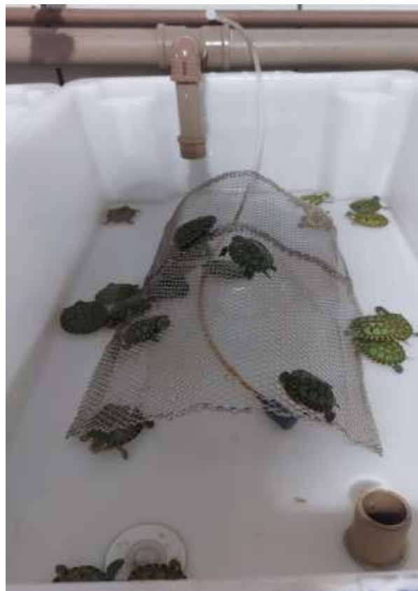
Figura 3 - Uma das bacias do berçário de tartarugas da Reserva Romanetto. (Arquivo pessoal).