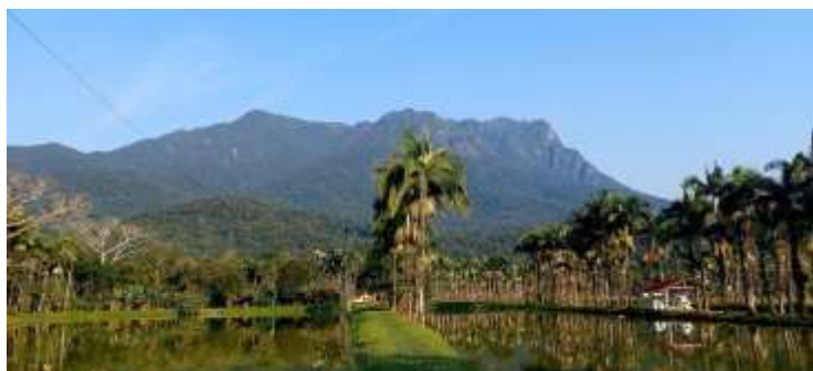
Figura 1 - Foto do território da Reserva Romanetto, Morretes – PR, com os lagos das matrizes de tartarugas.

Trata-se de um criatório comercial legalizado de Testudines que se encontra em uma fazenda na cidade de Morretes no estado do Paraná, no local são criadas três espécies de testudines sendo elas o jabuti-piranga ( Chelonoidis Carbonaria ), jabuti-tinga ( Chelonoidis denticulata ) e a tartaruga-tigre-d'água ( Trachemys dorbigni ). Os filhotes são criados e vendidos para o consumidor final e lojas revendedoras.