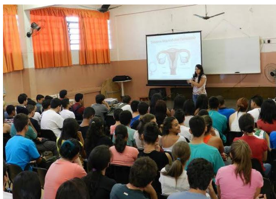
Imagem 1. Palestra na E.E. Dr. Luiz Zuaini, Bauru, 2014.

concepção foram depositadas na categoria "métodos contraceptivos e proteção"; questões acerca da gravidez e/ou como preveni-la foram selecionadas na categoria "gravidez"; dúvidas sobre doenças que podem ser contraídas pelo contato físico e ato sexual, e suas formas de contágio foram separadas em "doenças sexualmente transmissíveis"; questões que ou não se encaixaram nas categorias acima ou não eram pertinentes e sérias foram classificadas em "outros".