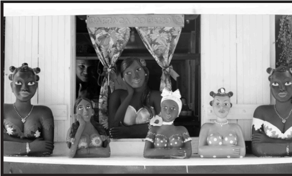
Namoradeiras e o namorado: Foto tirada de parte da fachada de um restaurante na Rua do Porto de Piracicaba (SP) | Julho de 2024