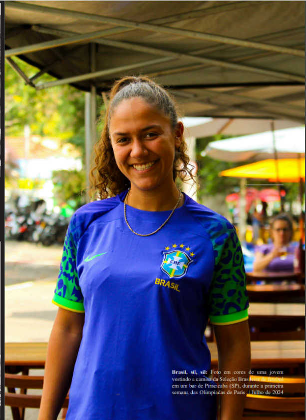
Brasil, sim, sim! Foto em cores de uma jovem vestindo a camisa da Seleção Brasileira de Futebol em um bar de Piracicaba (SP), durante a primeira semana das Olimpíadas de Paris | Julho de 2024