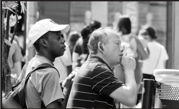
Pausa: Fotografia de dois trabalhadores descansando durante o horário de almoço no centro comercial de Piracicaba (SP) | Julho de 2024