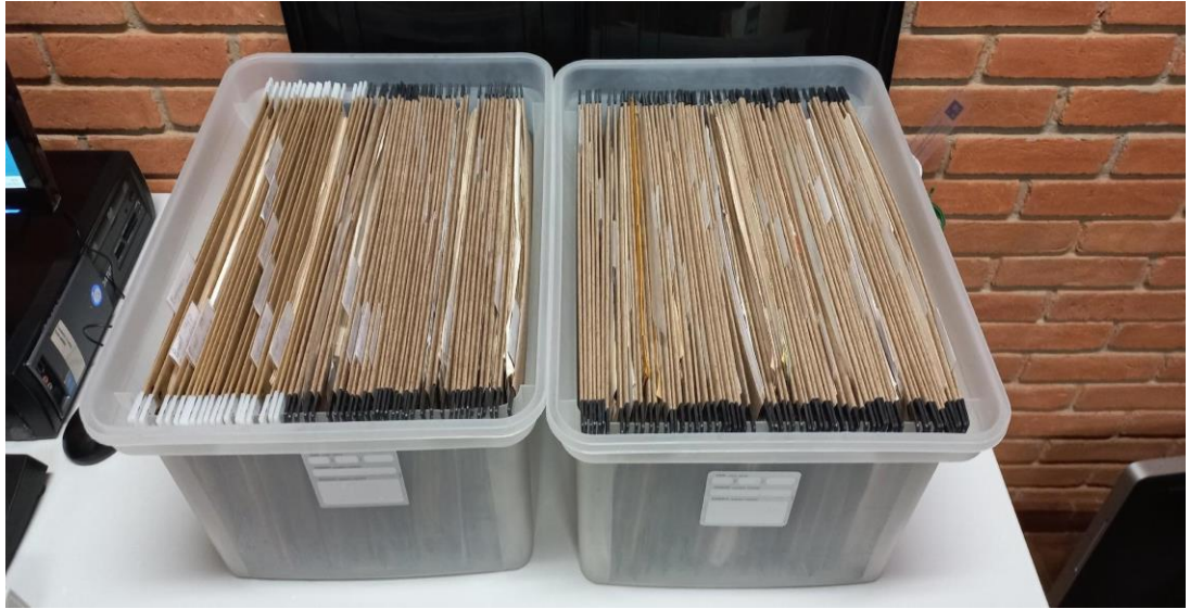
Figura 3 – material das gavetinhas já separados, organizados, registrados e guardados em caixas plásticas