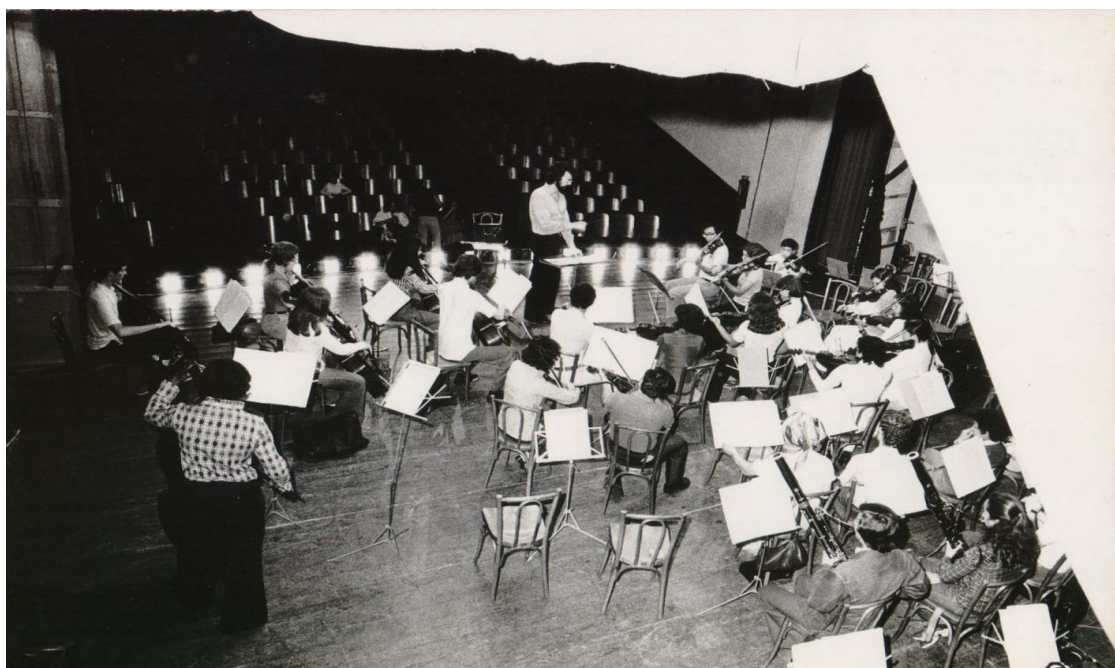
Figura 6 – audição de alunos da Escola Municipal de Música no Teatro João Caetano em 1975

Trago abaixo algumas imagens de objetos do acervo que falam de um mesmo concerto: