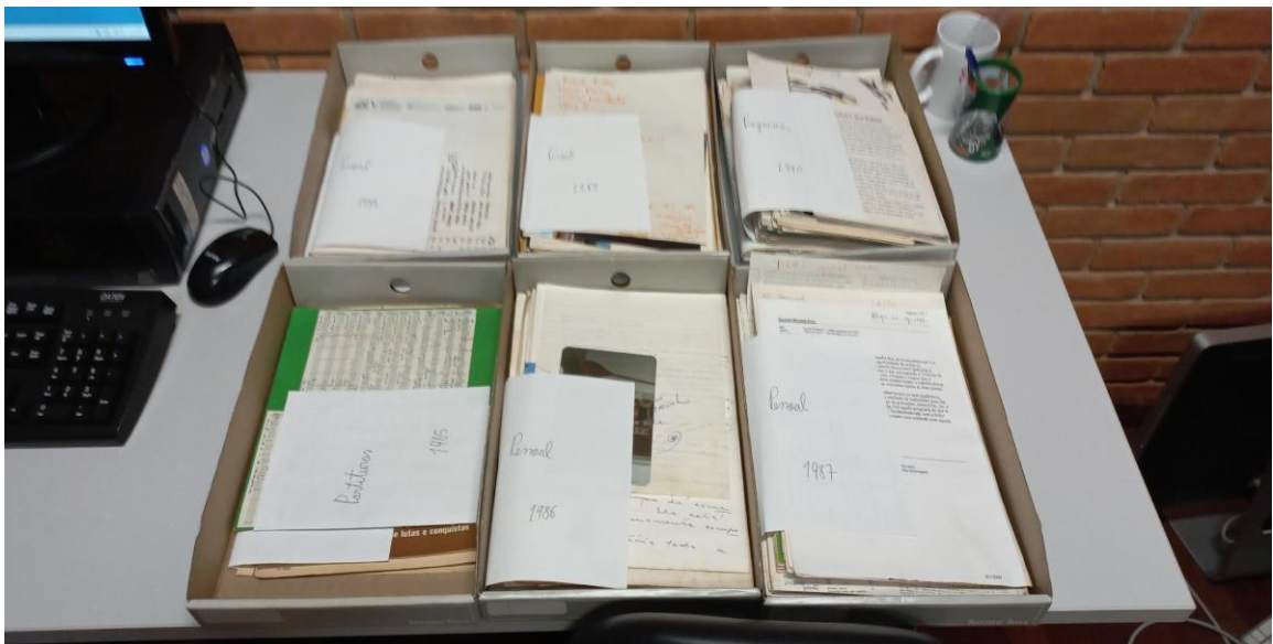
Figura 2 – gavetinhas de arquivos separados por ano, antes da sua catalogação