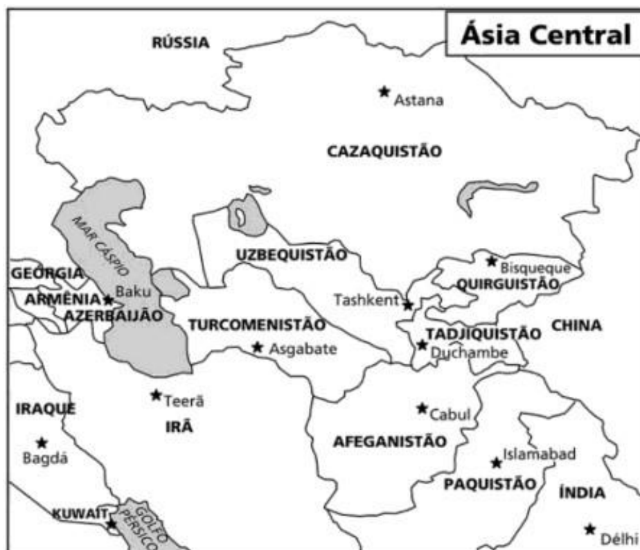
Figura 4 – Heartland da Eurásia

A partir de 1994, os Estados Unidos expandiram seu domínio sobre a Ásia Central – Turcomenistão, Cazaquistão, Tadjiquistão, Uzbequistão e Quirguistão ( Heartland da Eurásia, apresentada no mapa abaixo) – com a estratégia de diminuir sua dependência do Golfo Pérsico em relação ao petróleo.