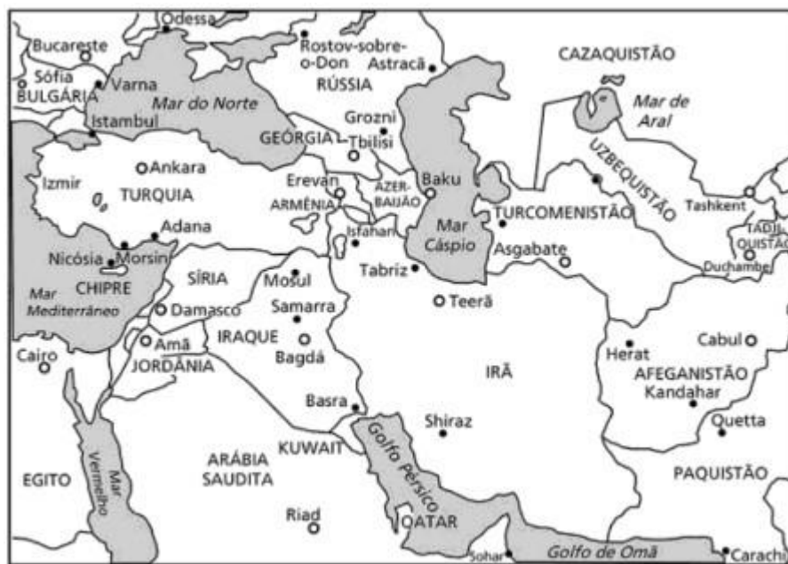
Figura 5 – Rotas de transporte do petróleo importado pelos Estados Unidos.

Nessa região, Clinton estimava haver uma reserva com cerca de 160 bilhões de barris, número que demonstrava um papel de relevância na demanda de energia mundial. Além disso, o autor afirma que cálculos previam que, em 2050, esse local proveria cerca de 80% do petróleo que os EUA importariam. Então, militarizou as rotas de transporte – entre o leste do Mediterrâneo e a China ocidental – a fim de manter a segurança e o controle dessas fontes de energia. O projeto geopolítico para esse feito pode ser observado na imagem a seguir, retirada do livro de Bandeira.