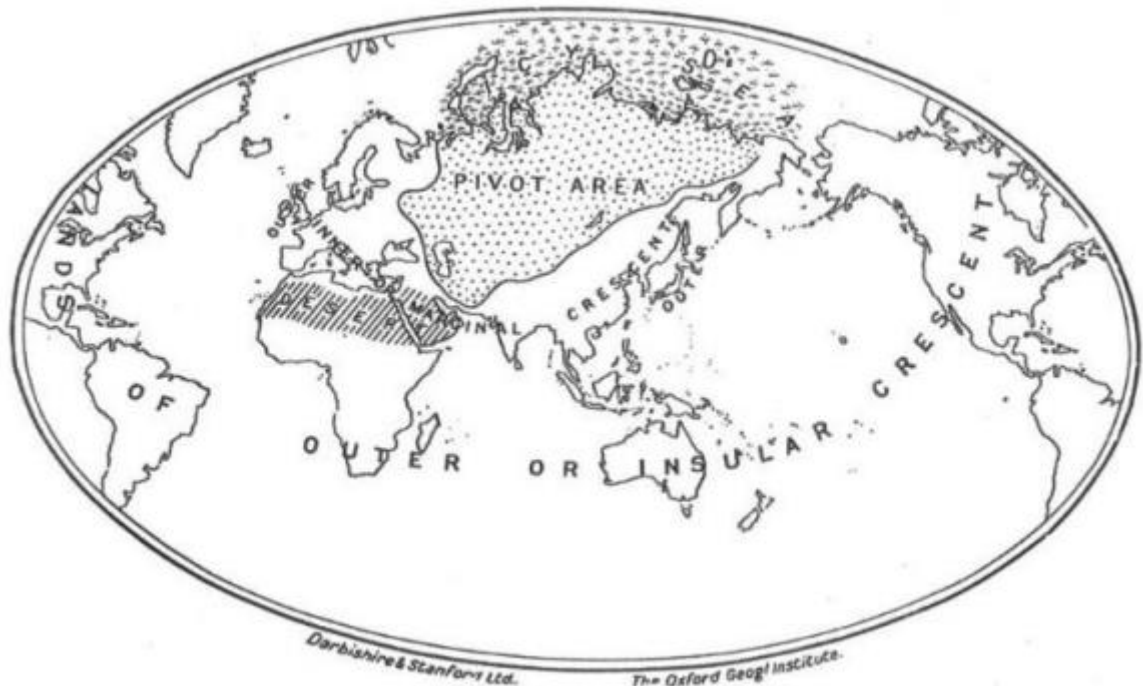
Figura 1 – O mundo conforme o pensamento de Mackinder