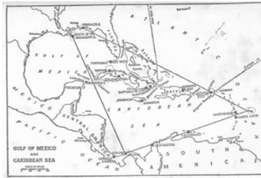
Figura 3 – Triângulo do Caribe