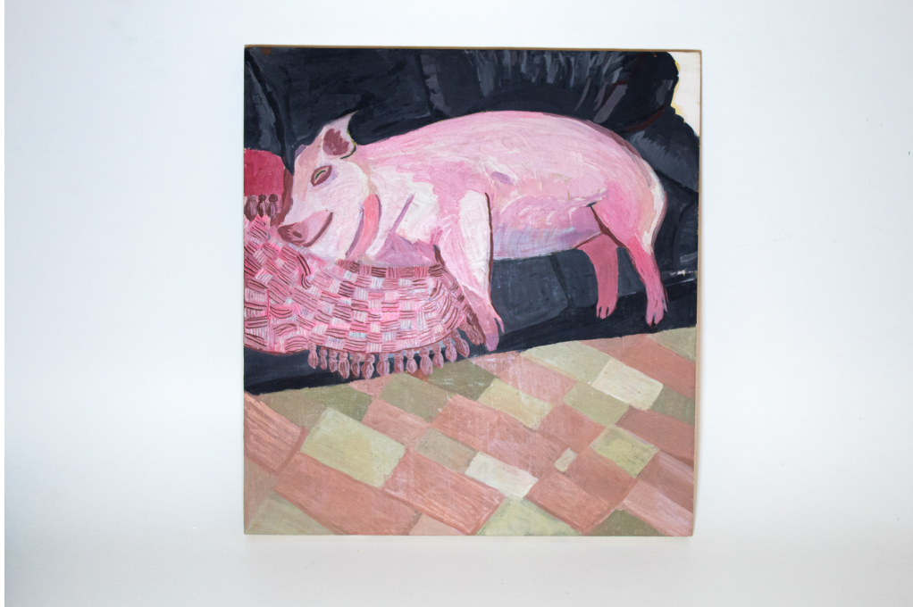
Figura 5 – Comer e dormir como um porco