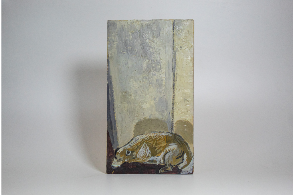
Figura 8 – Sem título