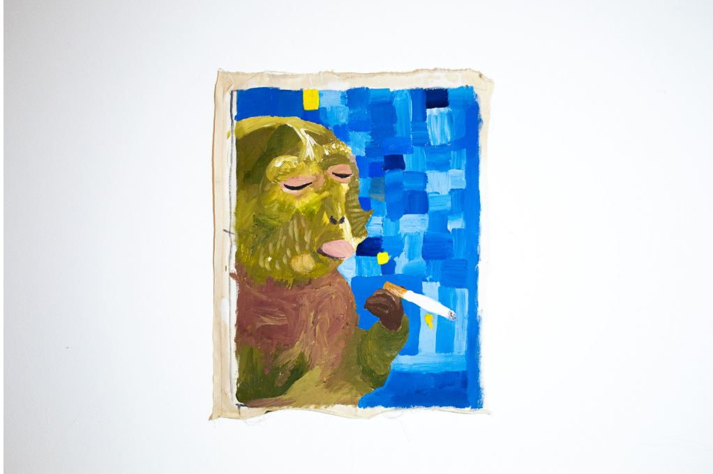
Figura 11 – O homem não vem do macaco