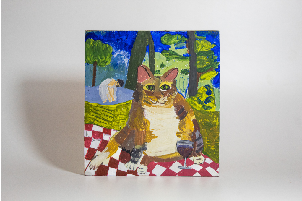
Figura 4 – Gatos com acesso à rua vivem menos