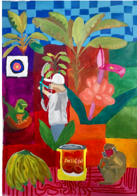
Figura 10 – 200 mil anos de evolução