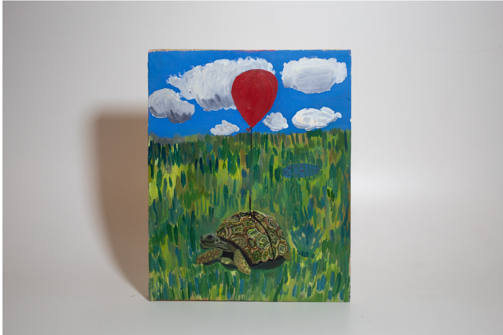
Figura 3 – Querer é poder