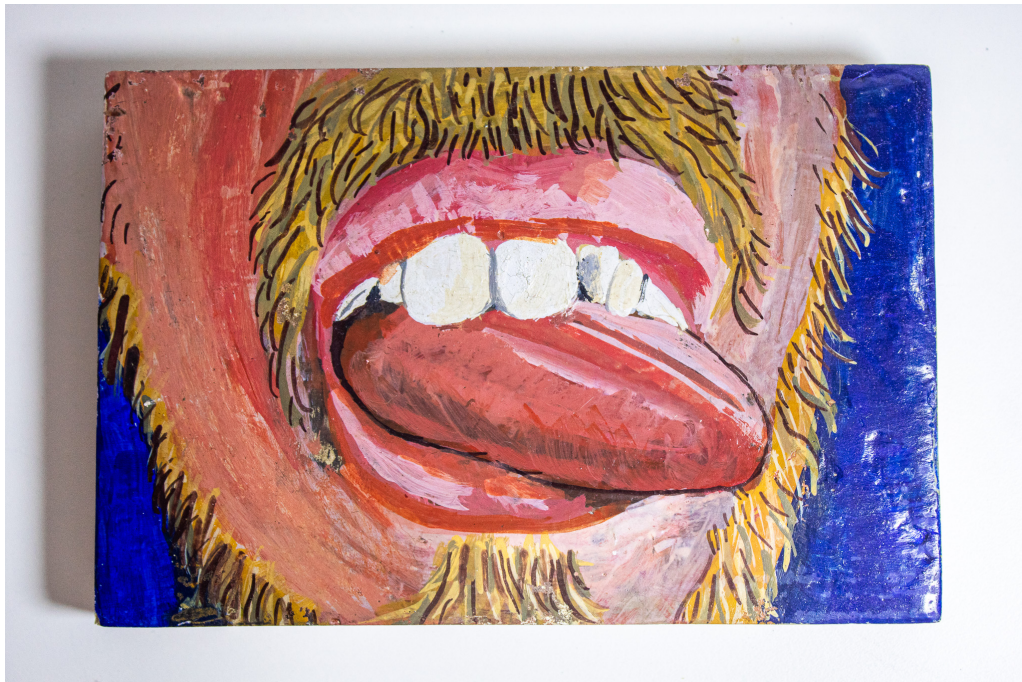
Figura 1 – Sem título