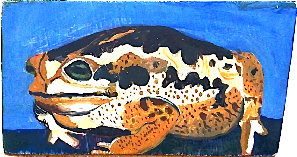
Figura 9 – Sem título