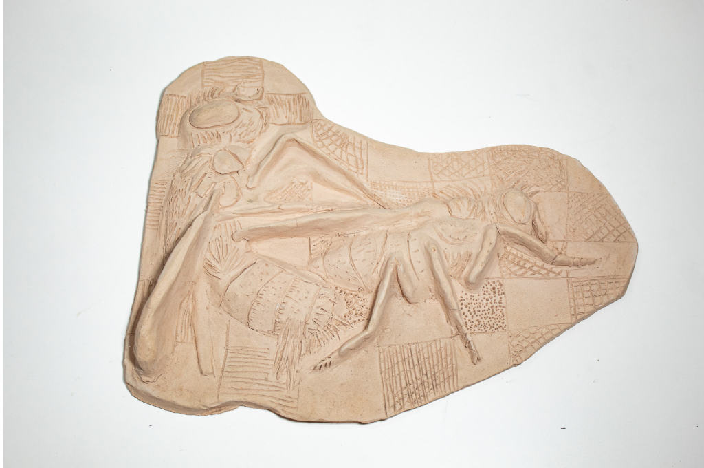
Figura 6 – Lua de mel