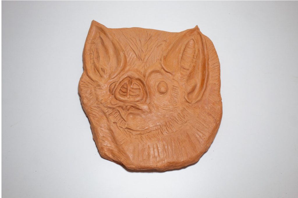
Figura 7 – Tão lindinho que dá raiva