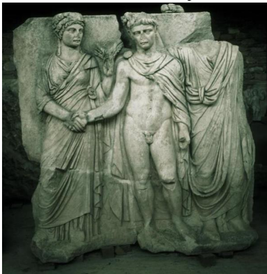
Figura 3. Relevo do Sebasteion de Afrodísias representando Agripina e Cláudio