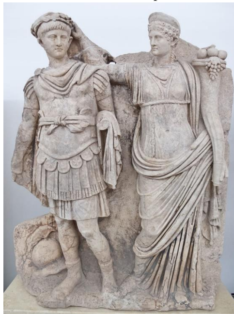
Figura 4. Relevô do Sebasteion de Afrodísias representando Agripina coroando Nero