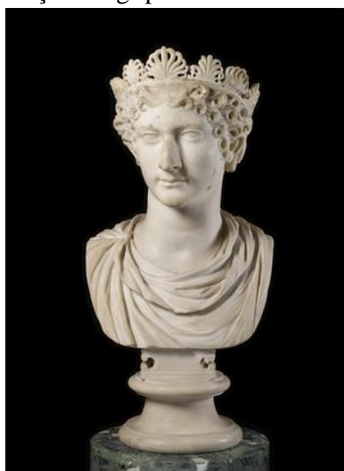
Figura 2. Cabeça de Agripina Menor usando um diadema