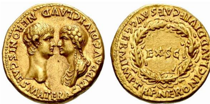
Figura 5. Aureus, de 7,63g, datada de 54 d.C., do governo de Nero 112

Bélo (2020) também destaca que não há como sabermos qual foi o tipo de recepção tomada por cada imagem feminina, já que isso é pouco comentado em fontes textuais e não há vestígios em fontes materiais, porém, a quantidade de representações durante um longo período das imagens de Lúcia, por exemplo, evidenciam grande aceitabilidade de sua honra, tanto para instituições políticas, como o Senado, que permitiu a cunhagem de suas moedas, quanto para o público, provado pela cunhagem de suas moedas em províncias do Leste e Oeste.