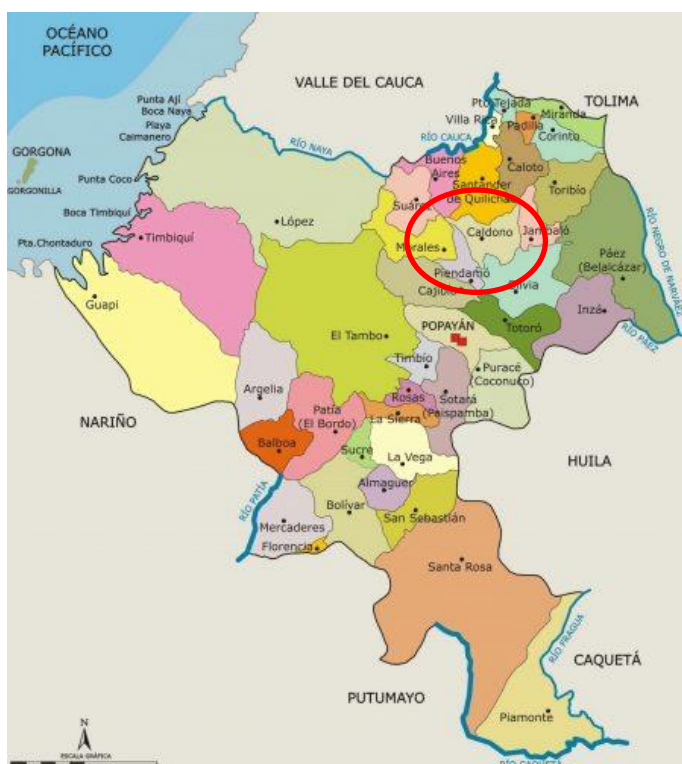
Mapa 1 - Localização de Silvia no estado de Cauca