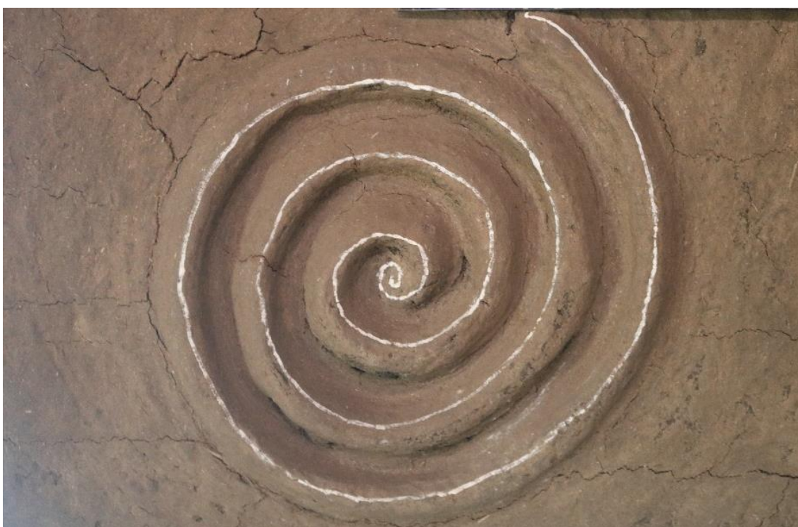
Fotografia 4 - Espiral na casa de pensamento Tulambiya na AJBD