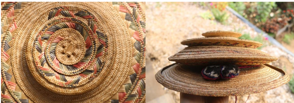
Fotografia 6 - Chapéu ancestral tampalkuari