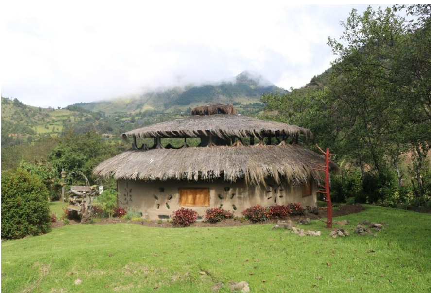
Fotografia 7 - Tulambiya casa de pensamento ancestral