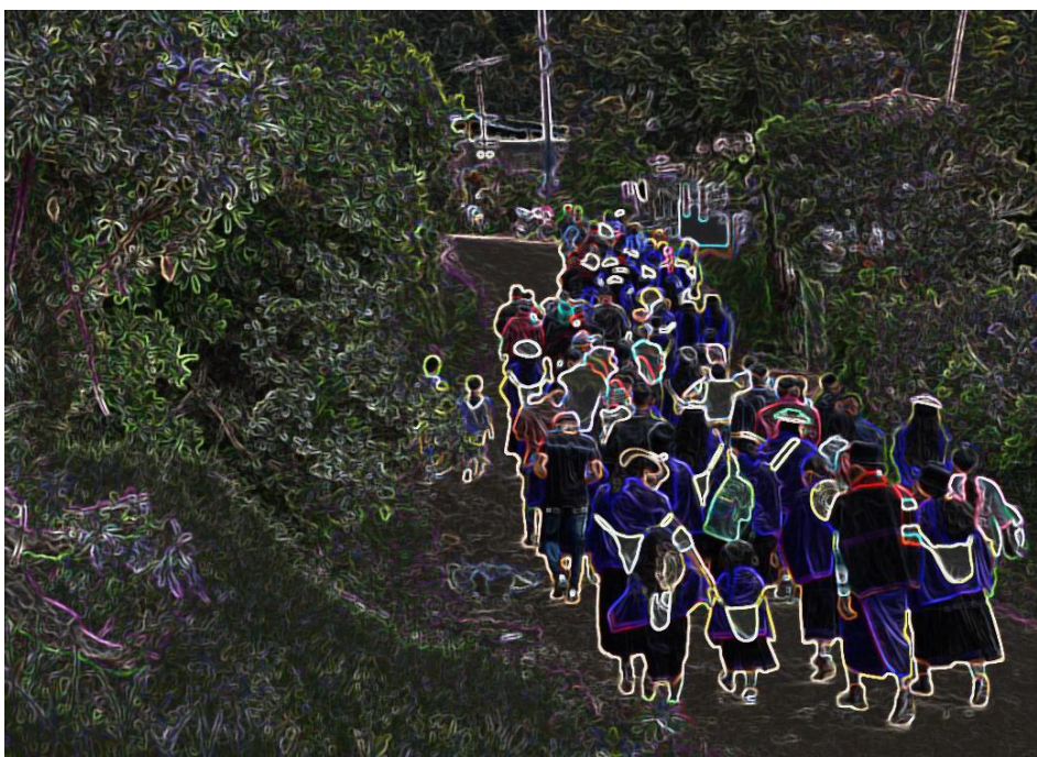
Fotografia 1 - Povo Misak