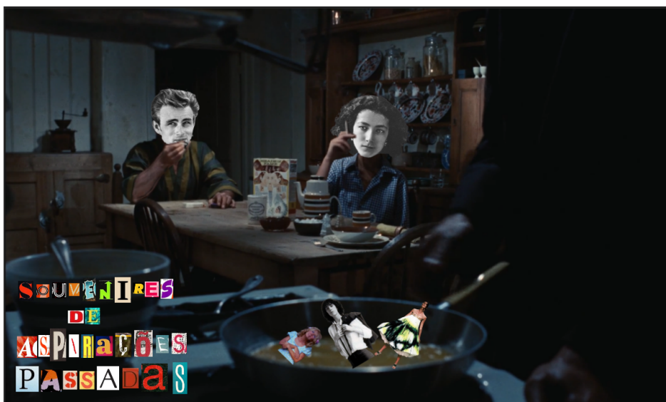
IMAGEM 4: Cartão 2.

O primeiro cartão tem Clarice Lispector, Patti Smith, Shelley Duvall no filme “ Brewster McCloud ” (Robert Altman, 1970) (todas usando máscaras características do período da pandemia) e duas fotos, uma de Robert Mapplethorpe e outra de Daidō Moriyama.