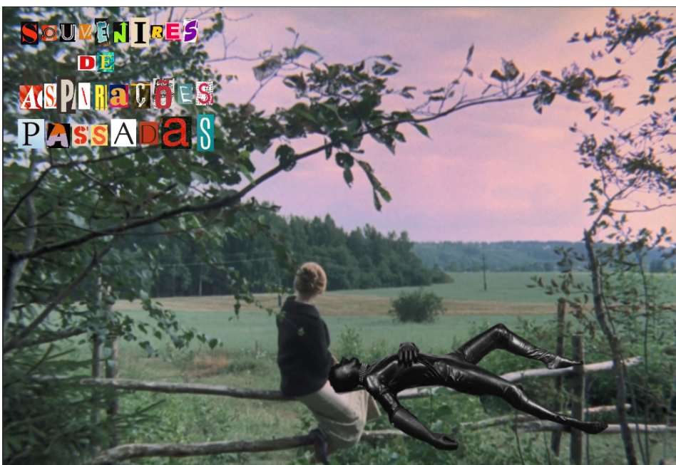
IMAGEM 6: Cartão 4.