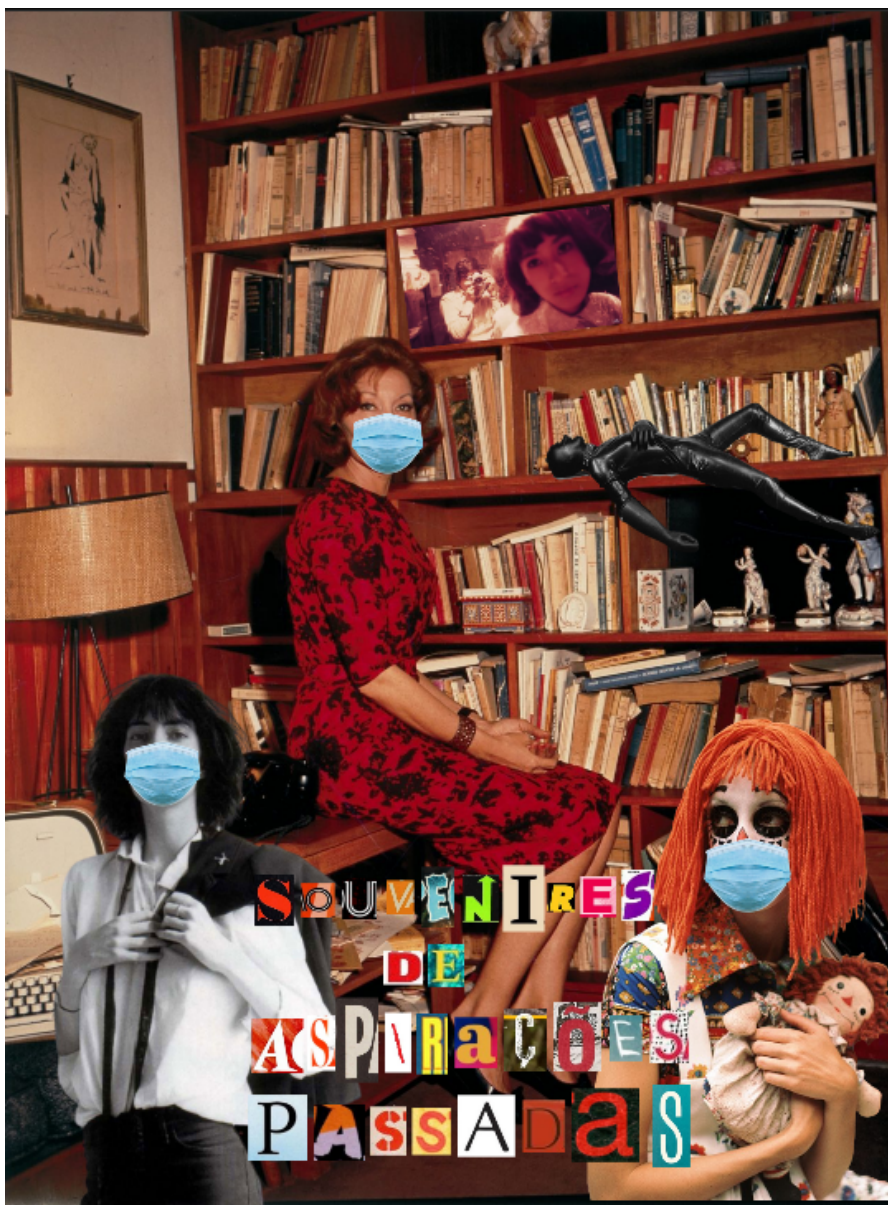
IMAGEM 3: Cartão 1. Autoria de: André Banin.

Logo após terminar, fiquei pouquíssimo feliz com o resultado, a ideia era de fato colocar muitas coisas mas para mim faltou um sentido de unidade entre elas. Foi então que, pensando em boxes de DVDs que comprava que vinham cartões dos filmes presentes nessas coletâneas, decidi fazer algumas versões de cartões, em que poderia usar diversas imagens mas não deixar nada muito poluído. Além disso, queria ter algo para presentear todos os amigos que me ajudaram de alguma forma, pude imprimir e dar para eles os tais cartões.