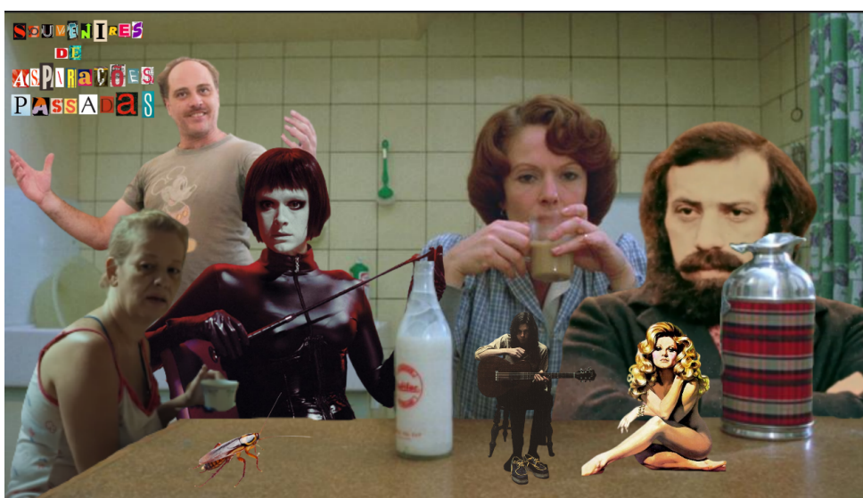
IMAGEM 5: Cartão 3.

O segundo é um quadro de “ Accident ” mas com as personagens substituídas por James Dean e Sarah Bernhardt, além das representações de Helena Ignez, Patti Smith e de vestido desenhado por Alexander McQueen.