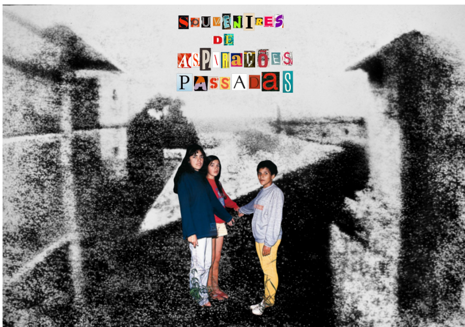
IMAGEM 7: Cartão 5.

O cartão de número 5 consiste numa fotografia de Joseph Nicéphore Niépce, mais especificamente a primeira foto da história, juntamente com o registro jornalístico das três meninas que viram o ET de Varginha.