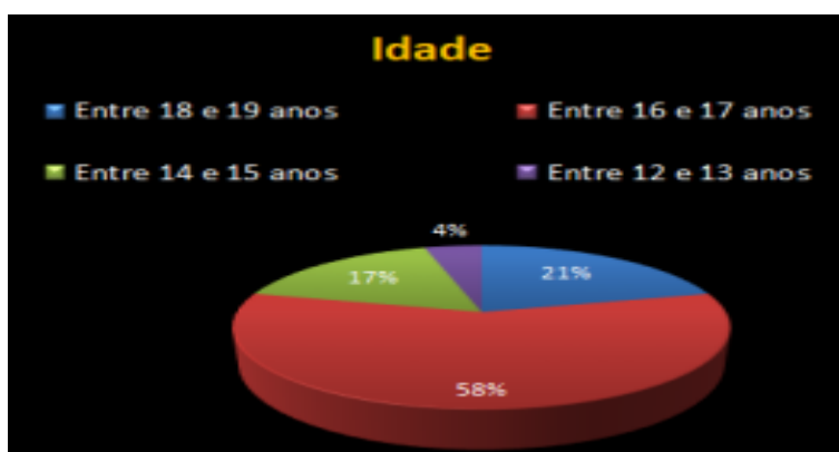
Figura 2: Idade dos Adolescentes e Jovens encontrados em situação de trabalho.

Indo na contramão das legislações, Tristão (2022) em sua pesquisa levantou dados alarmantes sobre o município de Franca em relação a essa realidade,