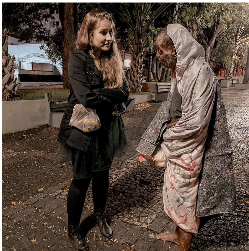
Figura 5 - Conversa com morador de rua que abordou uma das voluntárias pedindo cobertas