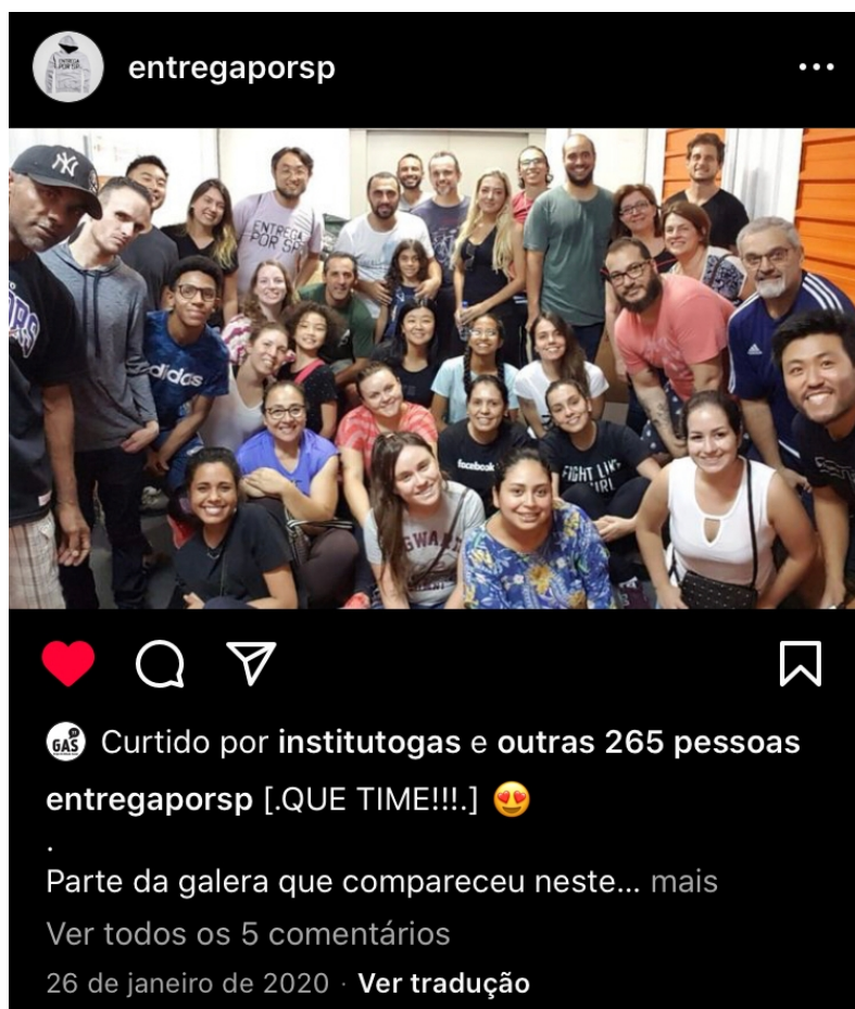
Figura 1 - Ação com os voluntários da ong Entrega por SP realizada em um galpão no centro da capital paulista