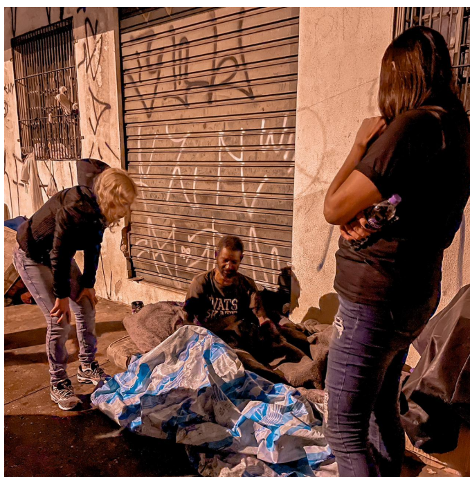
Figura 4 - Abordagem e conversa com morador de rua e entrega do kit de alimentação e higiene

Conversamos com dois senhores também, na faixa dos 50 e 60 anos, sem muitas pretensões de sair daquela situação, acostumados com as ruas. Enquanto um se protegia e esquentava seu corpo com cobertas e um tecido de plástico, daqueles de piscina, outro circulava pelo centro descalço pedindo mais cobertores.