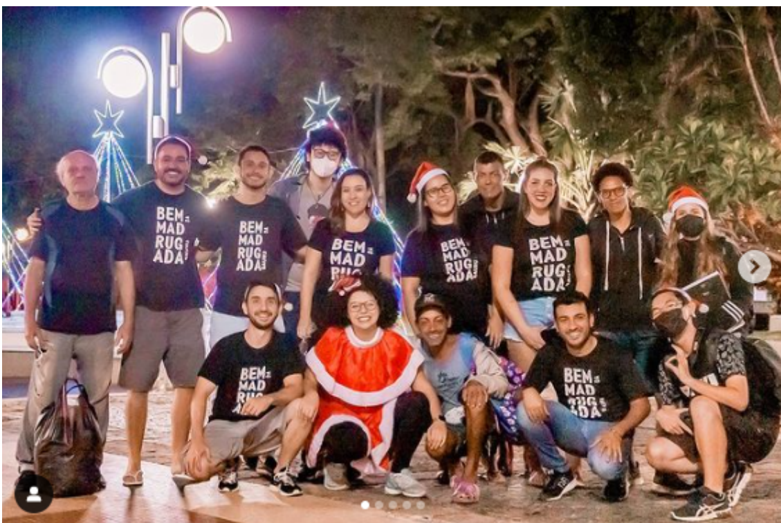
Figura 9 - Fotografia tirada ao final da ação especial de Natal (2022) dos voluntários do Bem da Madrugada Bauru

Por estarmos em uma região central, imaginamos que haveria um movimento maior de indivíduos, porém não foi o que aconteceu. Além do baixo número que se aproximou da equipe para conversar ou retirar um alimento, o público não era diverso ao passo que entrevistamos muitos homens, heteros e que se autodenominavam pretos e isso confirma um sintoma da composição das pessoas em situação de rua.