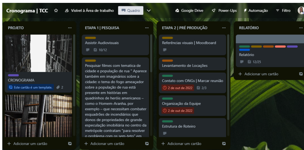
Figura 8 - Print do Quadro do Trello na fase de Pesquisa, Pré Produção e Relatório