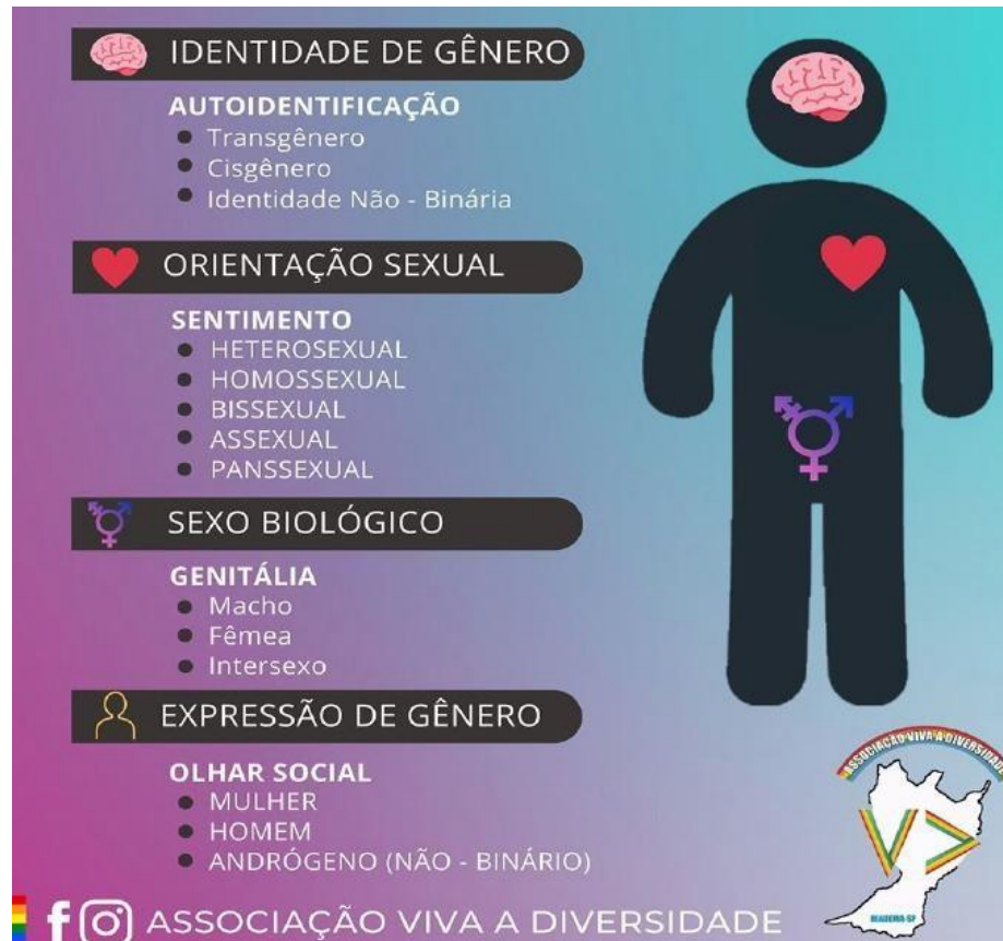
Figura 1 – Introdução à identidade de gênero e LGBTQIA+