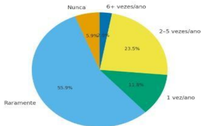
Gráfico 1 – Distribuição da frequência das viagens

Essa restrição econômica se reflete diretamente na frequência das viagens. A maioria das participantes declarou que viaja raramente (55,9%), sendo que 5,9% nunca viajaram. Apenas 23,5% conseguem viajar de duas a cinco vezes por ano, e 11,8% fazem uma viagem anual. O grupo que viaja com maior frequência (mais de seis vezes por ano) representa apenas 2,9% da amostra. Esses dados apontam para a ausência de acesso pleno a um direito ao lazer e ao turismo, reforçando a crítica à ideia de que o turismo é uma prática universalmente acessível.