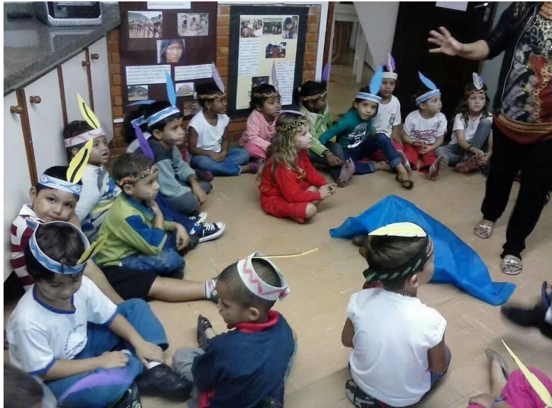
Figura 1. Manuseio de Objetos (Percepção Tátil).