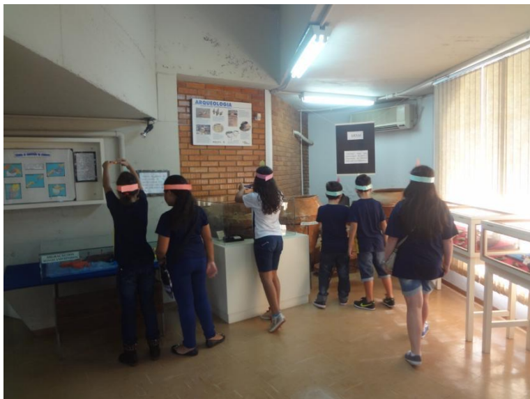
Figura 2. Visita monitorada ao acervo do Museu.