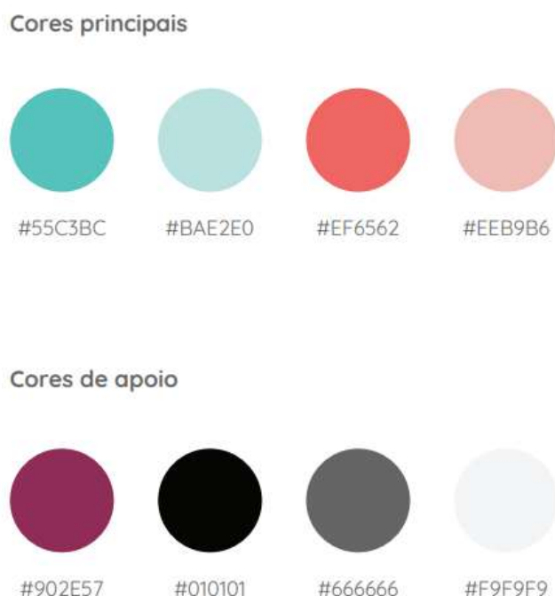
Figura 2 - Paleta de cores

Fonte: Manual de identidade visual desenvolvido por Nathalia Cabral para o projeto Via .