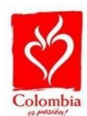
Figura 3: "Colombia és pasión"

o logotipo foi criado com o intuito de representar a paixão do povo, utilizando um coração e a cor vermelha como principais aspectos imagéticos da marca. Além da identidade visual, a marca atuou em cinco áreas, foram elas: publicidade, patrocinadores e licenciados; projetos especiais; relações públicas e divulgação interna; e conteúdo midiático. A figura 3 demonstra o logo da marca “Colombia es pasión”.