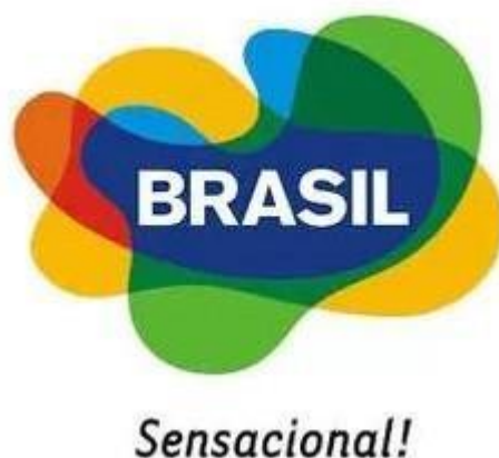
Figura 8: Marca Brasil

representam as festas populares como o carnaval. Além do logotipo, deve ser utilizado o slogan “Sensacional!” para representar a marca (CASTRO; GIRALDI, 2012). Veja na figura 8 abaixo.