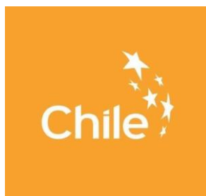
Figura 7: Marca Chile

campanhas e ativações no Chile e no exterior; realização do programa de uso de marca; pesquisa e análise de tendências; gestão de relacionamento com a imprensa estrangeira; marketing digital; e desenvolvimento de material audiovisual para a marca Chile. O logo da marca segue na figura 7.