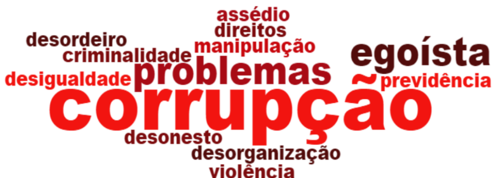
Figura 12: Nuvem características negativas

A Figura 12 ilustra as características citadas pelos alunos em contexto negativo. Essas auxiliaram na argumentação dos que compreendem que a marca não é representativa do Brasil e foram ressaltadas para evidenciar como a marca não tem fidelidade com a realidade nacional.