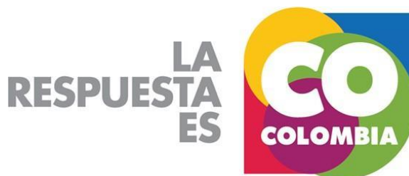
Figura 4: "La respuesta és Colombia"

Além da reformulação da abordagem, a identidade visual da marca Colômbia também foi modernizada. Ganhou uma nova forma e cores, que representam o país, e hoje é representada pela identidade que pode ser conferida na figura 4.