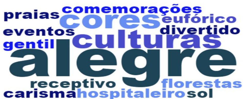
Figura 11: Nuvem características positivas