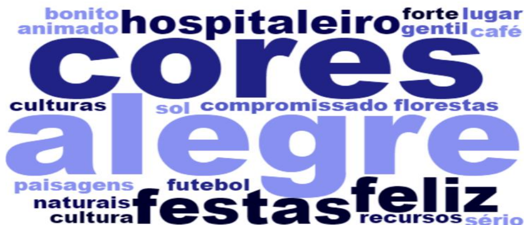
Figura 13: Nuvem atributos positivas

Novamente, para ilustrar as principais palavras utilizadas para fundamentar as reflexões, será utilizado o recurso visual da nuvem, no qual as palavras mais citadas aparecem em fontes maiores. Primeiramente, vamos caracterizar as palavras com teor positivo, utilizadas principalmente para elogiar aspectos nacionais como o povo e a cultura.