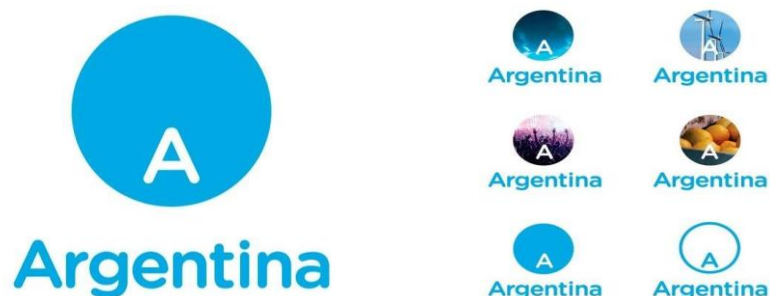
Figura 6: Marca Argentina 2018