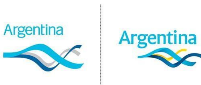
Figura 5: Logos Argentina

A identidade foi modernizada em 2012 e detalhes como a fonte e a cor de uma faixa foram alteradas. Contudo, a ideia que o logo transmite é a mesma. As formas curvas representam dinamismo, mudança, transformação e dão charme ao desenho; a origem comum das faixas e a diversidade das mesmas sugere diversidade na unidade; e as cores escolhidas são caracterizantes do país. Abaixo, a figura 5 que apresenta o logo de 2006, à esquerda, e o logo reformulado no ano de 2012, à direita: