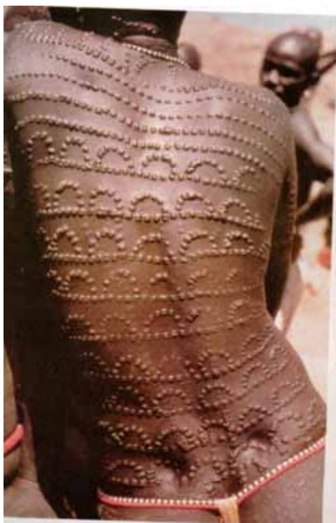
Figura 13. Escarificação tribal da região do Sudão, África.