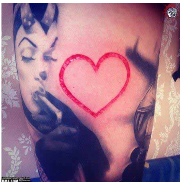
Figura 14. Escarificação em forma de coração feita com a técnica de skinning .

No contexto das modificações corporais existem atualmente inúmeras técnicas para a execução das escarificações. Dentre as formas mais conhecidas existem o cutting , feito através de cortes na pele com bisturi ou lâmina cirúrgica, o skinning (figura 14), que remove tecidos da pele com o uso de bisturi e o branding , que geralmente é gravado na pele a partir de uma queimadura com uma peça de metal aquecida (figura 15). Há também outras formas de fazer escarificações a partir da aplicação de químicos (ácido clorídrico e sulfúrico, por exemplo), entre outros meios menos convencionais.