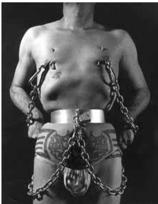
Figura 27: Fakir Musafar durante a execução de um dos jogos com o corpo.

É possível observar que nesse jogos não existem apenas práticas relacionadas ao piercing , tatuagem, escarificação ou implante; o espartilho foi um elemento muito usado em várias épocas e as dietas alimentares, bronzamento e uso de salto alto permanecem como hábitos de nossa cultura até hoje.