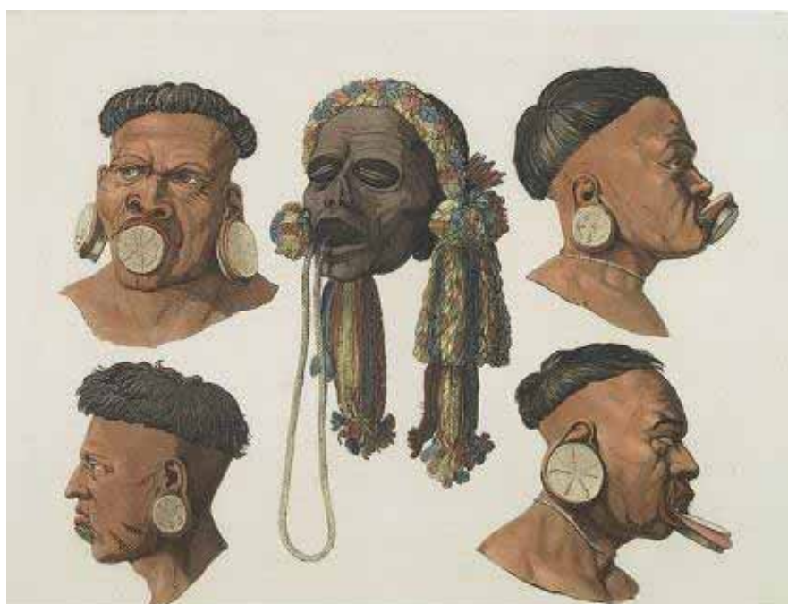
Figura 22. Ilustração de botocudos, índios de origem macro-jê, chamados dessa forma devido aos adornos - botoques - que usavam nos lábios e lóbulos das orelhas. (Fonte: < http://www.tudoporaqui.com.br/prefeitura-municipal-de-campo-do-tenente.html > Acesso em 18/11/2013)

São vastos os registros de escarificações (pigmentadas ou não) e tatuagens feitas por tribos brasileiras. Ao chegar no Brasil as tripulações de Pedro Álvares Cabral se depararam com muitos indígenas com os corpos marcados e adornados (alguns possuíam tatuagens definitivas, outros não, variando de acordo com a tribo). O comerciante francês Paulmier de Gonneville relatou ter visto índios tupiniquins e tupinambás com escarificações e lábios perfurados com pedras verdes encaixadas – uma espécie de piercing .