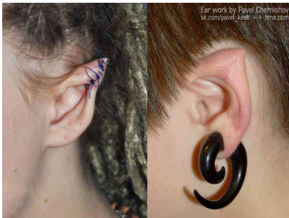
Figura 17. Ear pointing durante e após cicatrização.

É necessário ressaltar que ambas as práticas descritas nesta seção do trabalho são procedimentos cirúrgicos feitos à base de anestesia e devem ser realizadas por profissionais especializados para não trazer riscos à saúde.