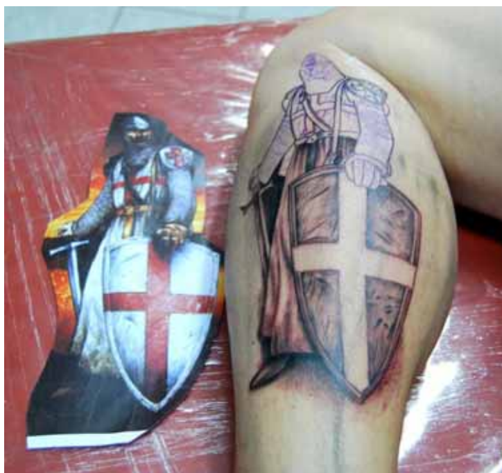
Figura 36. Tatuagem de templário em andamento na perna de Cléber.

“Pra mim, essa tatuagem que foi retocada tem a ver com alguém levando uma flâmula escrito Ícaro e as outras três tem a ver com os templários.”