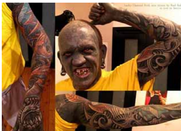
Figura 39. Lucky Diamond Rich.