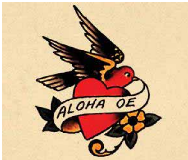
Figura 11. Desenho de tatuagem com motivo americano feito pelo tatuador Sailor Jerry. (Fonte: < http://sailorjerry.com/tattoos/ > Acesso em 18/11/2013)