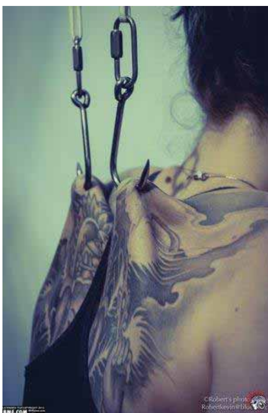
Figura 18. Ganchos colocados nas costas durante a suspensão Suicide .

A suspensão corporal consiste na elevação de um indivíduo por ganchos ou anzóis perfurados em diferentes pontos de seu corpo; “a quantidade de anzóis/ganchos é determinada pelo peso do indivíduo; já a posição em que o corpo será elevado e o tempo que a suspensão vai durar dependem do domínio que o sujeito tem sobre seu corpo” (PIRES, 2005, p.148). As formas de suspender o corpo são diversas, estima-se que existe cerca de 40 posições em que o corpo pode ser suspenso, a mais comum é conhecida como Suicide , onde são colocados dois ganchos na parte superior das costas (figura 18).