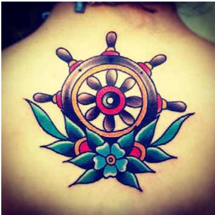
Figura 9. Tatuagem na região das costas em estilo tradicional americano – Old School .

A técnica de execução da tatuagem consiste em inserir permanentemente pigmentos (normalmente tinta especial para esta finalidade) na pele na maioria das vezes por meio de agulhas e é a forma de modificação corporal mais conhecida e popular atualmente (junto com o body piercing ). Técnicas de remoção atuais permitem que um desenho possa ser apagado do corpo, porém ainda é um processo demorado e muitas vezes mais doloroso que o de fazê-la e também mais caro.