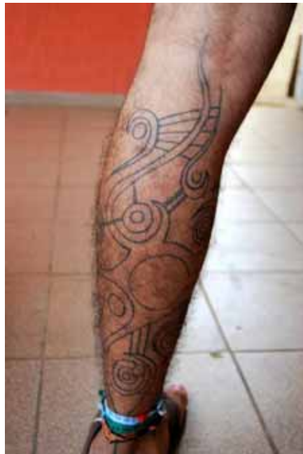
Figuras 32 e 33. Tatuagens de Tom nas costas e perna, respectivamente.