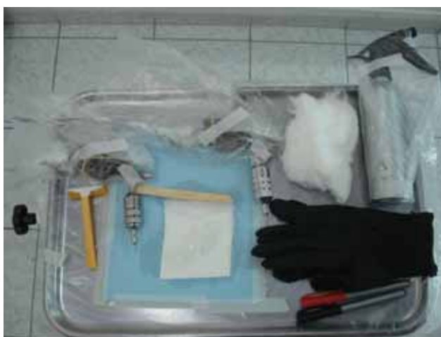
Figura 28. Equipamentos para tatuagem devidamente higienizados e isolados de acordo com as normas de biossegurança.