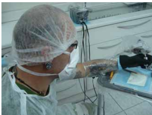
Figura 29. Maneira como o tatuador deve trabalhar seguindo as normas de biossegurança.