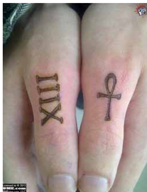
Figura 15. Branding feito nos dedos das mãos.

No Brasil é difícil encontrar profissionais pioneiros nessa prática, dificultando o acesso à informação de como ela chegou ao país. No ano de 2006 foi realizada a primeira convenção de escarificação nacional, a Conscar, que aconteceu no Iritsu Tattoo Shop em São Paulo. Até hoje já acontecerem três edições do evento.