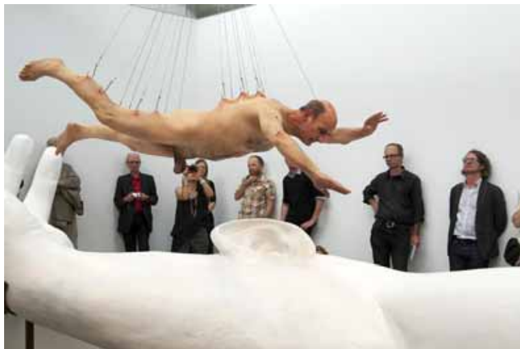
Figura 2. Stelarc durante a performance "Ear on Arm suspension", de 2012.

O corpo é exaltado através da exibição, como se essa exaltação pudesse substituir o eu deteriorado ou criar uma nova identidade para o sujeito. O sinônimo de beleza atual se transparece nos corpos jovens, saudáveis e supostamente perfeitos, cultuando o corpo e uma cultura do narcisismo que se faz presente tentando aproximar os corpos cada vez mais do padrão de beleza estabelecido/ imposto.