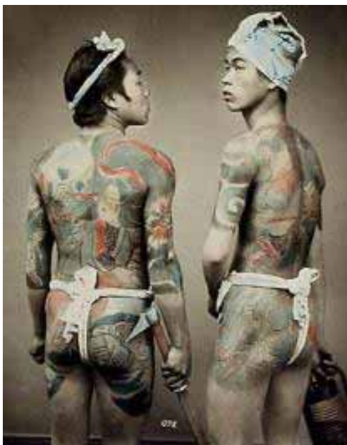
Figura 25. Homens tatuados com motivos japoneses entre os séculos XIX e XX.

A prova maior de que a tatuagem havia realmente retomado o Ocidente foi em meados de 1800, quando os marinheiros passaram a tatuar “motivos europeus” em seus corpos. Além da tatuagem, outras técnicas da body modification conquistaram totalmente não só a Europa, mas também a América. Pessoas passaram a virar “atrações circenses”, percorrendo regiões e contando aos públicos suas histórias e exibindo seus corpos marcados e perfurados. Além disso em meados do século XIX muitas cidades portuárias foram invadidas por marinheiros tatuados e tatuadores que viajavam pelo mundo nos navios marcando corpos pelo mundo todo, inclusive no Brasil.