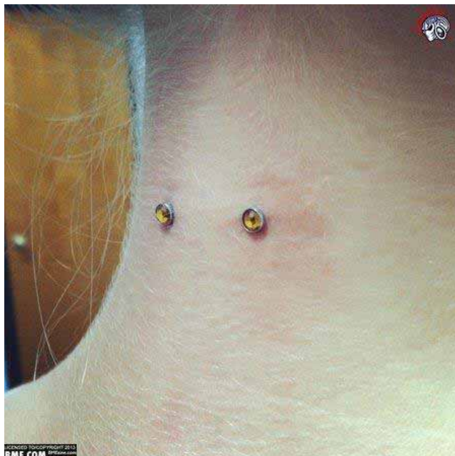
Figura 4. Tipo de surface piercing na região da nuca.

Existe também a possibilidade de expansão de brincos nos lóbulos ou cartilagem das orelhas, lábios e até mesmo do nariz e septo, conhecidos como alargadores ou expansões (figura 6). Tribos primitivas, inclusive no Brasil, realizavam essas expansões para demonstrar status social e com fins estéticos. Atualmente é uma forma bastante comum entre os adeptos das modificações corporais. Em geral as joias das expansões são feitas de aço cirúrgico, acrílico e algumas em bambu ou madeira por diminuírem o odor na região expandida.