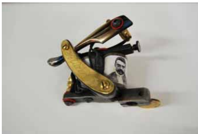
Figura 12. Modelo de máquina de tatuagem atual. Existem também outros modelos com diferentes designs e funcionalidades.

As primeiras máquinas produzidas e comercializadas em território nacional surgiram em Rio Claro, fabricadas artesanalmente por um homem conhecido como Mr. Rudy, que logo se espalharam pelo Brasil, facilitando a vida de tatuadores que não compravam materiais importados. Com o tempo surgiram outros fabricantes na região do Rio de Janeiro e atualmente o mercado nacional de materiais em geral é bem amplo, com sites que vendem pela web máquinas, tintas, agulhas e também materiais da parte de higiene e cirúrgica. Atualmente os profissionais tatuadores precisam seguir uma série de medidas de higiene e biossegurança em seus estabelecimentos para evitar a contaminação dos clientes; a grande maioria do material utilizado é descartável ou deve ser devidamente esterilizado.