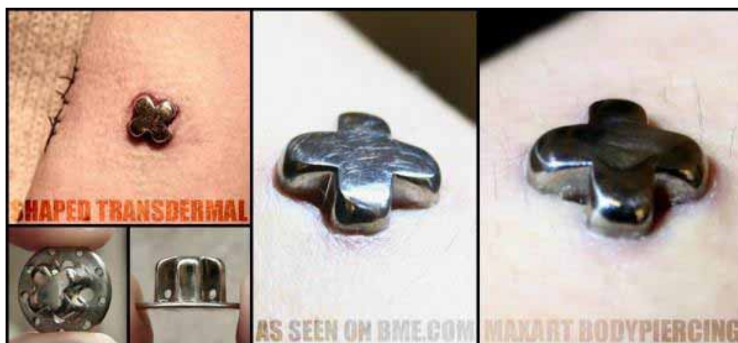
Figura 7. Colocação de implante transdermal. A joia cria um aspecto biomecânico no corpo.

Poucas informações foram encontradas na web sobre como é implantada a joia transdermal, apesar da quantidade de fotos pouco se explica a respeito do processo, mas sabe-se que sua colocação parcial sob a pele pode ter um tempo de cicatrização demorado, dependendo do organismo da pessoa que o coloca. Na maioria dos casos acontece a rejeição do corpo, que após um determinado tempo expõe a joia.