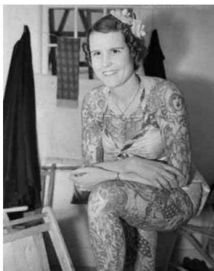
Figura 26. Betty Broadbent, artista circense americana do século XX tinha tatuagens espalhadas por todo o corpo.

A prova maior de que a tatuagem havia realmente retomado o Ocidente foi em meados de 1800, quando os marinheiros passaram a tatuar “motivos europeus” em seus corpos. Além da tatuagem, outras técnicas da body modification conquistaram totalmente não só a Europa, mas também a América. Pessoas passaram a virar “atrações circenses”, percorrendo regiões e contando aos públicos suas histórias e exibindo seus corpos marcados e perfurados. Além disso em meados do século XIX muitas cidades portuárias foram invadidas por marinheiros tatuados e tatuadores que viajavam pelo mundo nos navios marcando corpos pelo mundo todo, inclusive no Brasil.