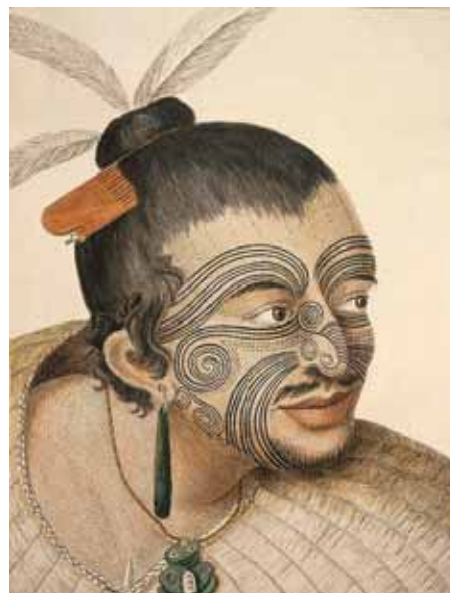
Figura 21. Ilustração feita por Sydney Parkinson de homem Maori, Nova Zelândia.