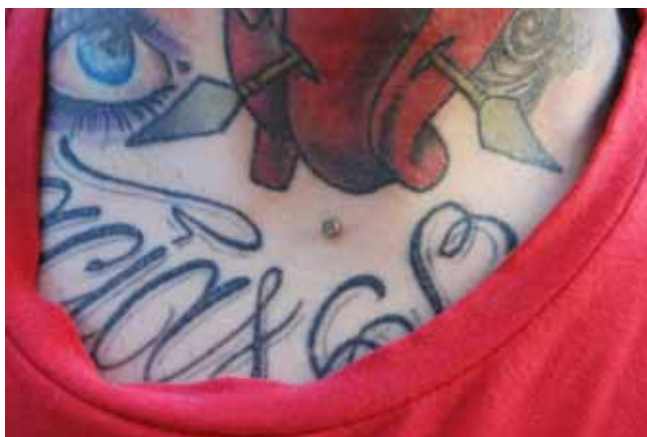
Figura 5. Piercing microdermal na região do tórax.

Existe também a possibilidade de expansão de brincos nos lóbulos ou cartilagem das orelhas, lábios e até mesmo do nariz e septo, conhecidos como alargadores ou expansões (figura 6). Tribos primitivas, inclusive no Brasil, realizavam essas expansões para demonstrar status social e com fins estéticos. Atualmente é uma forma bastante comum entre os adeptos das modificações corporais. Em geral as joias das expansões são feitas de aço cirúrgico, acrílico e algumas em bambu ou madeira por diminuírem o odor na região expandida.