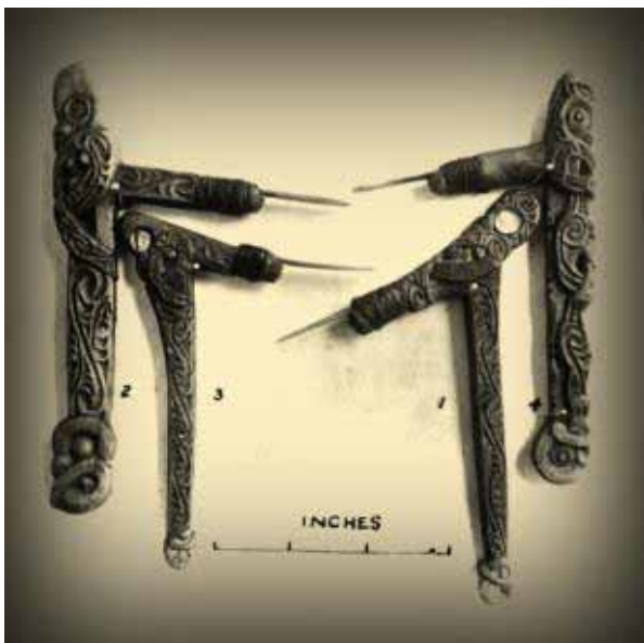
Figura 20. Instrumento de origem Maori utilizado na prática da tatuagem. Normalmente eram feitos a base de madeira e ossos de animais.

Desde o início da descoberta das marcas corporais por povos europeus o preconceito e aversões sempre existiram, mas é importante entender que antes da prática de tatuar e fazer modificações no corpo inserir-se na cultura brasileira e do resto do mundo da maneira como é atualmente, ela foi usada por índios e civilizações antigas, porém com outros significados: para diferenciar suas tribos, como estética, crença, estilo de vida e até mesmo espiritualidade. Além do Brasil, povos da região do Oceano Pacífico e Oriente como o Havaí, Nova Zelândia, Tailândia, Indonésia, Japão, entre outros, tatuavam-se para mostrar sua autenticidade, hierarquia social, sua cultura e arte local.