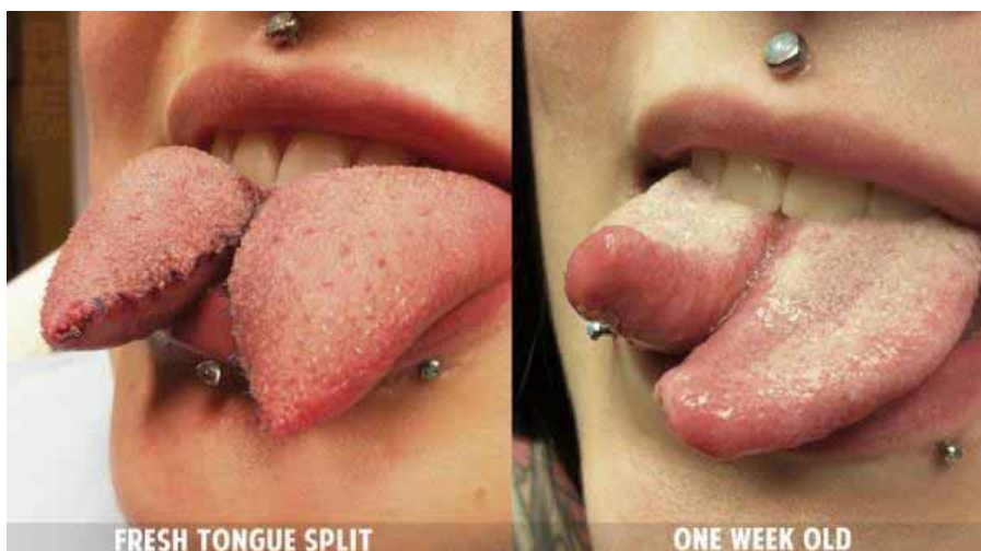
Figura 16. Tongue splitting antes e após a cicatrização. Técnica de execução não definida.

A prática contemporânea do tongue splitting iniciou-se em meados dos anos 90 e popularizou-se entre amantes da modificação corporal extrema após os anos 2000, período que também começaram a ser vistas no Brasil. Devido à aparência que lembra a língua de uma serpente, muitas vezes pode ser encarada como uma prática estranha ou incomum à primeira vista. Deve-se procurar um profissional qualificado que saiba realizar o procedimento dentro dos padrões de higiene e segurança para evitar infecções.