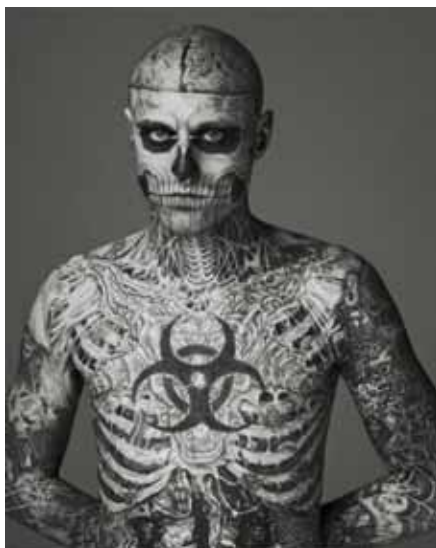
Figura 38: Rick Genest, conhecido como Zombie Boy .

Existem indivíduos conhecidos por suas modificações corporais extremas, vistas como estranhas já que alteram formas e pigmentação de todo o corpo, até mesmo adotando formas não humanas. Lucky Diamond Rich tem seu corpo 100% coberto de tatuagens e ainda assim cria mais desenhos em cima da pele já pigmentada. Outro sujeito muito conhecido por suas tatuagens é Rick Genest, o Zombie Boy ou Skull Boy , modelo canadense que tem seu corpo todo tatuado com ossos, terminações nervosas e músculos, assemelhando-se a um zumbi, exibindo camadas internas da pele através das tatuagens.