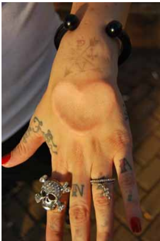
Figura 8. Implante subdermal cicatrizado em forma de coração.

Por se tratar de um procedimento cirúrgico, os cuidados e a procura de um bom profissional para a execução são indispensáveis e deve-se ter cuidado na aplicação de anestésicos que não causem reações alérgicas. Como as joias ficam totalmente debaixo da pele o procedimento tem mais aceitação e impossibilidade de rejeição do corpo do que o implante transdermal.