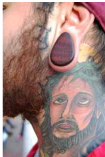
Figura 6. Expansão em formato oval no lóbulo da orelha.