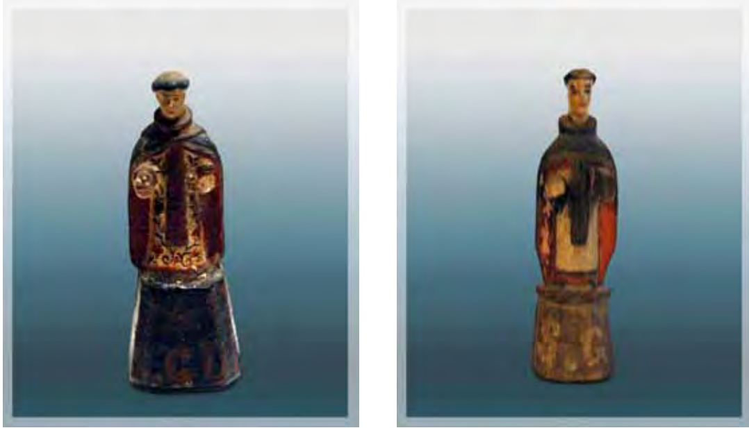
Ilustração 29 – São Gonçalo padre, século XIX – col. part. Dito Pituba, barro cozido – 16 cm