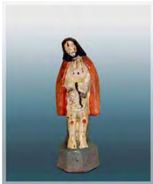
Ilustração 19 – Bom Jesus, século XIX – MIC (SP) Dito Pituba, barro cozido, 13 cm

Sem se dar conta do fenômeno, estimularam sua confecção e por consequência o aprendizado que passou de geração em geração, constituindo-se em uma criação bastante original e, ao mesmo tempo em que representavam os santos católicos, fortaleciam uma fé que alimentava o inconsciente de uma população carente.