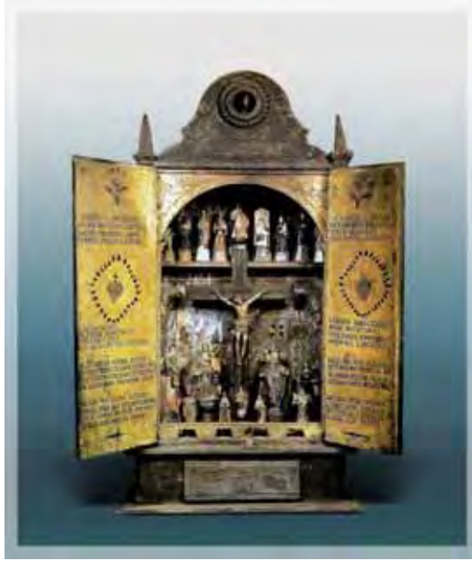
Ilustração 18 – Oratório doméstico, século XIX – MAS (SP) Dito Pituba, madeira policromada, 124 cm

Dado o exposto, os santeiros tinham a liberdade ao expressar as suas interferências criativas decorativas para causar maior empatia entre os devotos, especialmente quando se tratava de artefatos para o melhor desempenho da vida religiosa que, neste caso, se estendia para o convívio familiar e, conseqüentemente, o social, um objeto que centralizava o exercício da fé e legitimava o caráter devocional de um olhar angustiado piedoso. Neste universo místico, o oratório era usado como um veículo de conexão imediata com os santos de devoção.