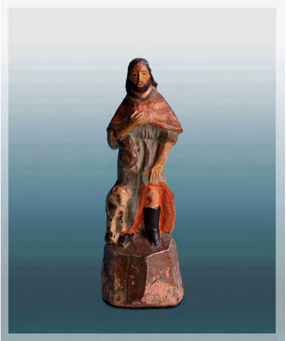
Ilustração 42 – São Roque