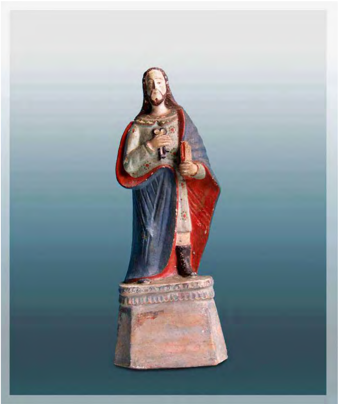
Ilustração 48 – São Pedro Apóstolo