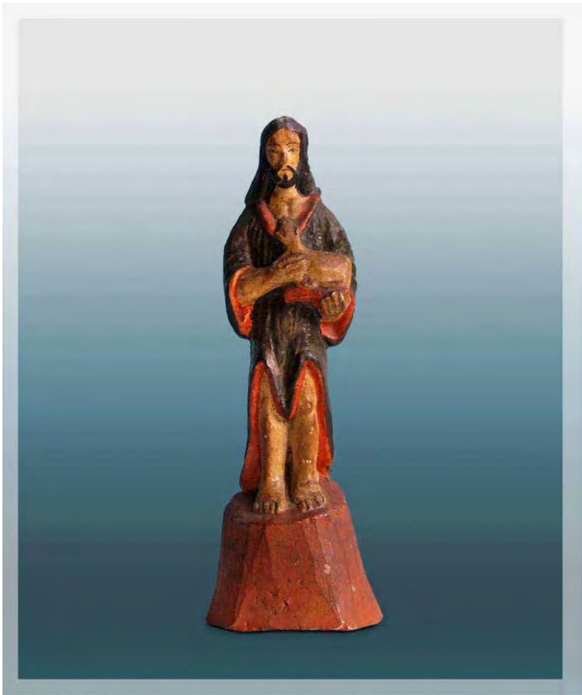
Ilustração 43 – São João Batista