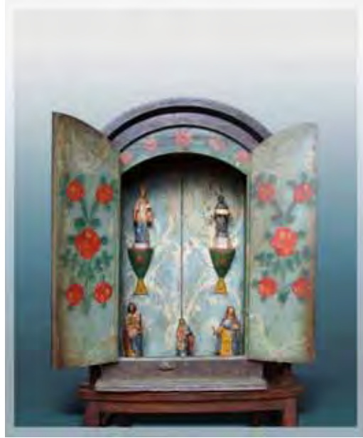
Ilustração 17 – Oratório doméstico com Paulistinhas – século XIX – MAV (SP) Sem atrib., madeira policromada – 70 cm