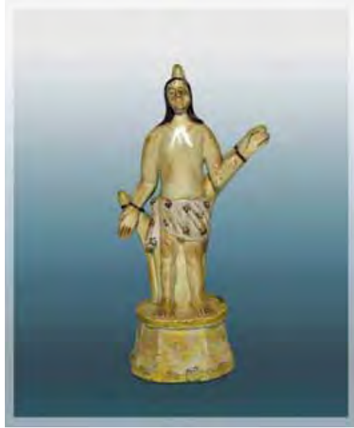
Ilustração 24 – São Sebastião, século XIX – MIC (SP) Sem atribuição, barro cozido – 15 cm

Conforme mencionado alhures, o aspecto formal destas imagens foi apurado pela capacidade criadora dos santeiros e foram convertidas, sacralizadas e veneradas pelos devotos que possuíam a convicção de que a fé transcendia todas as formas, ignorava os invólucros materiais das representações e ao mesmo tempo tinham primazia por possuí-las para meditação contemplativa.