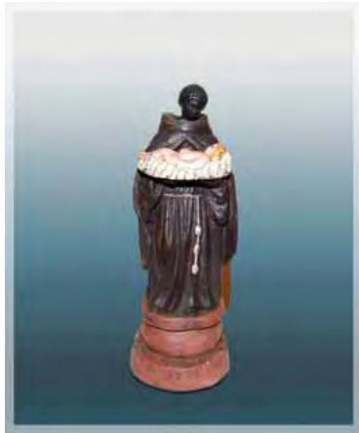
Ilustração 25 - São Benedito, século XIX – MAV (SP) Sem atrib., barro cozido – 19,5 cm

A propósito dos procedimentos usados para pintura, a aplicação da tinta nas imagens de barro era feita depois do cozimento, com a peça seca e ainda quente para maior absorção da tinta. As cores que predominam no panejamento destas pequenas imagens sacras eram o azul e o vermelho; o rosa para a carnação das invocações de santos brancos; para a invocação de São Benedito, o preto que também era aplicado nos cabelos e barbas.