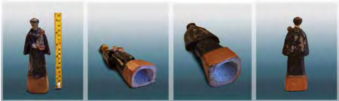
Ilustração 31 - Santo Antonio, século XIX – col. part. Dito Pituba, barro cozido - 15 cm

A partir da confirmação de sua lavra, houve também a constatação de outras características que apontam sua autoria, denominadas como cacoetes do santeiro. Identificamos, em particular, nas suas Paulistinhas , na parte que compreende a peanha, no lado interno ou até mesmo externo, uma curiosidade, a letra S . Quando feita por ele é ligeiramente inclinada, um tanto peculiar, que chega a ser um dentre vários outros cacoetes do santeiro; isso também se aplica ao feitio dos números do ano de produção.