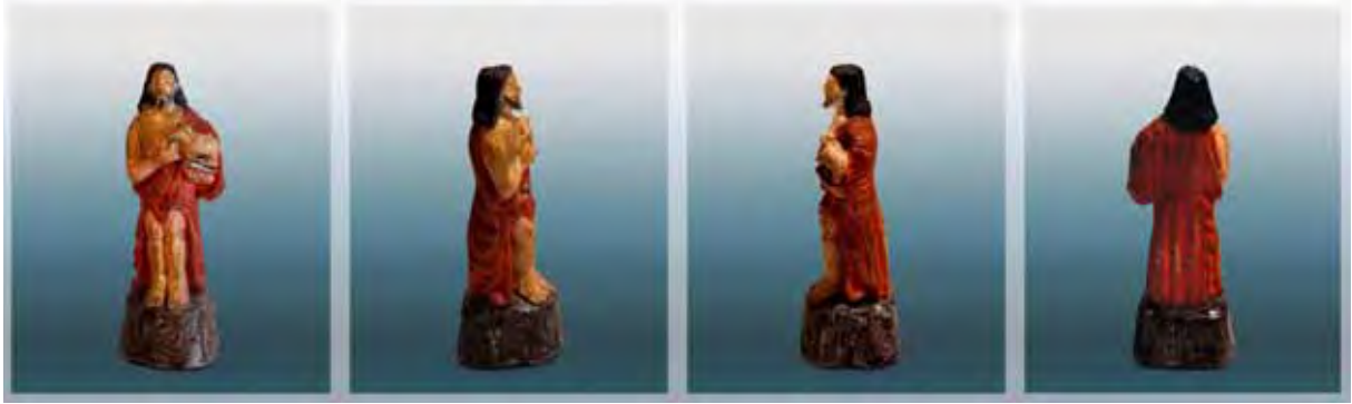
Ilustração 28 – São João Batista, século XIX – col. part. Dito Pituba, barro cozido – 15 cm

O estudo nos leva a reconhecer que há uma autonomia na feitura das imagens sacras deste referido santeiro, que se libertou da dependência de moldes, procedimento pelo qual, acreditamos por evidências, muitas Paulistinhas foram moldadas. Seu zelo pela ocupação nos levou a concluir, ao perpassar a metodologia escolhida, que houve uma compreensão e assimilação estrutural, ou seja, a partir da sua percepção do objeto, houve uma pregnância da sua forma e por meio desta percepção mais aguçada, por se tratar de um hábil artífice, buscou a melhor maneira de dar sentido à representação, assim sendo pôde então exercer sua capacidade criadora e neste sentido combinou materiais e incorporou elementos até então inusitados, legitimando ao máximo sua singularidade.