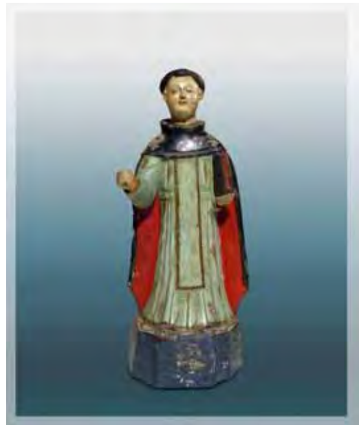
Ilustração 36 - Santa Gertrudes, século XIX – MIC (SP)

Sem atrib., barro cozido – 35 cm (dito de capela)