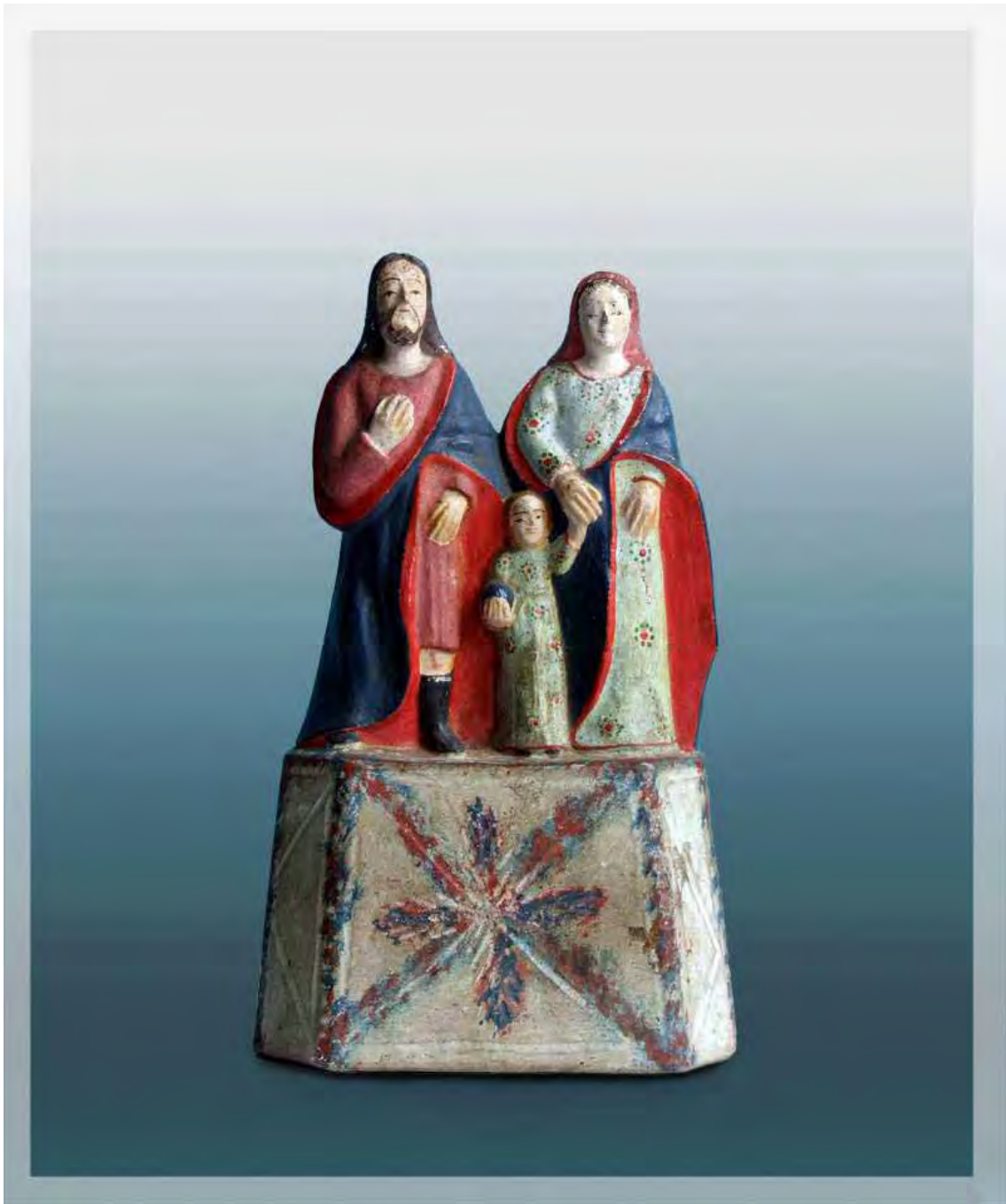
Ilustração 49 – Fuga para o Egito (grupo)