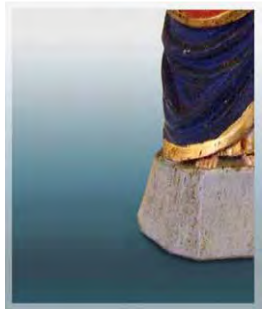
Ilustração 23 – Sagrado coração de Jesus, século XIX – MAV (SP) pormenor da mesma peça com douramento Sem atrib., barro cozido – 17 cm

Convém, por oportuno, ressaltar que no transcurso da sua confecção, em particular na produção do santeiro Dito Pituba, a modelagem das Paulistinhas era