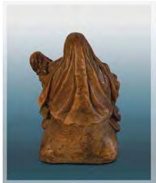
Ilustração 7 - Nossa Senhora da Piedade século XVIII – col. part. Sem atrib., , barro cozido, 30 cm