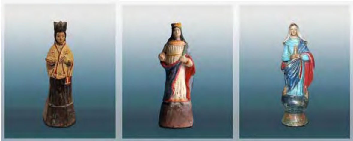
Ilustração 20 – Santo Bispo – século XIX – col. part. Sem atrib., barro cozido – 15 cm