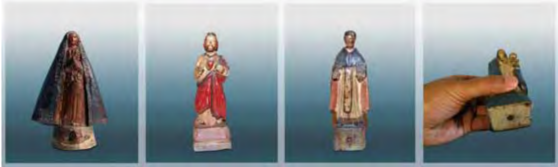
Ilustração 32 – Nossa Senhora Conceição Aparecida, século XIX – MAV (SP)

Dito Pituba, madeira policromada - 25 cm