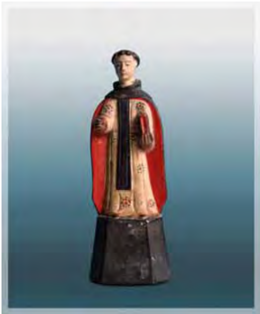
Ilustração 10 - São Gonçalo padre, século XIX Sem atrib. , barro cozido - 18,5 cm – MAV (SP)

Cumprindo as muitas solicitações de uma fervorosa sociedade, ávidos por alcançar uma graça, na qual eles também estavam inseridos, devotos remanescentes deste espírito barroco que estimulava esta relação de interação do devoto com a imagem para a realização do teatro sacro, nutriam a atitude de venerar seus padroeiros, até então restritos aos locais sagrados, e passam a produzir sua versão singela nas formas em barro ou madeira, permitindo, a partir de então, que o devoto, por mais humilde que fosse, tivesse seu santo protetor dentro de casa, para ser solicitado a qualquer hora ou ocasião.