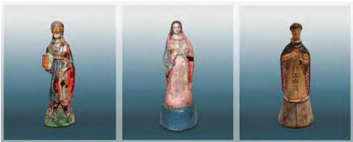
Ilustração 13 – São José de Botas, século XIX – col. part. Sem atrib., barro cozido - 14,5 cm