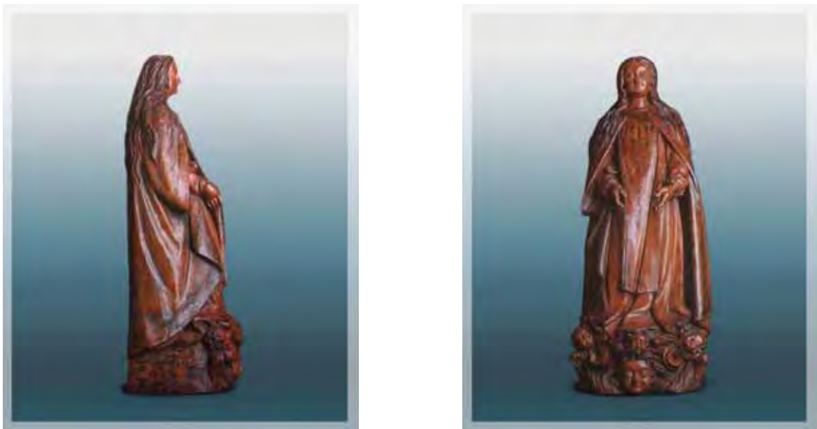
Ilustração 5 - Nossa Senhora do Ó, século XVII – col. part. Frei Agostinho de Jesus – barro cozido, 50 cm

Nesta época é que se difundem as primeiras imagens da Nossa Senhora do Ó ou da expectação, como também é conhecida, que representam a Virgem Maria com o ventre crescido e com as mãos sobre o escapulário, indicando o fim da gravidez, algumas chegam a apresentar um domínio bastante aprimorado na sua modelagem, levando-nos a concluir fazerem parte das oficinas conventuais da ordem beneditina que deu origem a outras oficinas, então laicas, das regiões de Itu, Tietê, Sorocaba, Itapeverica da Serra e da capital.