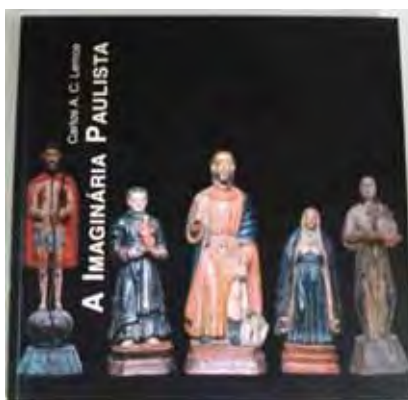
Ilustração 51 - Capa do catálogo da exposição realizada em 1999/2000

Houve também na Pinacoteca 21 do Estado de São Paulo, de 15 de dezembro de 1999 a 13 de fevereiro de 2000, sob a curadoria de Carlos Lemos a exposição “A Imaginária Paulista” com peças provenientes do M.A.S e de coleções particulares, na qual as Paulistinhas tiveram algum destaque.