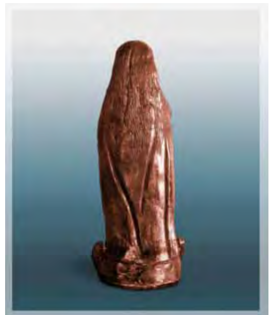
Ilustração 4 – Nossa Senhora da Conceição Aparecida, século XVII – SNA (SP) Atrib. Frei Agostinho de Jesus – barro cozido, 40 cm