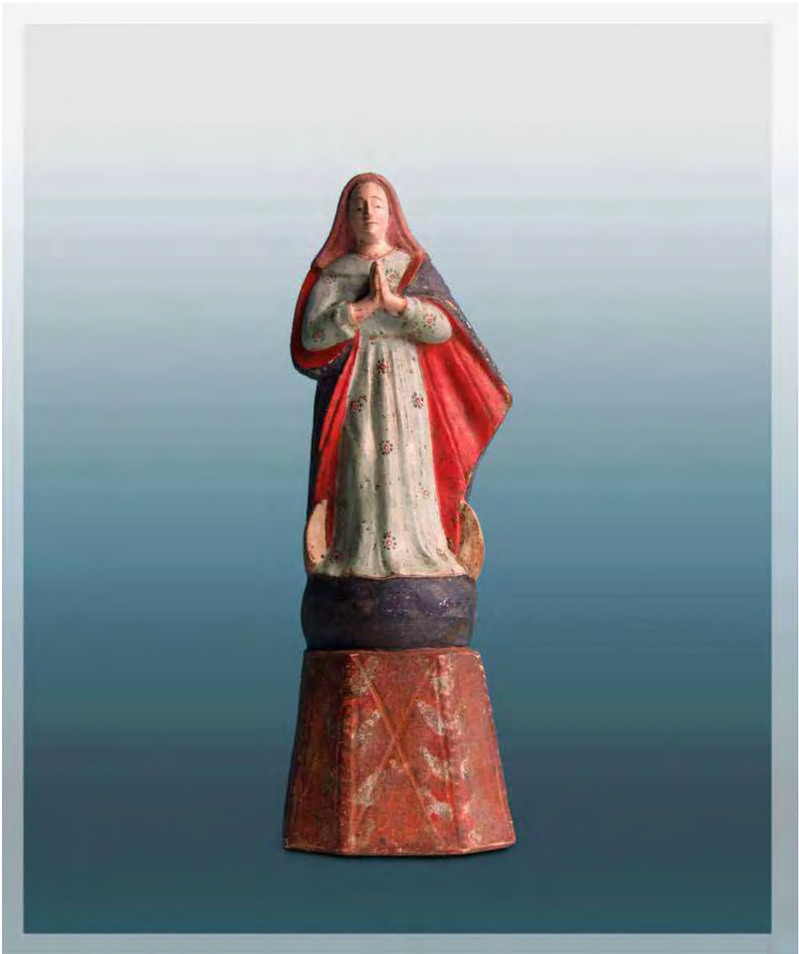
Ilustração 47 – Nossa Senhora da Conceição