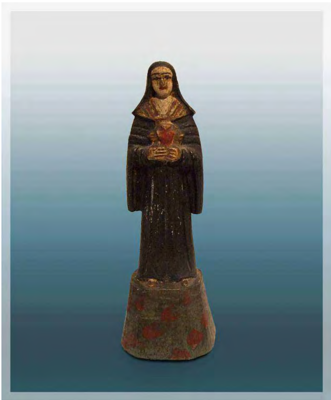
Ilustração 44 – Santa Gertrudes