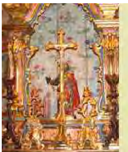
Ilustração 52 - imagem de divulgação da exposição realizada em 2007/08

Alguns anos depois, a exposição realizada no museu Afro Brasil 22 “A Divina Inspiração Sagrada e Religiosa” de 24 de novembro de 2007 a trinta de março de 2008, sob a curadoria de Carlos Lemos e Vagner Gonçalves da Silva, mostrou as imagens sacras da religião católica e dos cultos de origem africana, as Paulistinhas estavam presentes, mas sem a relevância merecida.