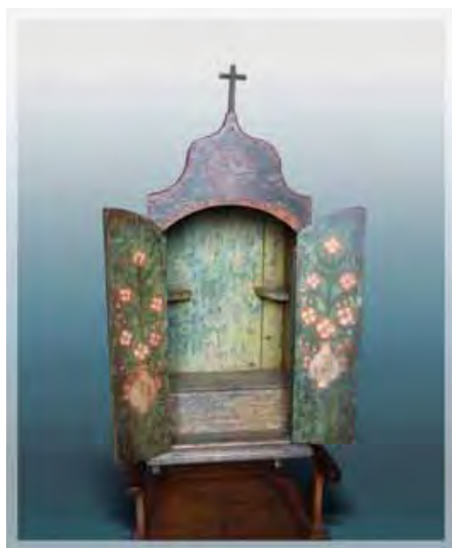
Ilustração 16 – Oratório doméstico, século XIX – MAV (SP) Sem atrib., madeira policromada – 86 cm

Confeccionava também pequenos oratórios, onde as imagens Paulistinhas eram colocadas e pintava com apreço, em seus frontões, delicados ramos de flores. Produziu, seguindo nesta temática, muitos artefatos usados como ex-votos, considerados testemunhos máximos da expressão de fé de um povo agradecido por uma graça alcançada, como também produziu muitas bandeiras de festas votivas.