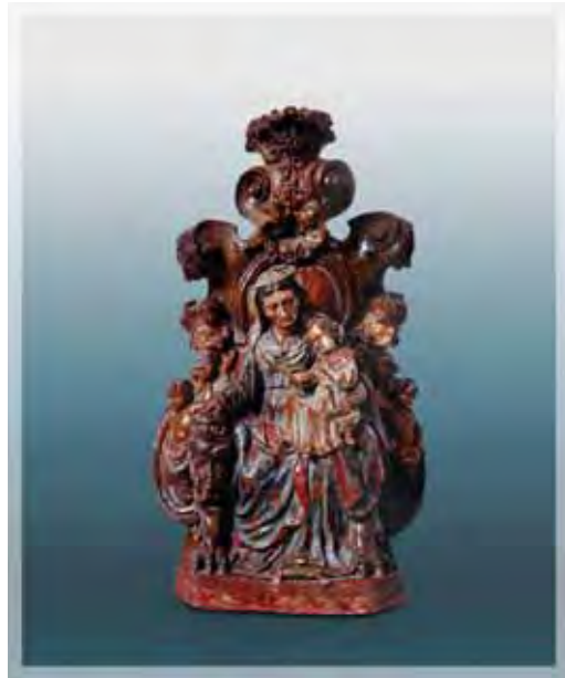
Ilustração 8 - Sant'Anna Mestra século XVIII – col. part. Mestre Bolo de Noiva barro cozido, 52,5 cm

Um santeiro anônimo que produziu inúmeras imagens de boa feitura tinha uma habilidade surpreendente quanto à modelagem, e atuou nas regiões dos Vales do Paraíba e do alto Tietê. Conhecido como mestre Bolo de Noiva possuía como características: as imagens centrais quase que se perdem em meio a tantos elementos decorativos; a cor é muito vibrante; muitas volutas; anjos e atlantes se misturam harmoniosamente. Segundo Carlos Lemos (1999), o apelido foi dado a um santeiro conhecido como Bernardo, escultor ativo, de criatividade inigualável, sem oficina fixa, com produções que podem ser encontradas em cidades como Guaratinguetá, Jacareí, e também nas cidades de Itu e Sorocaba. Recentemente foi constatada uma imagem com suas características, datada de 1753.