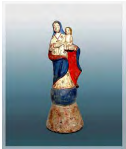
Ilustração 11 – N. Srª do Rosario, século XIX Sem atrib. , barro cozido – 18 cm – col. part.

Convém ponderar o surgimento de vários santeiros no Vale do Paraíba e adjacências que, movidos por este mercado da fé em ascensão desde o final do século XVIII, atuaram brilhantemente durante o século XIX e nas primeiras décadas do século XX, sucedendo outras gerações que também produziram uma pequena imagem de barro, com uma estrutura singular para os padrões vigentes, mas que influíram de maneira expressiva no comércio da imaginária doméstica, os quais usavam o termo a “troca” dos santinhos, pois acreditavam não ser correto vender, propriamente dizendo, a imagem de um santo. A respeito, aduz Eduardo Etzel: