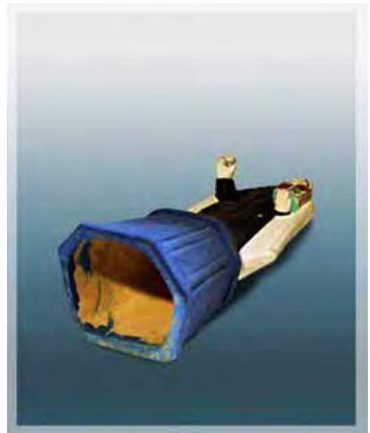
Ilustração 12 – Santa Edwiges, século XIX – MIC (SP) Sem atrib., barro cozido - 17 cm

Como se há de verificar com mais aprofundamento no capítulo seguinte, alguns chegaram a deixar marcas ou mesmo assinaturas que nos permitem atribuir autorias para muitas das encontradas atualmente em acervos de museus