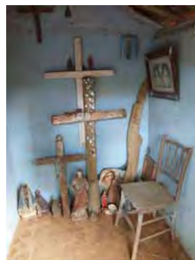
Ilustração 9 – Capela de santa-cruz e interior da capela próximo a Guararema – V. do Paraíba - SP