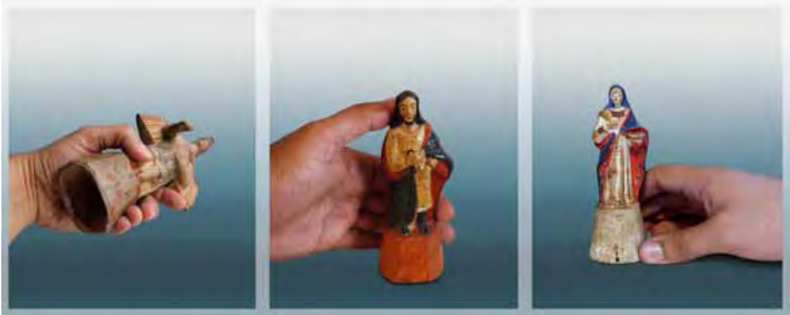
Ilustração 38 - São Miguel Arcanjo, século XIX – MAV (SP) Sem atrib., barro cozido – 15 cm