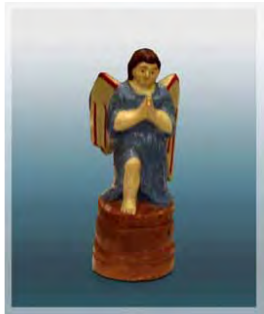
Ilustração 27 – Anjo da Guarda, século XIX – MAV (SP) Sem atrib., barro cozido – 15 cm

Geralmente o santeiro se baseava nas iconografias das imagens retabulares encontradas nas igrejas católicas da região do Vale do Paraíba, muitas delas foram edificadas em louvor a Nossa Senhora da Conceição, Nossa Senhora do Rosário, a Sant'Ana e a São Benedito, todas personificações divinas muito populares, que