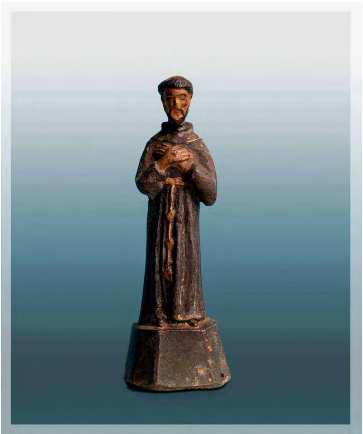
Ilustração 45 – São Francisco de Assis