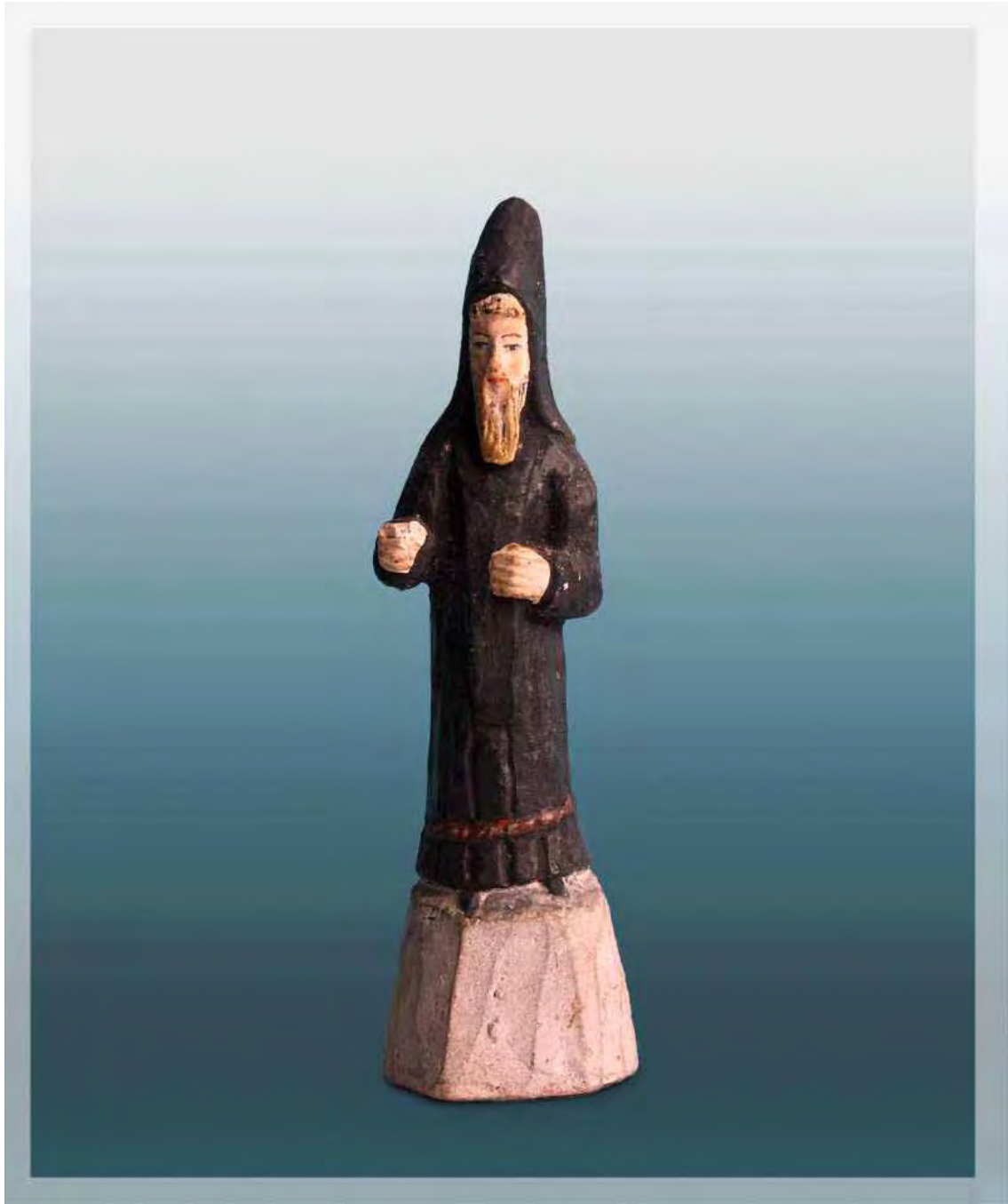
Ilustração 41 – São Bento