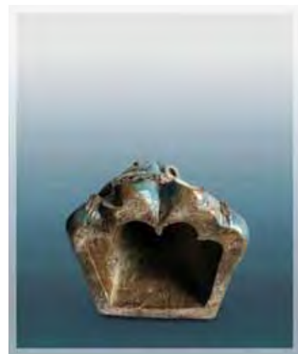
Ilustração 3 - Nossa Senhora do Rosário, século XVII Frei Agostinho de Jesus – barro cozido, 42 cm