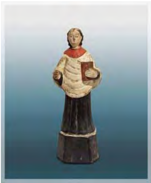
Ilustração 26 – Santo de Batina, século XIX – col. part. Sem atrib., barro cozido – 15 cm

Quanto à iconografia sagrada, que consiste em um elemento de descrição representado visualmente, nos leva a reconhecer e classificar tais invocações como santos mártires, apóstolos de Cristo, ordens monásticas, evocações à Virgem Maria, seja pela indumentária ou pormenores denominados atributos, objetos que se referem à passagem da vida do santo, em que se deu o testemunho de fé, e na qual foi inspirada sua personificação, decodificada como símbolo e transformada em prediado pessoal ou de coletividade quando ligado a uma ordem monástica.