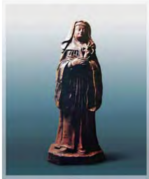
Ilustração 6 - Santa Gertrudes, século XVII – MAS (SP) Sem atrib. – barro cozido, 38 cm

maioria, de feitura popular, ou seja, feitas por santeiros habilidosos que não deixaram registros de sua autoria, mas iniciaram uma significativa produção com características regionais.