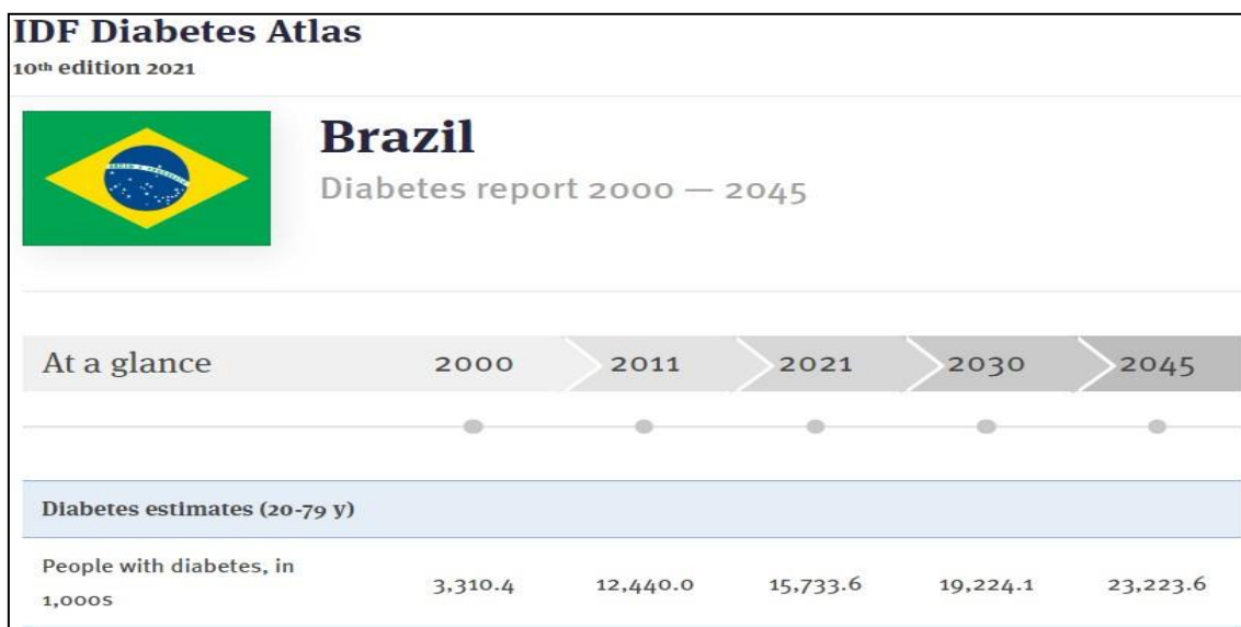
Figura 3: Estimativa de DM no Brasil de 2000 – 2045.

Em 2021, no Brasil, estima-se que 15,7 milhões de adultos viviam com DM. Pode-se observar também que a prevalência de adultos que viviam com DM no início do século XXI (anos 2000) era de 3,3 milhões. Dessa forma, em um período de 20 anos, houve um aumento de 376% na prevalência de DM em adultos no Brasil. Estima-se que, em 2045, haverá cerca de 23,2 milhões de adultos com DM no país, um aumento de 48% em relação à 2021 (Figura 3).