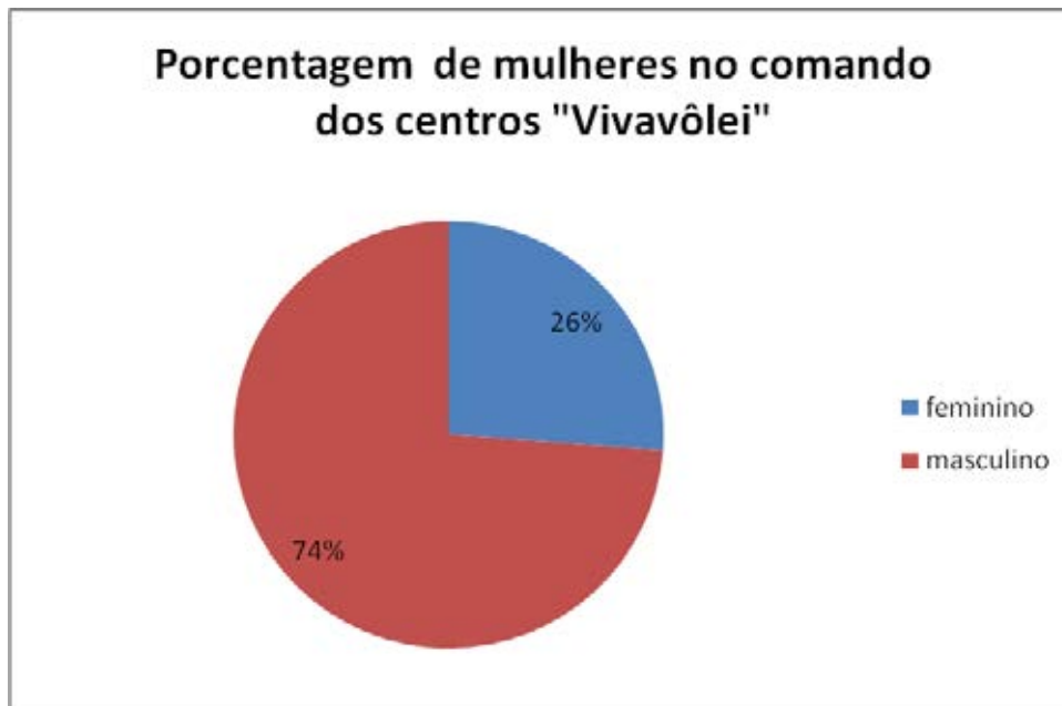
Gráfico 1: Porcentagem de mulheres à frente dos centros do “Vivavôlei”.

mulher já possui uma abertura mais considerável no ramo de trabalho perante o alto rendimento que apresentou apenas 4% do total.