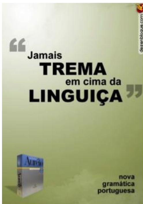
Figura 5. Dicionário Aurélio atualizado com a nova gramática da língua portuguesa