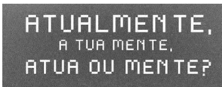
Figura 2. Outro exemplo de recurso fonostilístico.)