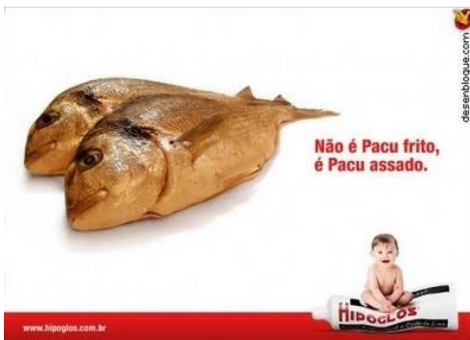
Figura 4. Pomada para assaduras da marca Hipoglös