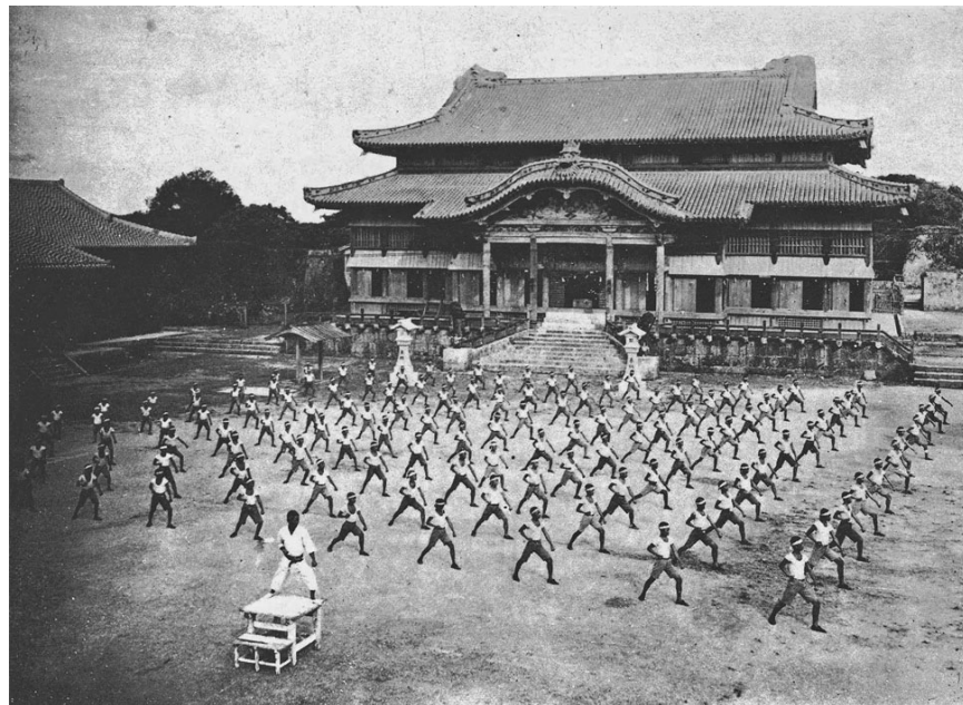
Figura 5 – Apresentação de karate em Okinawa 6

As aulas de karate passam a ser ministradas em espaços próprios, os dojôs e a clandestinidade do karate chega ao fim. Demonstrações de karate tornam-se comuns em Okinawa e no Japão. Em 1917, Funakoshi recebe convite para dar uma demonstração do karate no Butoku-den, o grande pavilhão de Artes Marciais de Kyoto, e essa foi a primeira demonstração de karate fora de Okinawa que foi patrocinada oficialmente.