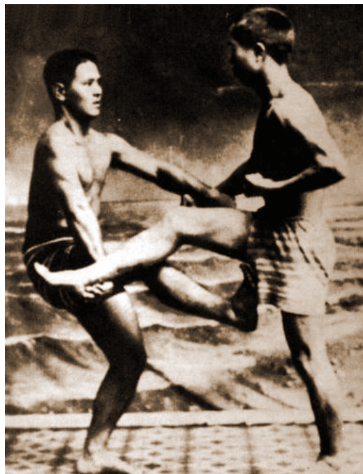
Figura 3 – Treino de karate praticado em locais secretos e sem utilização de uniforme próprio 5

“Com esperança de ver o karate incluído na educação física universal ensinada em nossas escolas públicas, dediquei-me a revisar os katas 4 de modo a simplificá-los o mais possível. Os tempos mudam, o mundo muda e obviamente as artes marciais também devem mudar. O karate que os alunos de segundo grau praticam hoje não é o mesmo que era praticado há dez anos, e é bem grande a distância que o separa do karate que aprendi quando era criança em Okinawa”. (FUNAKOSHI, 1975, p. 47)