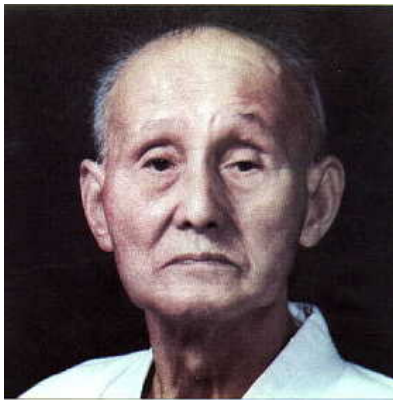
Figura 11 – Hironori Otsuka 11