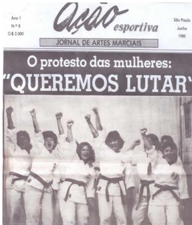
Figura 13 – Mulheres no karate 13

associações de karate registradas na Federação de Pugilismo, foi fundada a Federação Paulista de Karate. A Confederação Brasileira de Karate (CBK) foi fundada em 11 de setembro de 1987 e é a única entidade nacional de karate reconhecida pelo Comitê Olímpico Brasileiro.