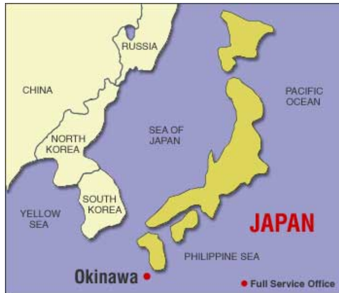
Figura 1 – Localização geográfica de Okinawa 2

Através desse intercâmbio, o kenpo – Arte Marcial chinesa, também conhecida como boxe chinês – foi introduzido em Okinawa tendo suas técnicas mescladas com as já conhecidas pelos mestres okinawanos, dando origem a uma nova forma de luta, que mais tarde seria conhecida como karate. É importante ressaltar que durante certo período, por volta do século XVI, Okinawa era freqüentemente atacada e invadida por clãs que proibiam o porte e a utilização de armas no território okinawano, o que impulsionou o desenvolvimento de uma forma eficaz de combate sem a utilização de armas.