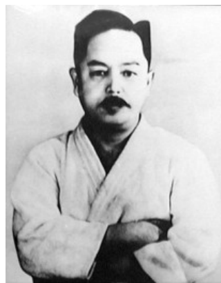
Figura 12 – Kenwa Mabuni 12