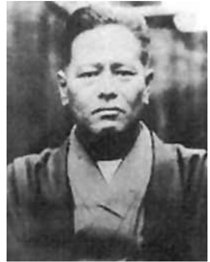
Figura 10 – Chojun Miyagi 10