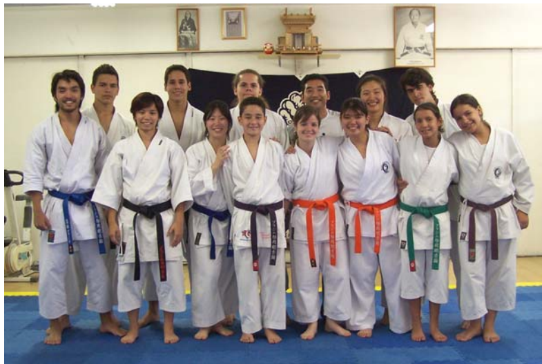
Figura 4 – Karate moderno: espaço e vestimenta próprios para a prática

O karate passa a ter também um uniforme (kimono ou karate-gi) para a prática, assim como uma graduação, utilizando-se o sistema de faixas para designar o grau de desenvolvimento técnico do karateca, semelhante ao adotado por Jigoro Kano no judô, já que os mestres de karate eram amigos deste mestre do judô, que foi um entusiasta para a divulgação do karate no Japão, convidando os mestres de karate para apresentações e encorajando-os a ensinar a arte nas faculdades japonesas.