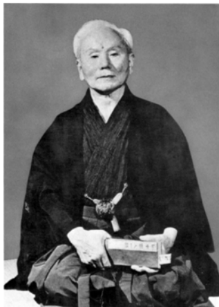
Figura 9 – Gichin Funakoshi 9

Além desses estilos reconhecidos pela WKF, existem os estilos Shorin-ryu, criado por Chochin Chibana, Uechi-ryu formulado por Kanbun Uechi e o Kiyokushin de Masutatsu Oyama que também são bastante populares no mundo.