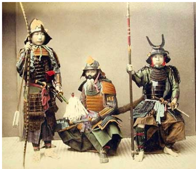
Figura 2 – Armaduras e armas utilizadas pelos samurais 3

As propriedades dos daimiôs eram geralmente muito grandes e necessitavam de proteção para não serem invadidas por outros clãs. Os guerreiros samurais então surgem como um exército pessoal dos daimiôs. Inicialmente escolhidos por sua destreza e força, os samurais acabaram se tornando uma linhagem nobre e hereditária, e suas famílias tomavam conta do território (DALL'OLIO, 2008).