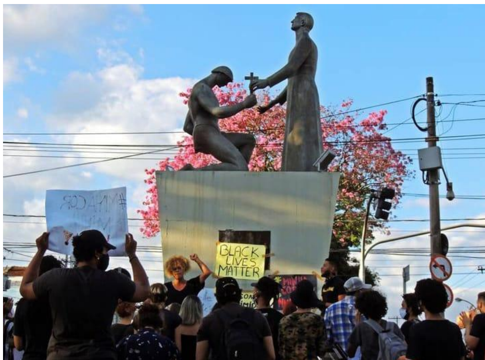
Figura 6. A imagem registra manifestação política ocorrida na cidade de Franca em torno da pauta “Black Lives Matter” 47 , em frente a estátua “Memorial Padre José Anchieta”, localizada no Bairro Nova Franca em Junho de 2020.

A esse respeito, trazemos a imagem a seguir com a intenção de compreendermos a fundo, a partir dela, a ausência de representações positivadas e o não sentimento de pertencimento apontado pela população preta em Franca (SP), enquanto um dos maiores desafios enfrentados pelas mesmas, uma vez que, a cidade é apontada constantemente como solo racista e conservador.