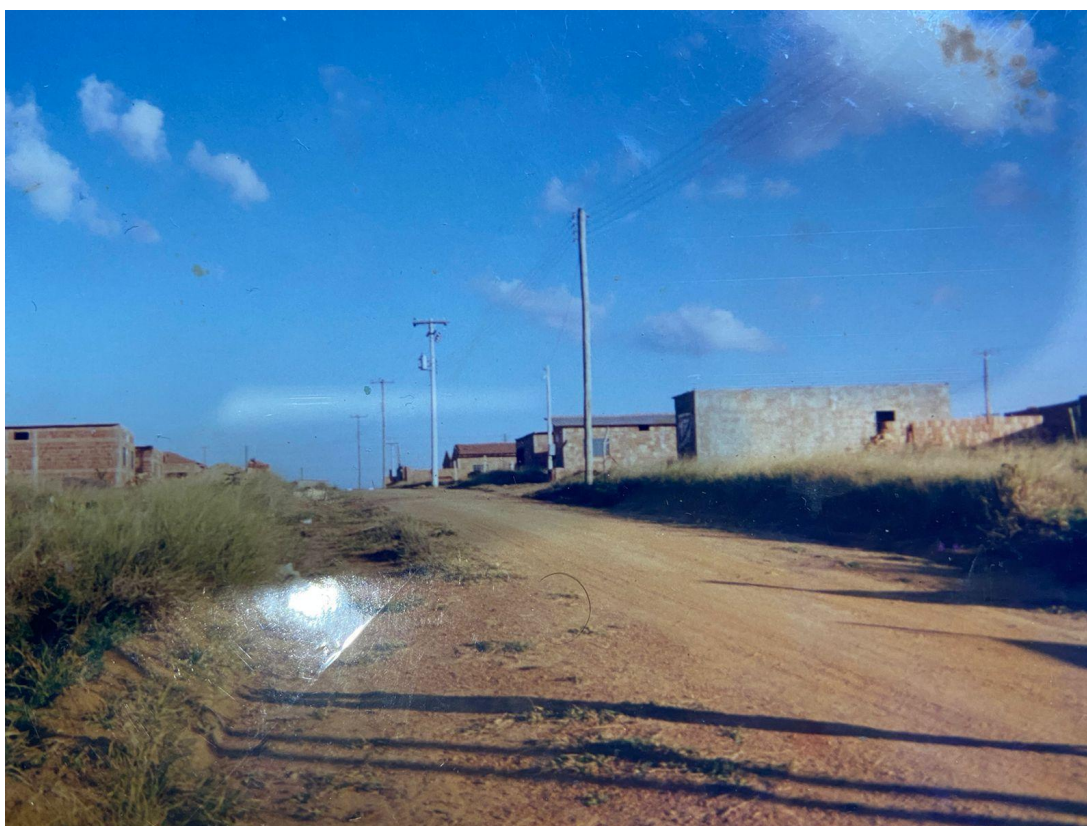
Figura 2: “Bom, eu fui uma desbravadora assim, lá do bairro né” . Imagem do arquivo pessoal da sujeita. É possível a partir da imagem visualizar o bairro Jardim Vera Cruz/ Luiza II, localizado na Região Norte de Franca (SP), ainda em construção.